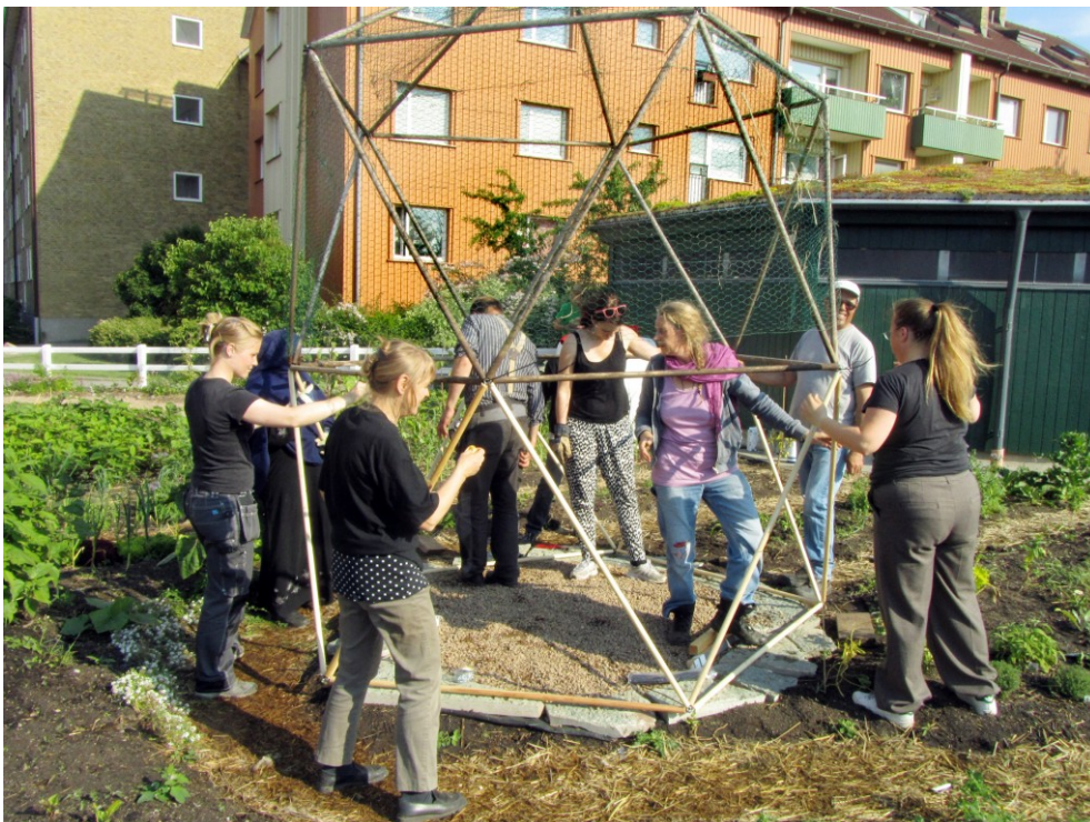
Seved, bild tillhörande Odlingsnätverket Seved.