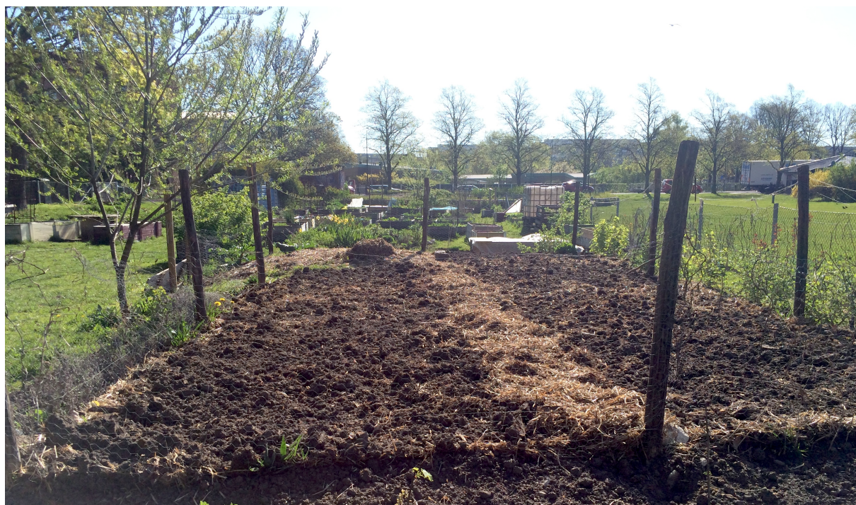
Enskifteshagen