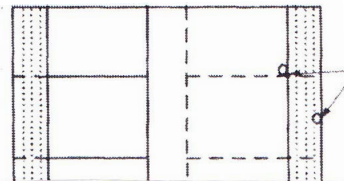
Vattennippelns placering; I bakre delen av boxen samt vid ytterväggen på spalten.

Om man har vattennippelarna vid ytterväggen på spalten är boxarna renare än om vattennippelarna sitter i bakre delen av boxen placerad vid det fasta golvet. Placeringen av vattennippelarna kan man se i figur 1. Detta förklaras med att det vattenspill som blir på den fasta ytan vid den senare placeringen, kan stimulera grisarna att gödsla/urinera där istället för ute på spalten (Hacker et al. 1994).