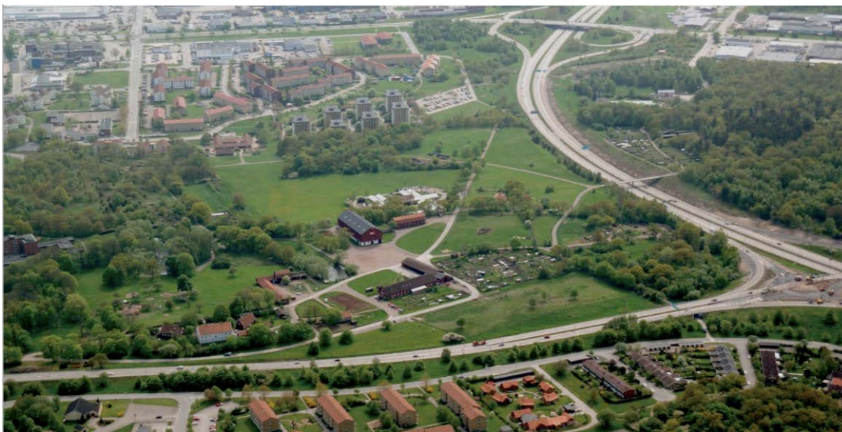
Bild 3. Till höger i bild syns E22:an, i förgrunden Ölandsleden som åt vänster leder ut på bron. Mitt i bild syns ladugården och snett ner till vänster från den, vid Ölandsleden, den vita huvudbyggnaden med sina två röda flyglar. Bostadsområdet högst upp i bild heter Oxhagen och längst ner syns delar av Djurängen.