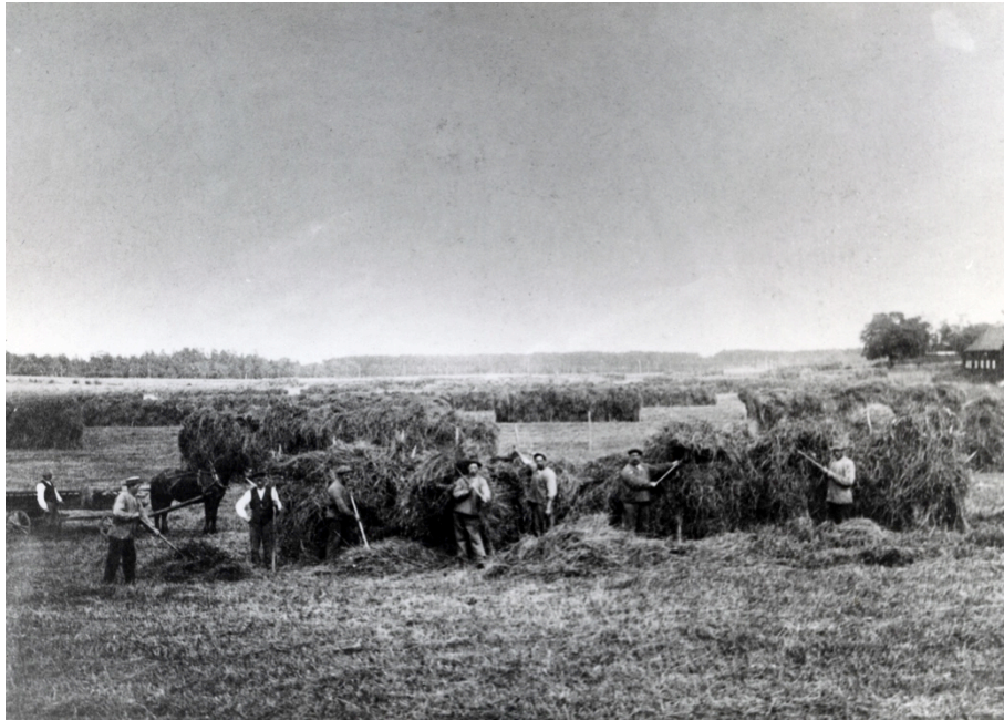
Bild 4. Höskörd på stallgärdet. Foto från Kalmar läns museum 1890.