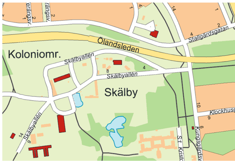
Bild 5. Skälbys huvudbyggnad med snedställda flyglar strax ovanför bildens mitt. Uppe i högra hörnet syns Stallgärdsgatan. Tätortskartan © Lantmäteriet via SLU.