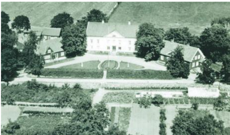
Bild 1. Skälbys huvudbyggnad och två flyglar. Bakom huset finns åkern Stallgärdet. I förgrunden syns trädgården med grönsaker och fruktträd. Foto från Kalmar läns museum 1900-talets början.