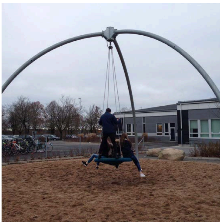
Bild 1. Kompisgungan som är mycket populär på skolan.

Skolgården används för olika sportrelaterade aktiviteter då sport beskrivs som en nödvändighet på en skolgård. Även de elever som inte spelar någon speciell sport under