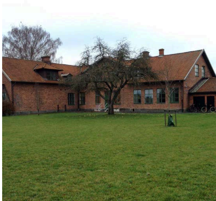
Bild 2. Äppelträdet på skolgården.

”Jag tycker absolut att vegetation är viktigt på en skolgård. Den vegetationen vi har på skolgården just nu används väldigt mycket när man är ute. I somras körde till exempel vår klass dunkgömme och då är det jättekul att klättra i träd eller gömma sig bland buskar. Och det spelar roll även om man är äldre. Det är mycket mysigare med en grön skolgård. Jag saknar dock fruktträd! Vi har i och för sig ett äppelträd (Bild 2) men det är nästan ruttet så det är inte så gott. Roligare grejer liksom, fler bärbuskar.” (Intervju 4).