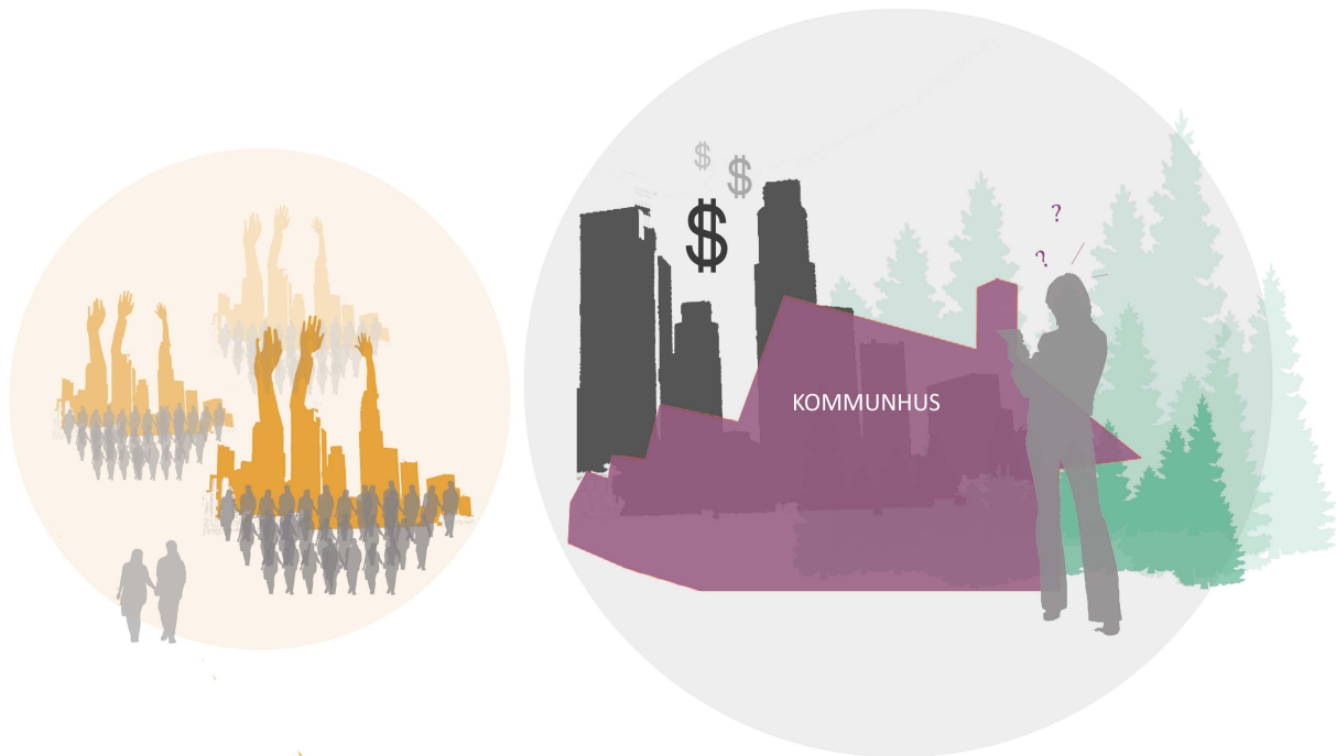
Figur 1: Inom den kommunala planeringsprocessen anses ekologiska och ekonomiska faktorer prioriteras. Att behandla sociala frågor (t.ex. segregationsfrågan) och utföra sociala konsekvensbedömningar är något som efterfrågas i dagens översiktsplanering.