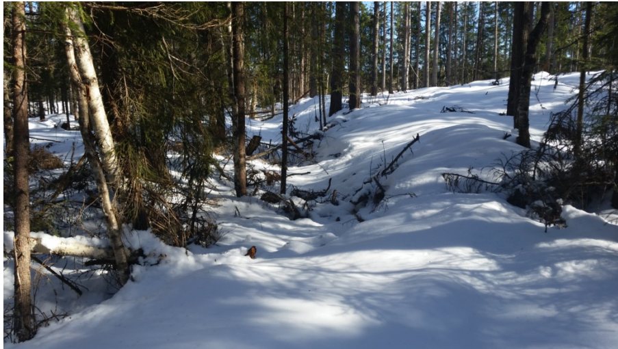
Figur 4. Vattendrag i Bergs kommun inom 80 meter enligt arcGIS