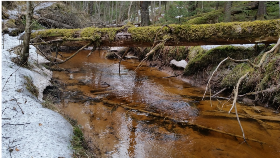
Figur 5. Vattendrag i Gagnefs kommun inom 70 meter enligt arcGIS