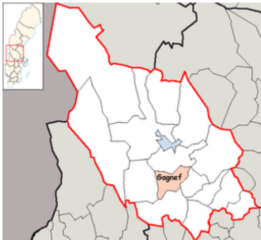
Figur 2. Karta över Dalarna med Gagnefs kommun utpekad (Wikimedia Commons, 2015)

Gagnefs kommun är belägen i centrala Dalarna. Till ytan är kommunen 769 km 2 stor och har en befolkning på 10 024 invånare (Ekonomifakta, 2014).