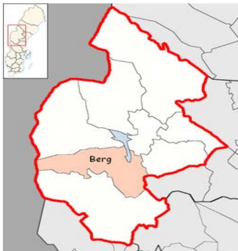
Figur 3. Karta över Jämtland med Bergs kommun utpekad (Wikimedia Commons, 2015)

Bergs kommun ligger i Jämtland och är Sveriges tredje största län till ytan (Ekonomifakta, 2014). Kommunen ligger i södra Jämtland och har en befolkning på 7 100 personer, samt en areal på 5752 km 2 (Bergs kommun, u.d.).