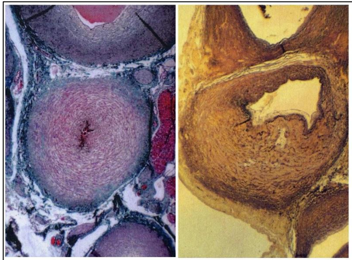
Figur 1- Histologisk struktur, t.h. normal konstriktion efter 3 dagar; t.v. PDA av grad IV.

Histopatologiska undersökningar av hundar med hereditär PDA visar tydligt att strukturen i kärlväggen skiljer sig från normalfallet. Det som sågs i studierna var en hypoplastisk och asymmetrisk muskelmassa i lamina media ( figur 1 ). Segment av DA som skulle bestått av muskler utgjordes istället av ickekontraherande aortalik elastisk vävnad (Buchanan & Patterson, 2003) innehållande kollagen och elastiska fibrer (Gittenberger-de Groot et al. , 1985). Dessutom var DA kortare än normalt hos hundar med