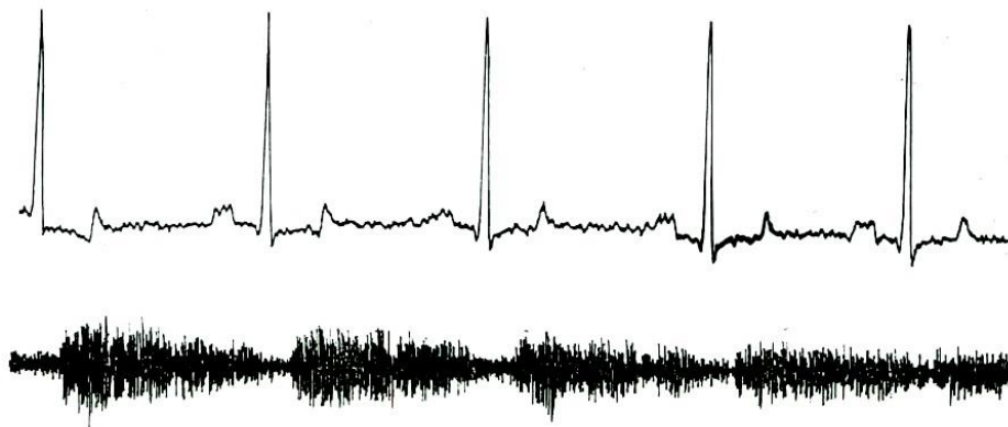
Figur 2- EKG avledning II och FKG från en hund med PDA grad II. EKG visar breddad P-våg och ökad R-amplitud. FKG visar ett kontinuerligt blåsljud med avtagande intensitet i diastole.