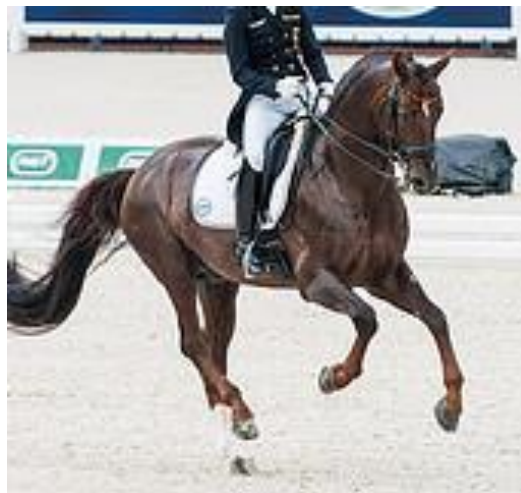
Figur 4; Lätthet i framdelen, aktiva bakben, bärighet genom rygg och nacke samt accepterande av bettet, tygelkontakt utan spänning samt spetsade öron indikerar en ”happy athlete” och bör vara målet med all dressyrträning enligt FEI.

Jag drar slutsatsen att variation genom träningspasset med avseende på arbetsform, intensitet och steglängd är viktigt för att säkerhetsställa fysisk välfärd hos hästen. Variation stimulerar ryggrörelse (Rhodin et al. , 2005; Waldern et al. , 2009), minskar risken för överansträngning (Walker et al. , 2012) och underlättar för hästen att upprätthålla adekvat syresättning (Cheak et al. , 2010; Sleutjens et al. , 2010). Vidare anser jag att variation ger bibehållen uppmärksamhet och entusiasm hos hästen, vilket man alltid bör eftersträva i sin utbildning och träning av dressyrhästen (FEI – generall dressage rules 2015).