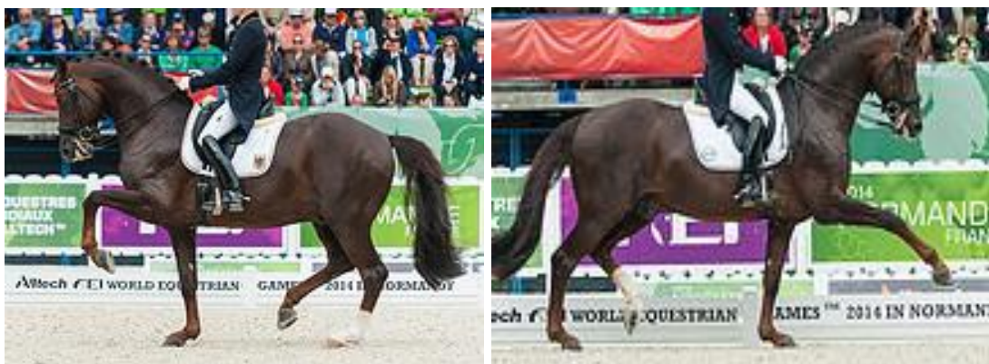
Figur 3; bild 1: samlad trav, bild 2: ökad trav. I samlad trav ses kortare steglängd samt mer vinkel i höften. I ökad trav ses lägre steglängd.