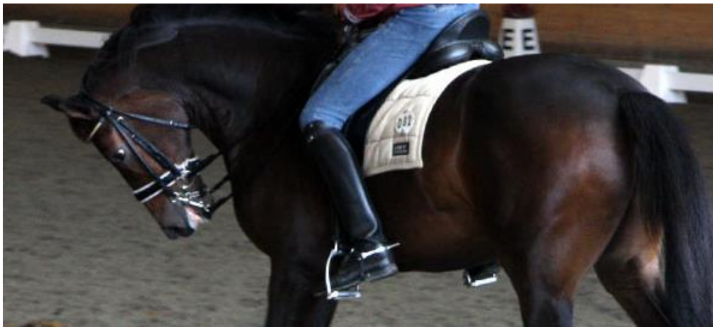
Figur 1; Hästen ridas i "low, deep, round", en arbetsform som debatteras i dressyrkretsar.

I FEI (Federation Equestre internationale) Code of conduct for the welfare of the horse står följande: "Hästar skall endast tränas efter sin fysiska förmåga och utbildningsnivå. De skall ej utsättas för våld eller träning som medför rädsla" (FEI, 2015). När det gäller träningsmetoder inom dressyr har det länge pågått debatt i hästkretsar. En metod som tillämpas är rollkür där hästens nacke är hyperflexerad i olika grad och ibland med tvång. Denna form kallas också "low, deep, round" och kommer vidare i uppsatsen även kallas HNP4 (head and neck position 4). De som tillämpar rollkür argumenterar att det ger en större flexion genom ryggen på hästarna, något som eftersträvas för ökad lösgjordhet och flexibilitet. Ibland hörs även argument att rollkür skulle vara lugnande för hästarna. Kritikerna menar istället att det är mycket stressande både fysiskt och psykiskt för hästarna att ridas i rollkür.