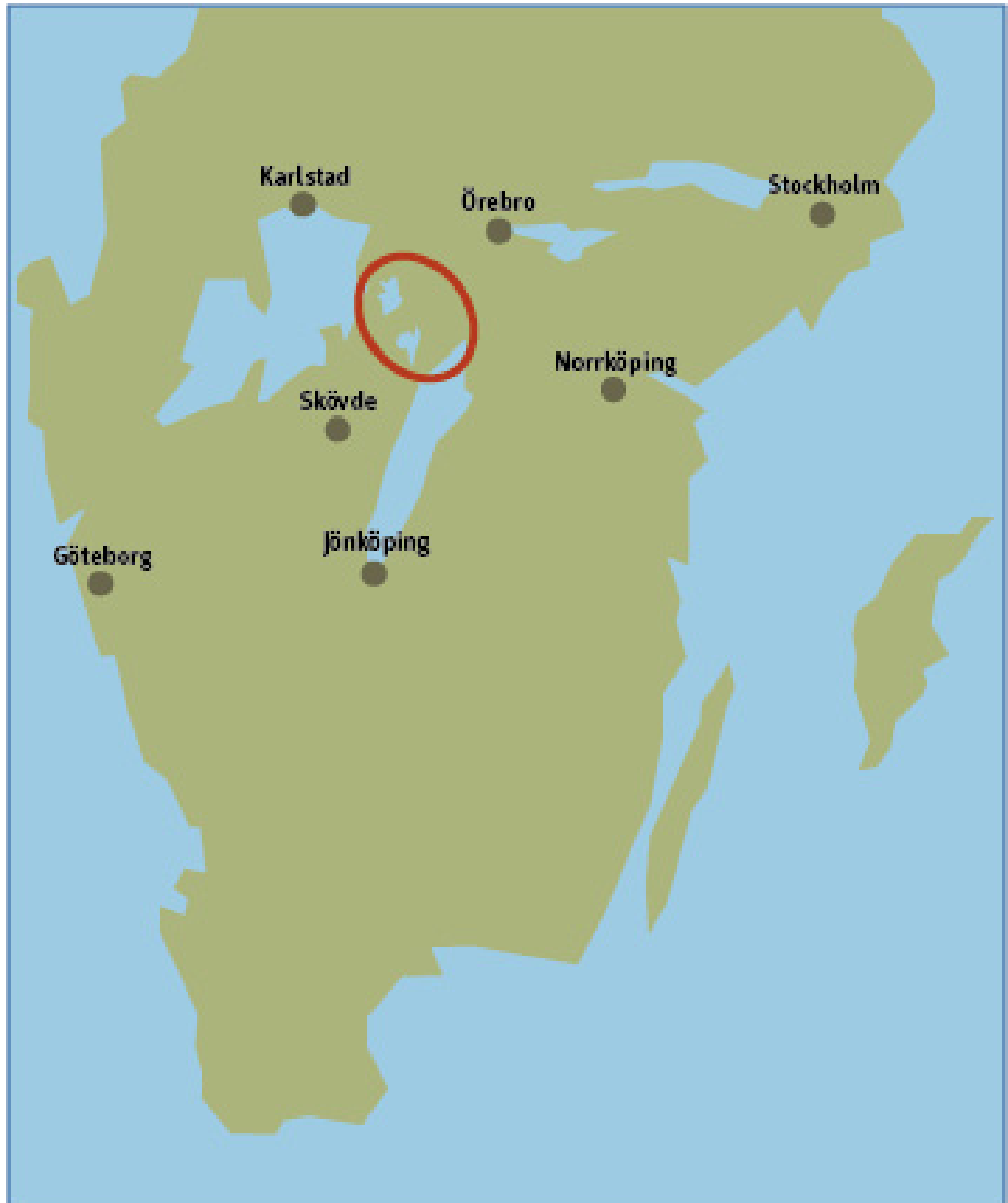
Figur 1. Karta över Tivedsbygdens belägenhet i Sverige, inringat i rött.