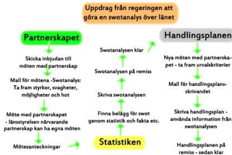
Figur 1. Översikt för empirin.