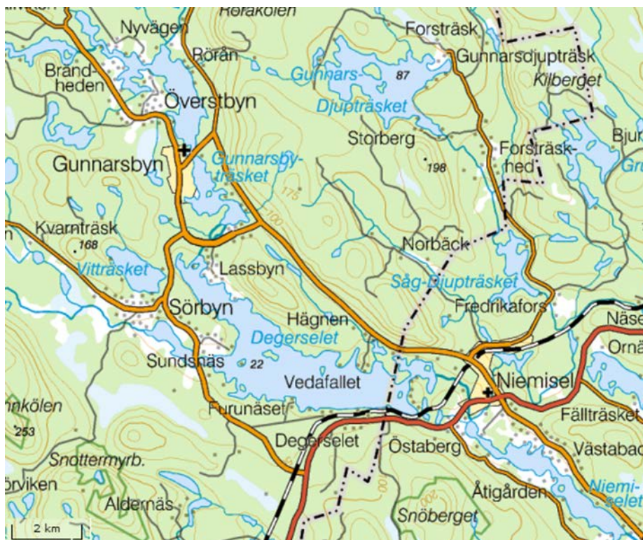
Bild 2: Karta över delar av Gunnarsbyns församling och Niemisel-området.

Råne älv, Sveriges största outbyggda skogsälv, forsar genom byarna. Historiskt sett är området en skogs- och jordbruksmark och Råne älv har haft en betydande roll som transportled av virke, som transportväg för människor boende längst älven och är även ett naturligt gränsöverskridande flöde av relationer i byarna. Gunnarsbyns församling har ett starkt föreningsliv och en levande relation med kommunen, två intressanta förutsättningar för en levande lokal utveckling som jag vill titta närmare på.