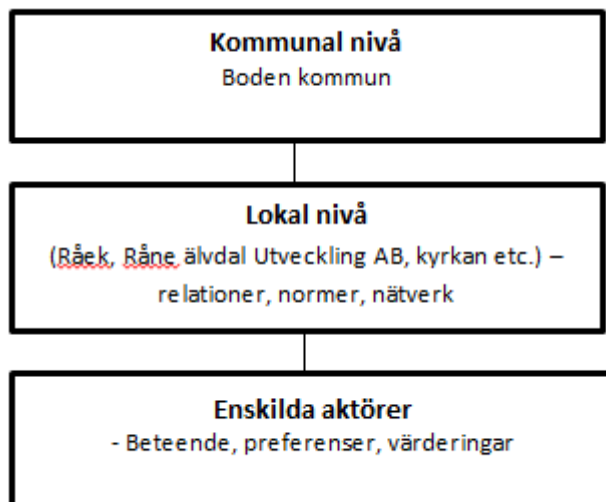
Figur 2: Tre samhällsnivåer som undersöks i uppsatsen.

Utifrån tre olika nivåer i samhällsstrukturen (Figur 2) skall jag undersöka hur de olika nivåerna samverkar för att skapa förtroende och grunder till det sociala kapitalet. Forsberg et al. har i en avhandling en liknande figur som jag har anpassat till min uppsats (Forsberg et al. 2002:6). Nätverken som skapas mellan de olika nivåerna har en betydande roll för både bygden och kommunen. Jag kommer analysera de sociala nätverken mellan de olika nivåerna i samhällsstrukturen (Figur 2) utifrån teorin om horisontella- och vertikala nätverk . De horisontella nätverken består av relationer mellan individer med liknande status och makt. Horisontella band av samhällsengagemang på lokal nivå är viktigt för att undvika möjliga sociala fällor. De vertikala nätverken knyter samman ojämlika personer i hierarki- och beroenderelation. Ett vertikalt nätverk har svårt att upprätthålla socialt förtroende och samarbete eftersom de underlydande kan hushålla med information som skydd mot utnyttjande. (Putnam 2011:194f).