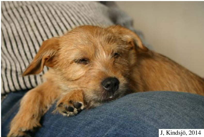
J, Kindsjö, 2014

Studentarbete Sveriges lantbruksuniversitet Institutionen för husdjurens miljö och hälsa