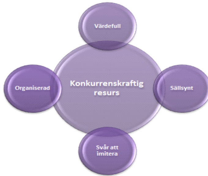
Figur 2. VRIO, (egen bearbetning av Barney, 1991).

VRIO är ett analysverktyg som används för att utvärdera hur konkurrenskraftig en resurs kan komma att bli över tiden (Barney, 1991). För att en resurs ska anses vara uthållig behöver den uppfylla fyra aspekter (se figur 2). Resursen ska vara "värdefull" (Value), vilket innebär att den har ett stort värde för aktiviteten. Andra aspekten innebär att resursen ska vara "sällsynt" (Rare). Den ska därmed vara svår för andra företag att utnyttja och få tag på. Resursen ska också enligt tredje aspekten "vara svår att imitera" (Imperfectly imitable), alltså efterlika eller härma. Den fjärde och sista aspekten "organiserad" (Organized) innebär att entreprenören ska ha kunskap och förmåga om att kunna utnyttja resursen på ett effektivt sätt. Barney (1991) menar att alla dessa aspekter måste uppfyllas för att resursen ska anses uthållig och konkurrenskraftig.