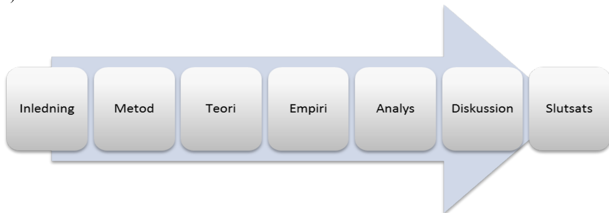
Figur 1. Struktur i uppsatsen

För att ge en tydlig bild av hur uppsatsen är uppbyggd illustreras detta i figuren nedan (figur 1).