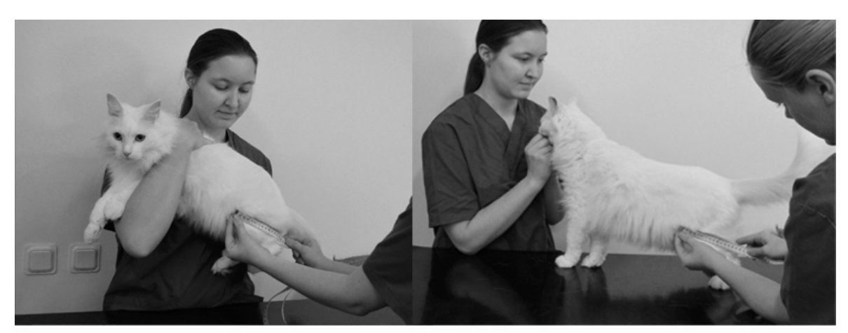
Figur 4 - Två mätmetoder av bakbenets längd från mitten på patella till tuber calcanei enligt WALTHAMs Feline Body Mass Index.

Bakbenets längd mättes från mitten på patella till tuber calcanei. Beroende på vad katten uppfattades tycka var bekvämast togs detta mått på fritt stående eller upplyft katt (Fig. 4). Således frångicks de skriftliga instruktionerna som tagits fram. Likt en av Hawthorne och Butterwich illustrationer för WALTHAMs FBMI-mätningar från 2000 bedömdes katterna från höger sida i alla fall utom ett där en katt uppfattades bekvämast med att bakbenet mättes av djurägaren från vänster sida. Måtten togs i hela centimeter med ett vanligt mjukt måttband. Dessa mått var ej hemliga för djurägarna eftersom de fritt kunde läsa av måttbandet samt att djursjukskötarstudenten öppet avslöjade mätresultatet, så att samtliga djurägare skulle ha lika förutsättningar.