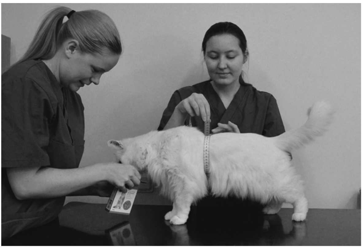
Figur 3 - Mätmetod av bröstkorgens omkrets vid det nionde revbenet enligt WALTHAMs Feline Body Mass Index.

Bakbenets längd mättes från mitten på patella till tuber calcanei. Beroende på vad katten uppfattades tycka var bekvämast togs detta mått på fritt stående eller upplyft katt (Fig. 4). Således frångicks de skriftliga instruktionerna som tagits fram. Likt en av Hawthorne och Butterwich illustrationer för WALTHAMs FBMI-mätningar från 2000 bedömdes katterna från höger sida i alla fall utom ett där en katt uppfattades bekvämast med att bakbenet mättes av djurägaren från vänster sida. Måtten togs i hela centimeter med ett vanligt mjukt måttband. Dessa mått var ej hemliga för djurägarna eftersom de fritt kunde läsa av måttbandet samt att djursjukskötarstudenten öppet avslöjade mätresultatet, så att samtliga djurägare skulle ha lika förutsättningar.