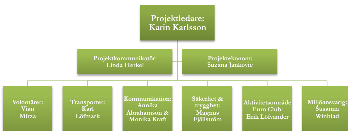
Figur 4: Organisationsschema över de nyckelpersoner som intervjuats i studien.

Efter att samtliga nio intervjuer med de utvalda nyckelpersonerna (se organisationsschema nedan) hade transkriberats påbörjades arbetet med att ta ut väsentliga delar för att sammanställa det empiriska materialet, vilket presenteras i detta kapitel. Sammanställningen av svaren representerar ett axplock av de intressanta aspekter som lyfts upp och omfattar därmed inte respondenternas fullständiga svar på frågorna.