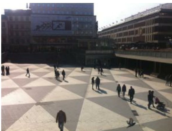
2013-04-23 (bild:a). Ungdomar stannar då och då till i mindre grupper på torget. Spontana aktiviteter som fotboll eller skateboardåkning äger ibland rum på torget.