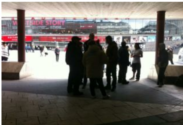
2013-04-23 (bild:d). Under tak stannar ungdomar upp för att vänta på någon, röka eller umgås. Takpelarnas stöd, som ses i bilden, används som sittplatser och är uppskattade i eftermiddagssolen. Det här området används också när ungdomar vill skydda sig mot väder och vind.

Området under tak är mest använt under eftermiddag och kväll. Utanför tunnelbaneingången stod det ungdomar och väntar på varandra och röker. Här samlas ungdomar i mindre grupper. Stödet för taket används även som sittplatser.