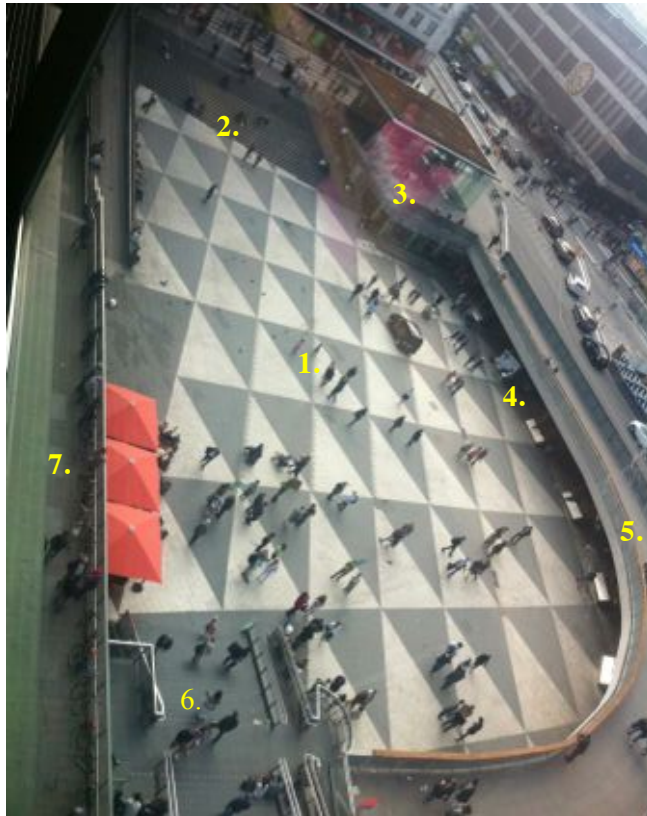
2013-05-12. Foto över Sergels torg taget från kulturhusets översta våning. Torget delades in i olika ytor.

Observationsschema: platser som observerades.