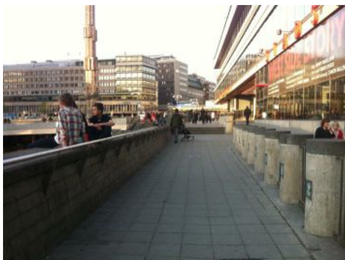
Framför kulturhuset sitter och står ungdomar och tittar ut över plattan. Pollarna är ett bra stöd för en stunds vila. Avståndet ner till plattan är tre meter från muren som används som sittplats.

Framför kulturhuset finns ett antal pollare som används till exempel för att sitta på, luta sig mot eller ställa cykeln vid. Muren mot torget används till allt från att gå balansgång på till att sitta och titta ut över plattan eller bara stå och luta sig emot. Mellan 12- och 15-tiden är platsen skuggad och används mest som passage. Framemot 18-tiden kommer solen till ytan och den blir mer använd. Pollarna och muren används som sittplatser, utsiktspunkter och som platser att stanna till vid. Den här platsen är lite avskild från resten av Sergels torg men med bra överblick. Vid 20-tiden är muren en uppskattad sittplats och pollarna blev redskap i parkourträning. Vid 00-tiden är platsen tom.