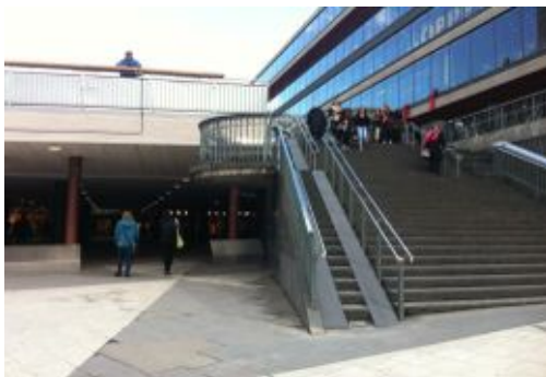
Den östra trappan används under eftermiddagen då trappan ligger i sol men trots det är det ett av de minst använda områdena på torget

Den östra trappan är inte en välanvänd plats av ungdomar, trots eftermiddagssol. Den är smalare och inte lika praktisk att sitta i, som den västra trappan, då det behöver finnas plats för förbipasserande. Dock används den som sittplats av andra åldersgrupper.