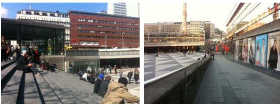
2013-04-29 (bild:b). I västra trappan umgås ungdomar i större och mindre grupper. På förmiddagen när solen lyser är den västra trappan Sergels torg mest använda plats.

Vid 12- tiden badar trappan i sol och den börjar då fyllas med ungdomar. På vänstra sidan av trappan sitter en något större grupp av ungdomar och fler kommer till vartefter tiden går. I mindre grupper oftast två och två eller tre och tre sitter ett flertal ungdomar och solar, pratar, lyssnar på musik, röker och tittar på folk. Räckena på trappans kanter används ofta för att luta sig emot, vare sig man sitter eller står. Vid den här tiden används trappan av ett stort antal människor i varierande åldrar men ungdomar är klart överrepresenterade på platsen. Vid 15-tiden ligger större delen av trappan i skugga och endast en grupp av tre ungdomar använder den som sittplats. Efter det, både vid 18- och 20-tiden används trappan av färre ungdomar och vid 00 är det helt tomt.