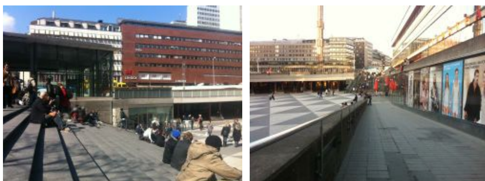
I västra trappan umgås ungdomar i större och mindre grupper. På förmiddagen när solen lyser är den västra trappan Sergels torg mest använda plats.

Vid 12- tiden badar trappan i sol och den börjar då fyllas med ungdomar. På vänstra sidan av trappan sitter en något större grupp av ungdomar och fler kommer till vartefter tiden går. I mindre grupper oftast två och två eller tre och tre sitter ett flertal ungdomar och solar, pratar, lyssnar på musik, röker och tittar på folk. Räckena på trappans kanter används ofta för att luta sig emot, vare sig man sitter eller står. Vid den här tiden används trappan av ett stort antal människor i varierande åldrar men ungdomar är klart överrepresenterade på platsen. Vid 15-tiden ligger större delen av trappan i skugga och endast en grupp av tre ungdomar använder den som sittplats. Efter det, både vid 18- och 20-tiden används trappan av färre ungdomar och vid 00 är det helt tomt.