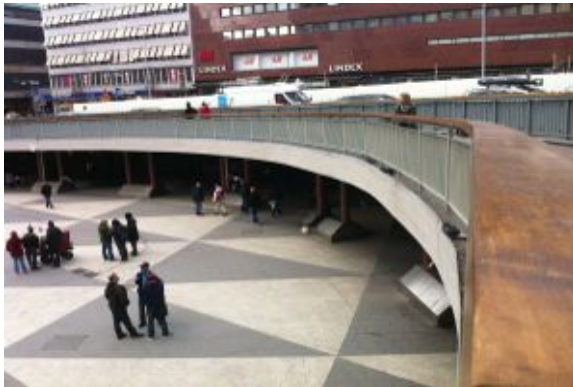
Räckena runt om plattan är en del av torget som sällan används av ungdomar.

Räckena runt plattan används inte mycket av ungdomar. Under den tiden jag observerar platsen är det endast ett fåtal som stannar upp vid räckena trots att de är solbelysta större delen av dagen och ger en bra överblick över torget.