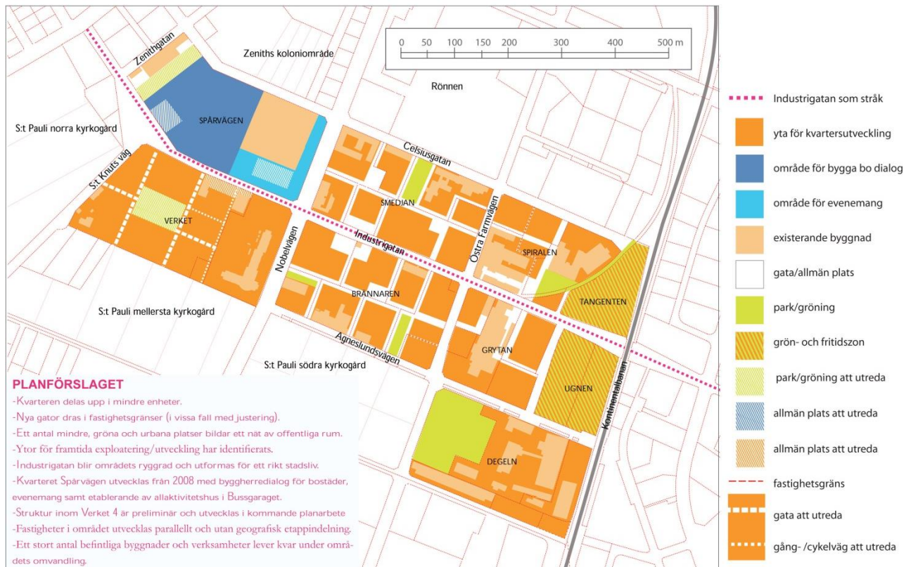
Figur 2: Plan över områdets struktur (Ur: Malmö stadsbyggnadskontor 2008b s. 25, tillstånd av ansvarig handläggare 16-05-2012).

De befintliga stora kvarteren i Norra Sorgenfri planeras man att dela upp i ett antal mindre enheter. Variation mellan de olika enheterna och kvarteren lyfts fram som en viktig förutsättning för att skapa spännande miljöer i området (Malmö stadsbyggnadskontor 2008b s. 37).