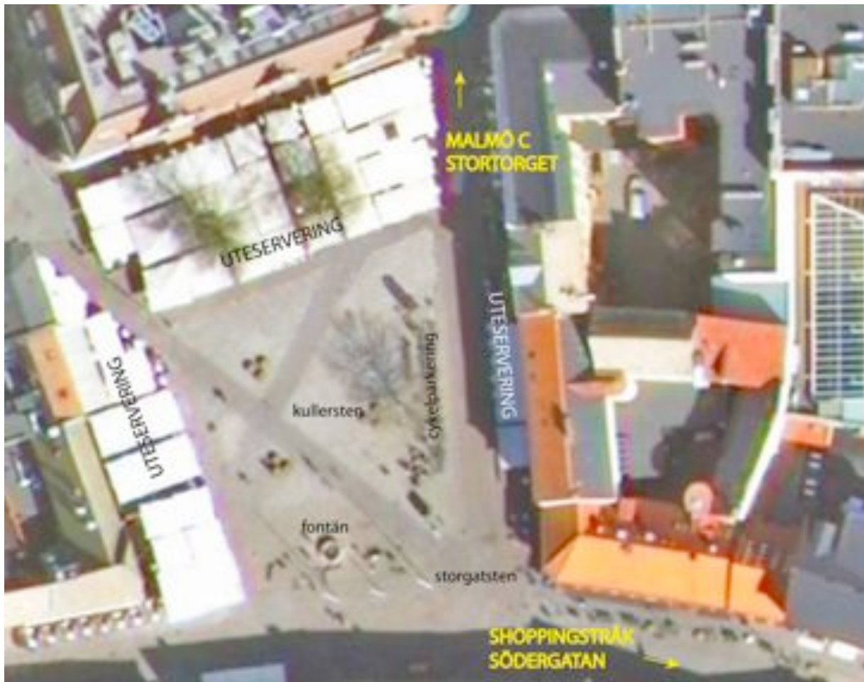
Figur 3 Plan Lilla Torg (Olsson, Störby utifrån:

Vår erfarenhet av Lilla Torg var uteslutande kopplad till det restaurang- och barutbud som finns på torget. Vi hade aldrig varit på platsen i något annat syfte än att besöka dessa. Platsens starka präglning av konsumtion trodde vi redan innan observationen skulle innebära en exkludering av mindre bemedlade människor och till viss del även barn, eftersom vi före vår undersökning upplevde vi torget som ett "vuxenrum". Dess ojämna markmaterial identifierade vi redan innan som ett hinder för människor med funktionsnedsättning men också barnvagnar, människor i höglackat och med skateboards.