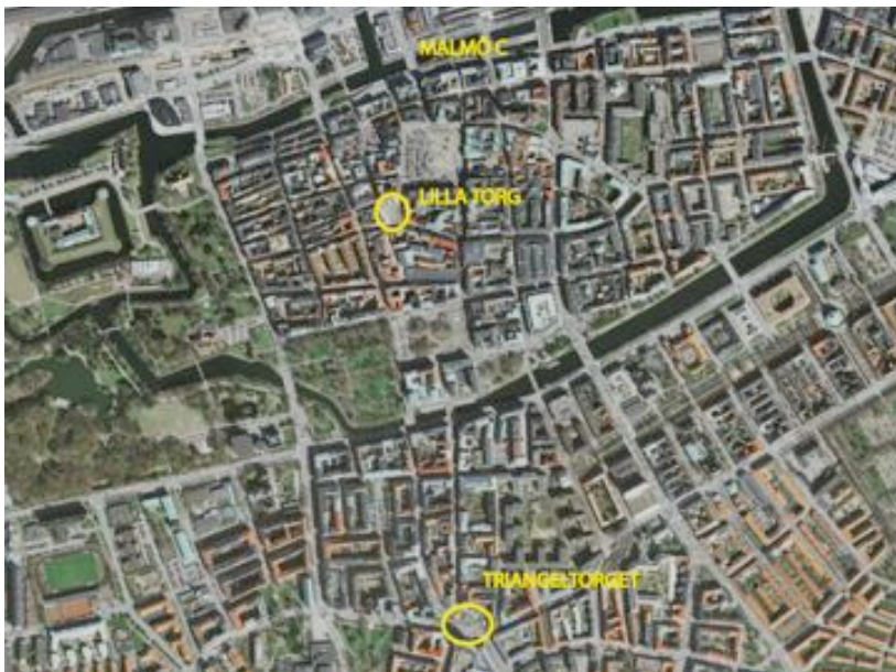
Figur 1. Torgens placering i Malmö. (Olsson, Störby utifrån: http://kartor.eniro.se/query?what=maps&search_word=&geo_area=malmö&from= )

Genom observation har vi jämfört två torg med liknande förutsättningar gällande centralt läge i staden som däremot skiljer sig åt i utformning. Vi har valt Lilla torg och Triangelorget i Malmö. Dessa torg ligger som sagt båda centralt och har en storlek som blir möjlig för oss att överblicka. Inför observationen av platserna studerades dess fysiska förutsättningar och vilka funktioner som finns i anslutning, till exempel verksamheter och stråk i området.