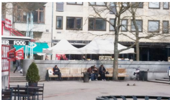
Figur 5 Hörnet mot Triangeln var välbesökt av hemlösa och missbrukare.

Flera barn besökte platsen tillsammans med sina föräldrar, några stannade för att köpa glass i kiosken medan andra hittade saker på torget som en lek uppstod kring. Någon skuttade eller cyklade mellan nivåerna i trappan och flera intresserade sig för vattenpölar och jagade några ankor eller duvor som kioskägaren försökte skrämja bort. Föräldrar lät barnen röra sig relativt fritt på torget. Samtidigt som nivåskillnaderna väckte intresse hos barnen utgjorde de ett hinder för äldre och andra personer med funktionsnedsättning. Är man exempelvis beroende av en rullator eller rullstol blir man tvungen att välja en längre väg längs det övre planet för att ta sig fram. Trappan verkade ändå inbjudande eftersom också många äldre med käpp, trots vissa svårigheter, valde den vägen. Under observationen förstod vi vilken attraktionskraft blomsterarrangemang har eftersom många stannade för att titta på och fotograferas vid blommorna. Vid utförandet av observationen hade vi som syfte att smälta in på platsen och valde att sätta oss på stenmuren vid Södra förstadsgatan för att få en bra överblick. Vid båda observationstillfällena satt ingen på muren då vi kom till torget men flera valde efter en stund att slå sig ner bredvid oss.