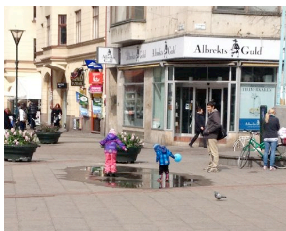
Figur 4 Barn leker med det som erbjuds.

På triangeln torget intervjuade vi två unga kvinnor med svenskt ursprung, tre flickor i tonåren uppväxta i Sverige och en medelålders man också med svenskt ursprung. Flera var nöjda med hur platsen ser ut idag men hade förslag på att bord vid bänkarna hade varit bra om man har med sig egen dricka och de påtalade att det inte kändes okej att sätta sig på kiosken uteservering om man inte handlat där. Majoriteten sa att de kände sig trygga på platsen under dagen men att det på