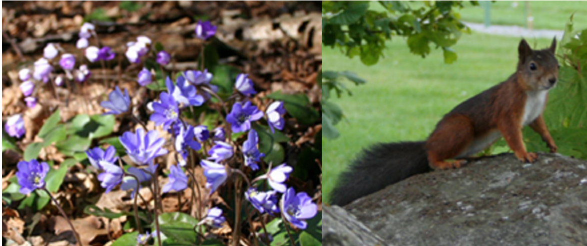
Fig 2. Blåsippor, eller kanske till och med en ekorre, det är både exempel på spontan uppmärksamhet som kan infinna sig vid vistelse i naturen eller i parker/trädgårdar.

Den riktade uppmärksamheten kräver stor mental ansträngning. Det beror på att man måste sortera bort all onödig information för att kunna koncentrera sig på det som är viktigt. Störande moment kan vara påtvingade ljud som dånande motorvägar och fläktljud. Andra fall av riktad koncentration kan vara krånglande datorer. Det är ofta först när problemet är löst eller när man kommer bort från det påtvingade ljudet som det märks hur stor ansträngningen varit. Löser sig inte problemen eller om ljudet inte försvinner leder den riktade uppmärksamheten till psykisk trötthet, eftersom all inkommande störning hela tiden måste bearbetas. (Schmidtbauer, 1999)