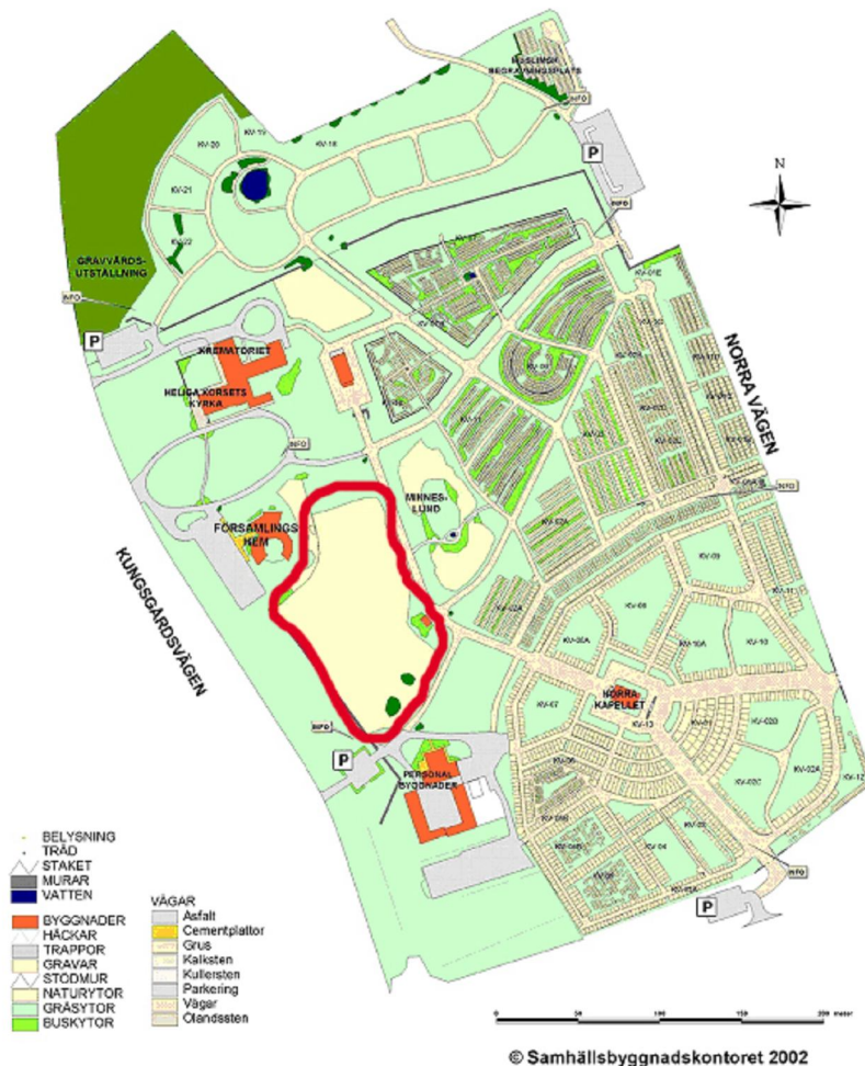
Fig 1. Karta över Norra kyrkogården, Kalmar. Den röda markeringen visar den aktuella platsen för en blivande sinnenas park.

På platsen finns ett stort antal gamla stora tallar som ger platsen en pelarsalskaraktär. Ett mindre antal lövträd finns också. På marken växer gräs och örter. Sly av björnbär och lövträd förekommer också.