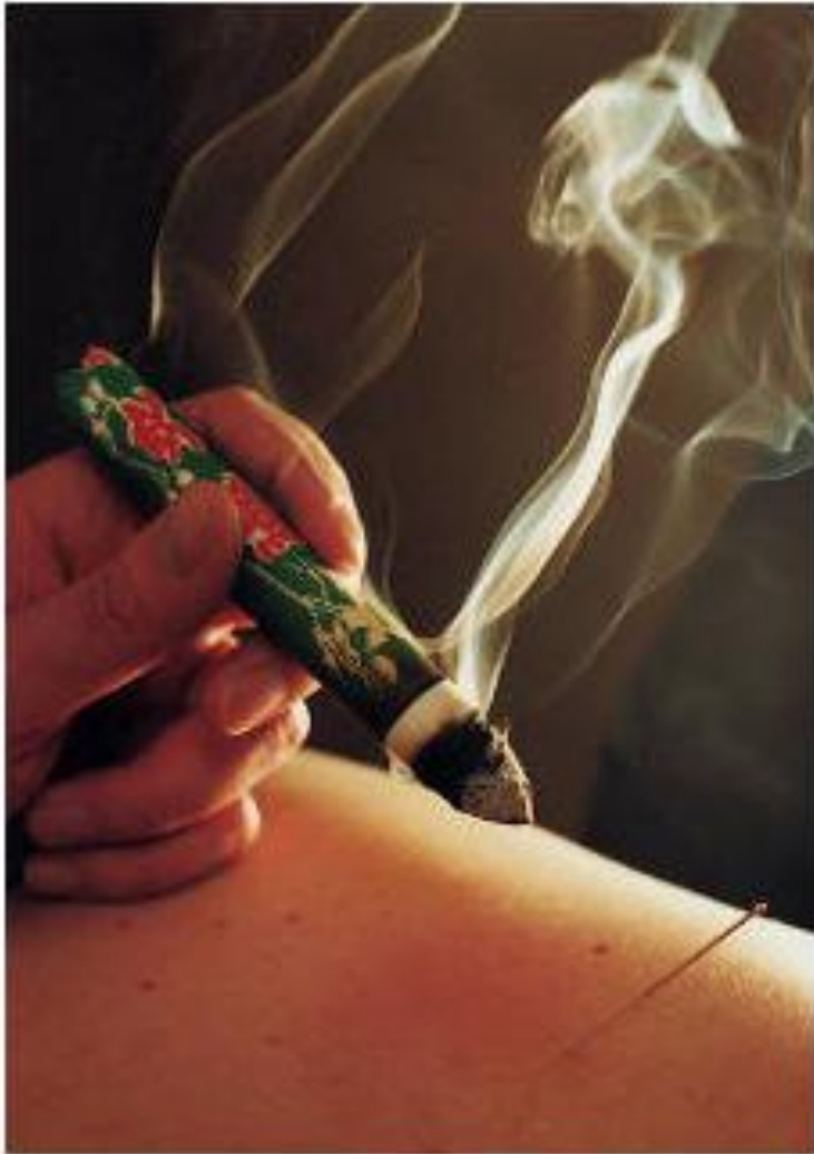
Moxabränning (Prosensa.nu., 2013)