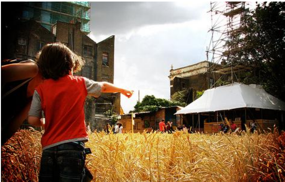
Agnes Denes, Wheatfield: A Confrontation, Manhattan, New York 1982.

från början av sopor som Denes lät forsla bort. Därefter transporterades åttio lastbilsflak med jord till platsen för att bilda ett jordlager tillräckligt djupt att plantera i. Vetet såddes sedan för hand av Denes och att antal frivilliga i maj. Skörden sköttes omsorgsfullt och i slutet av sommaren hade vetet förvandlats till ett gyllene sädesfält. Verket gav en surrealistisk känsla: en veteåker mitt i stan med frihetsgudinnan och skyskrapor som bakgrund. Agnes Denes verk som befann sig ett stenkast från Wall Street var ett starkt politiskt ställningstagande. Genom att plantera en veteåker mitt i finansdistriktet ville Denes visa på snedfördelningen av världens resurser och det absurda med den rådande världsekonomistrukturen. När vetet skulle skördas i augusti fick verket mycket medial uppmärksamhet och dess verkliga paradox belystes: Vetet man skördat på fältet var värt runt 2000 kronor men marken man odlat på var värderad till 45 miljarder kronor.