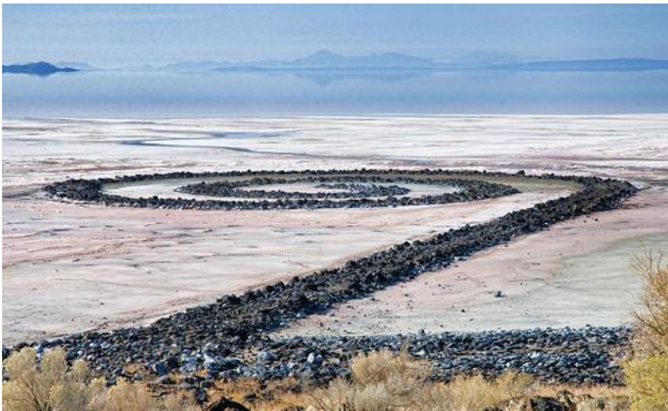
Robert Smithson, Spiral Jetty 2008 i Rozel Point vid Great Salt lake, Utah (Ur Tufnell 2006).

Amerikanen Robert Smithson ses som en av förgrundsgestalterna inom Land Art och för många är Spiral Jetty det verk som starkast exemplifierar genren. Smithsons konst var teoretisk och refererande. Han använde sig av många olika material och tekniker. Bland annat intresserade han sig för på vilket sätt människan lämnar spår i naturen. Han undersökte ofta gränsen mellan stad och landskap till exempel i förorter som Passaic och New Jersey där han var uppvuxen. Han tog avstånd från modernismen och var en postmodernistisk