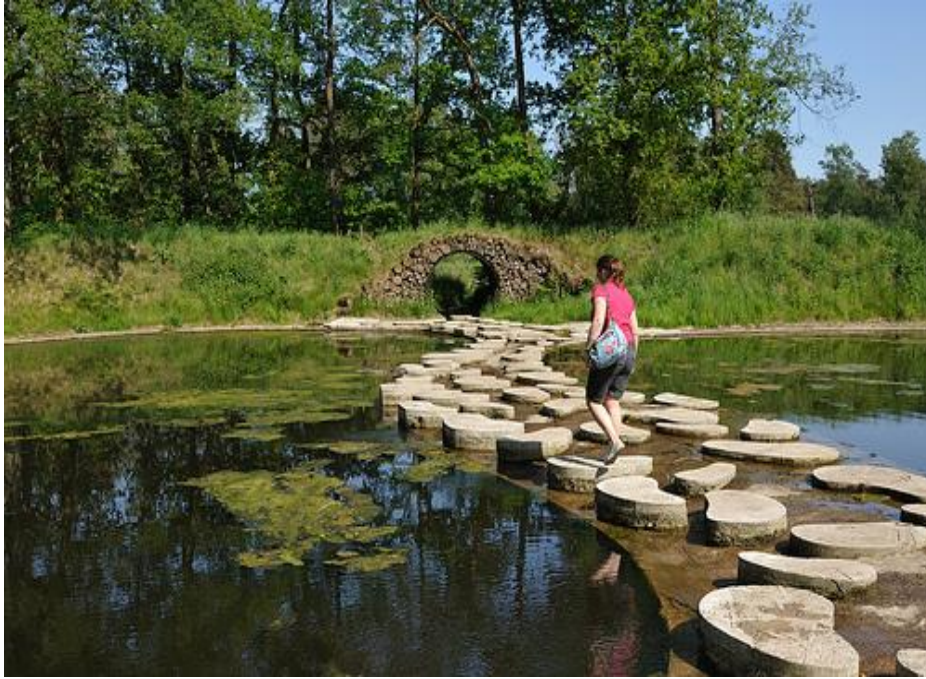
Vattenreningspark, Strootman Landschapsarchitecten 2005, Het Lankhet, Holland.