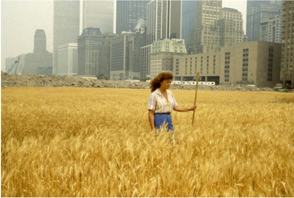
Agnes Denes, Wheatfield: A Confrontation, Manhattan, New York 1982 (Ur Tufnell 2006).