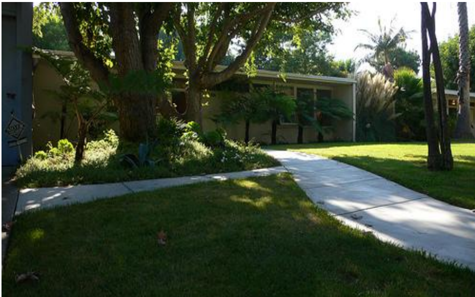
Garret Eckbo, radhusområde 1941, Taft, Californien ( www.flickr.com 2009).

1946-49 medverkade Eckbo i ett projekt i västra Los Angeles. Projektet bestod i att planera ett flerfamiljsområde för femhundra invånare i de lägre delarna av Santa Monicabergen och att göra en vegetationsplan. Området bestod av tre dalgångar sammanbundna av lägre bergsryggar. Husen planerades uppe på höjderna samt längs sluttningarna. Den befintliga vegetationen bestod av succulenter och vintergröna buskar samt enstaka ekar och svart valnöt. I sin mönsterlika trädplan strävade Eckbo efter att förtydliga den varierade topografin samt att balansera höjdskillnaderna för att få ett visuellt lugnare område. En utjämnande effekt uppnådde han genom att på de högre partierna plantera lägre, bredare träd och på de lägre nivåerna höga, smala träd. Träden på de mellanliggande sluttningarna planterades i sammanbindande formationer. Eucalyptus, avocado och olivträd utgjorde stommen i planen. Eckbo fick kritik för förslaget som ansågs vara för onaturligt och bilda för mycket mönster. Tidens rådande stilideal var att det skulle se så orört och naturligt ut som möjligt (Eckbo 1950).