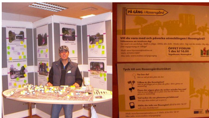
Figur 4. Projektet Stadens Ljus: Rosengård .