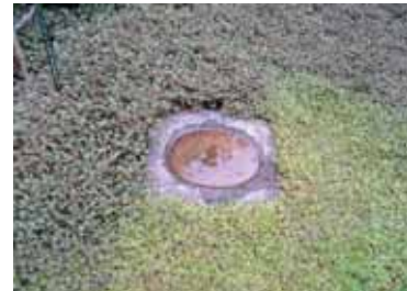
Fågelbad i sten nedsjunket bland marktäckarna hos Östbergs