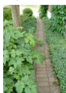
Gången i marktegel