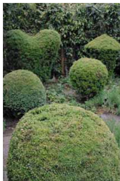
Formklippta buskar