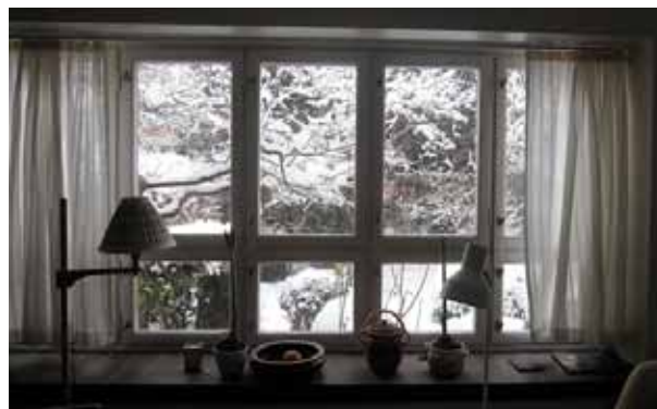
Utsikt över trädgården från vardagsrummet