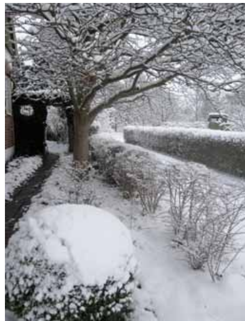
Ingång längs med husets gavel