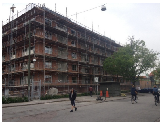
Figur 7. Peabs nybygge i Kv. Bageriet.