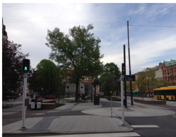
Figur 5. Nya torgytan vid Smedjegatan/Bergsgatan.