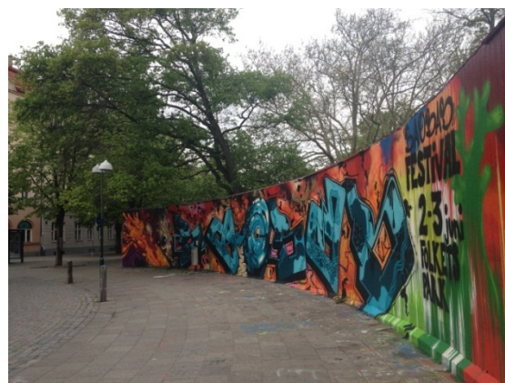
Figur 1. Graffiti vägg vid Folkets Park i Möllevången.

Lilja (2011) menar att utarmningen av det offentliga rummet i många förorter har gett innerstaden större betydelse för alla oavsett om de bor där eller utanför. Detta skulle då göra att det enda området som alla i staden har gemensamt är just innerstaden (Lilja 2011, sid 24).