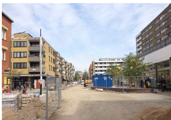
Figur 9. Claesgatan under ombyggnad.