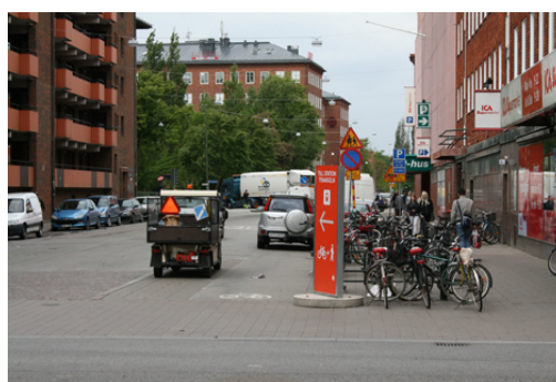
Figur 3. Del av Smedjegatan innan ombyggnad.

Från sommaren 2011 till våren 2012 gjordes, på beställning av Gatukontoret i Malmö, en upprustning av Smedjegatan. Sträckan från Möllevångstorget bort till Citytunnelns station, Triangeln Södra, renoverades enligt Malmö stad för att skapa en bättre cykel- och gångförbindelse då flertalet resenärer tar sig till och från stationen på detta sätt (Malmö stad, 2012c). Den breda trottoaren längs gatan är kvar och bredvid denna har en cykelbana, med färdriktning åt båda håll, etablerats. Efter korsningen Bergsgatan/Smedjegatan, ansluter den nya förbindelsen till en gammal cykelbana längs med Möllevångstorget på Ystadsgatan. Vid korsningen Bergsgatan/Smedjegatan har det skapats ett litet torg med sittmurar i tegel och perennplanteringar. Mitt på torget har en gammal lind bevarats som ett vårdträd. Vegetation finns längsmed den nya cykelförbindelsen i form av en trädrad och perennplanteringar. Mellan dessa träd finns flertalet cykelparkeringar, vilka ökar i antal ju närmare stationen, Triangeln södra, man kommer. Smedjegatan som tidigare var en grå och trist gata har nu fått en ny, finare och framför allt grönare karaktär. I och med det lilla torget vid Bergsgatan har Möllevångsområdet fått ännu ett litet offentligt rum där folk kan mötas - kanske på cykeln, i väntan på bussen, eller bara umgås.