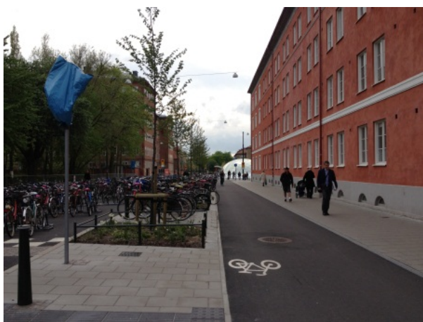
Figur 4. Nya cykelvägen. I bakgrunden skymtar stationen Triangeln Södra.