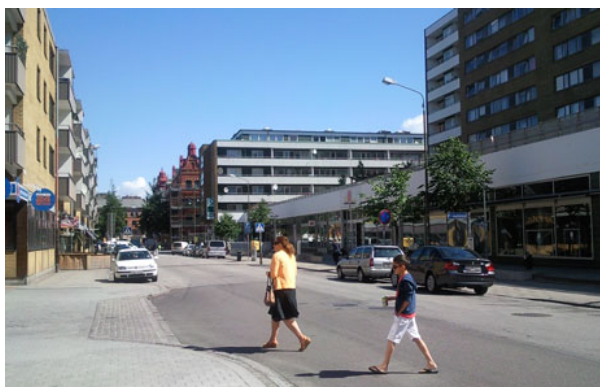
Figur 8. Claesgatan innan ombyggnad.