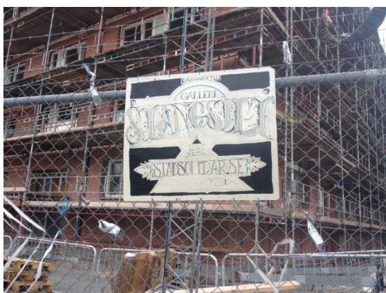
Figur 6. På skylten står det "Välkommen till galleri Stängslet". Trots att kojorna är borta visar Stad Solidar fortfarande sitt missnöje, här på stängslet till Peabs byggarbetsplats.

De två medborgarrörelsernas deltagande och initiativ till diskussioner om gentrifiering i Möllevångsområdet samt engagemang inom stadsplaneringsfrågor blir bland annat synligt då de frekvent förekommer i samrådsredogörelsen för Malmö stads översiktsplan 2012 (Malmö SBK, 2012). Peab har snart färdigställt 72 av de planerade 147 lägenheterna i Kv. Bageriet. Byggföretaget beskriver att kvarteret "byggs för dig som vill bo i en spännande stadsdel i hjärtat av Malmö." (Peab, 2012). Den täta stadsdelen har inte haft många nybyggnadsprojekt under de senaste decennierna (Tanimura, 2012).