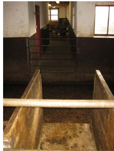
Bild 1. Gång från kalvamma till liggbås för 2-3 månader.