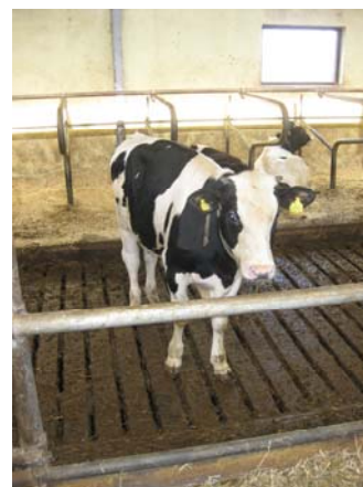
Bild 2. Liggbås för äldre kalvar.