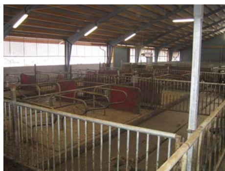
Bild 2. Liggbås för äldre tjurar.