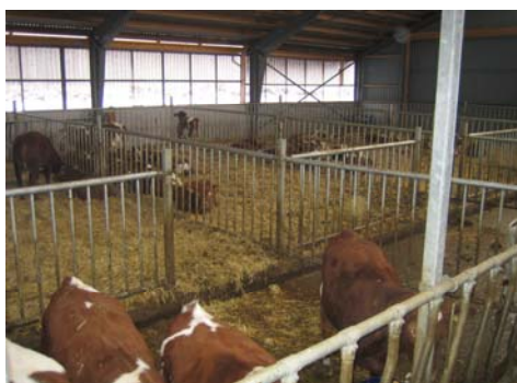
Bild 1. Djupströboxar till kalvar mellan 2-4 mån.