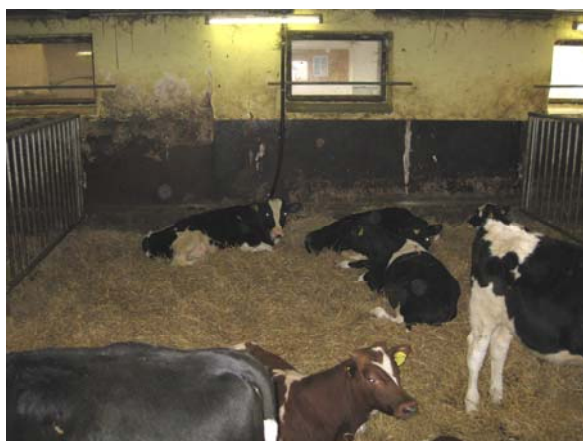
Bild 1. Djupströ till kalvar upptill 3 månader.