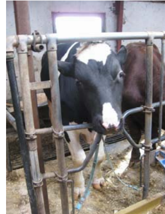
Bild 3. Uppbundna tjurar innan slakt.