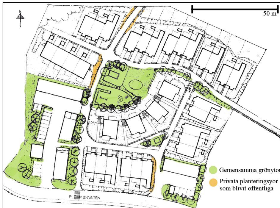
Bild 3. Författarens uppfattning av bostadsområdet. (Kartmaterial från bostadsrättsföreningen, bearbetat av författaren).

Området är byggt på en tidigare skogsbevuxen moränkulle och markförhållandena är näringsfattiga. Jorddjupet är tunt och vilar på fyllnadsmaterial från när området anlades. I buskplanteringarna är det uppskattningsvis 30 cm växtjord men generellt är alla planteringsytor kompakta med mycket sten. Hela området kan ses som väl-dränerat och det finns inte några problem med stående vatten. 2