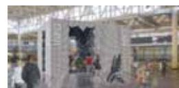
Bild 5. Gruvan.