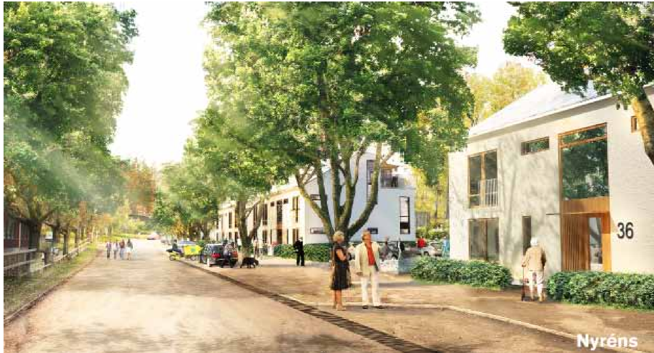
Livet från den ljusa sidan B. Bilden förmedlar tydligt hur det kan se ut när man passerar området i bil eller till fots.