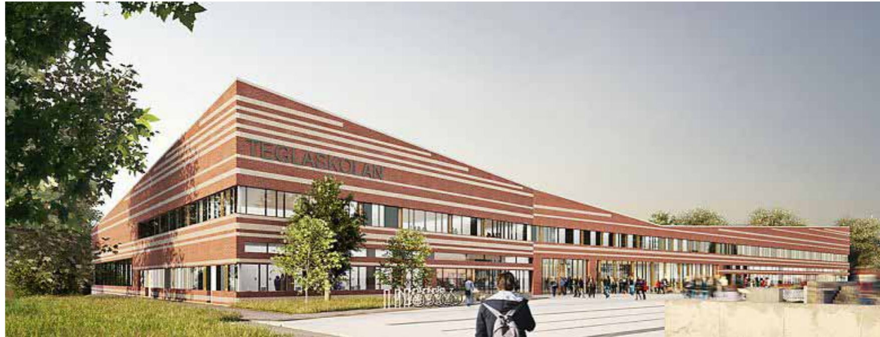
Skara-Viktoria. Bilden är fotorealistic och verklighetstrogen, den är varken informationsrik eller avskalad. Bild: Med vänligt tillstånd av Wingårdh Arkitektkontor och Ramböll AB.