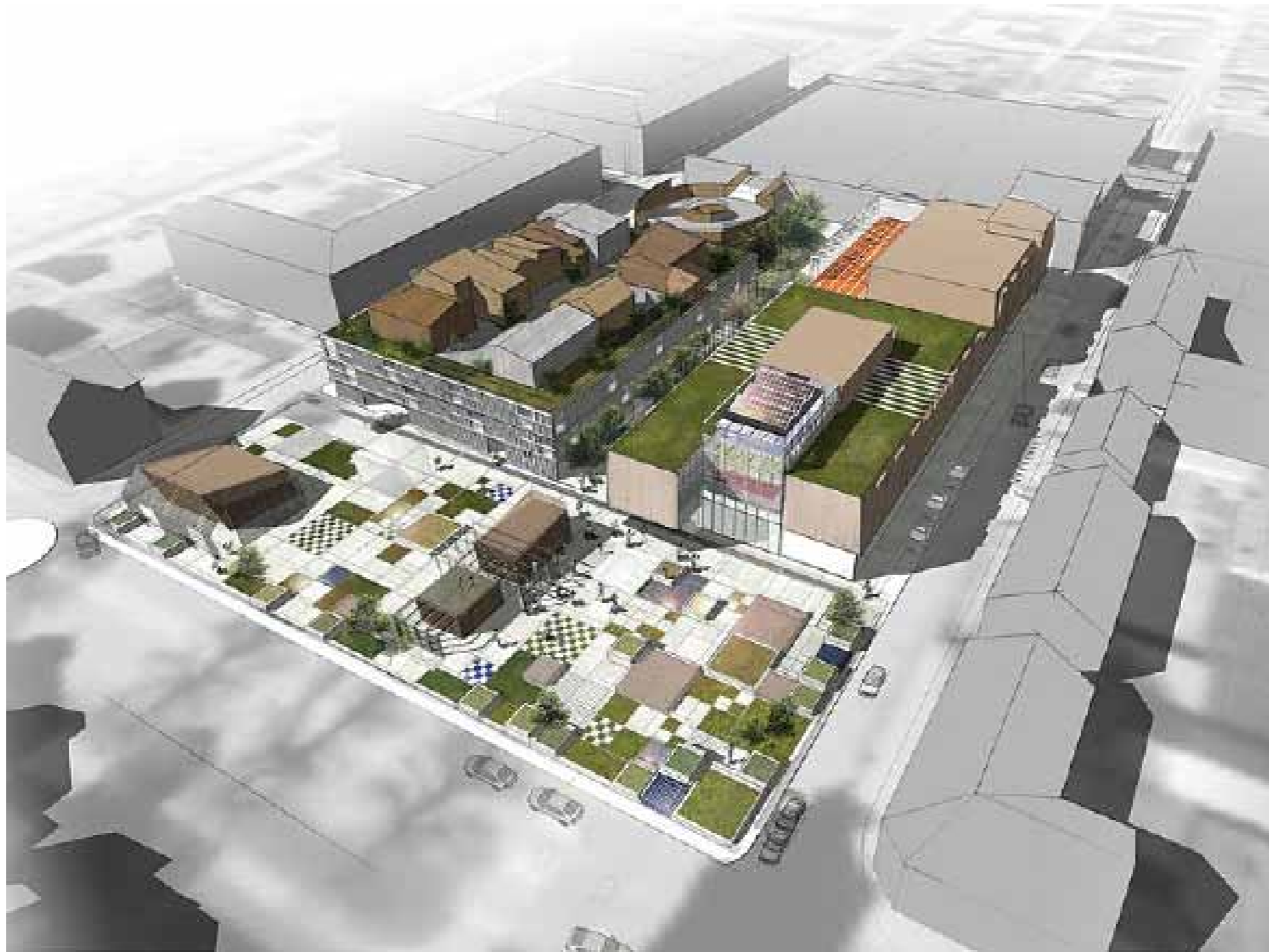
Drive In Bike Out. Högt fågelperspektiv som innehåller mycket information och har ett ekologiskt uttryck.