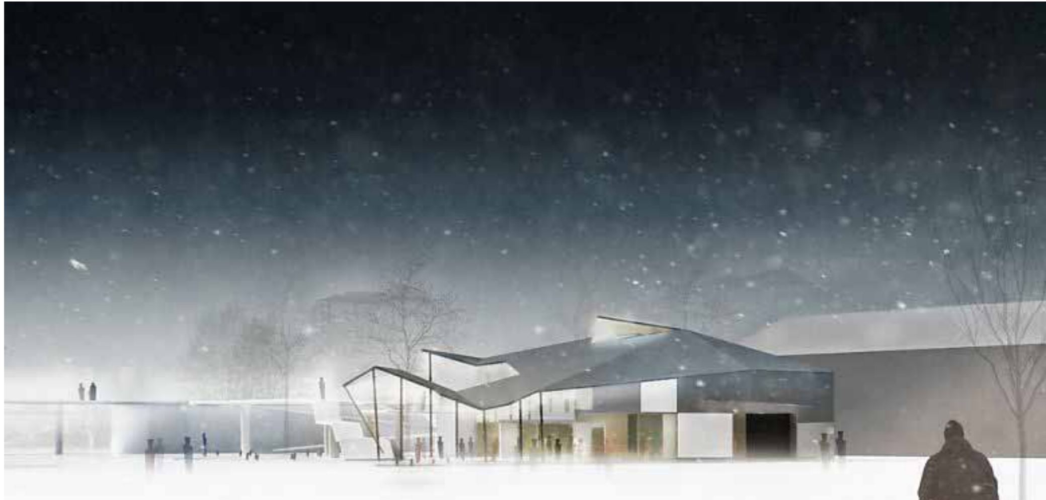
Kantaral. Bilden är vinterlik och visar det nordiska klimatet.