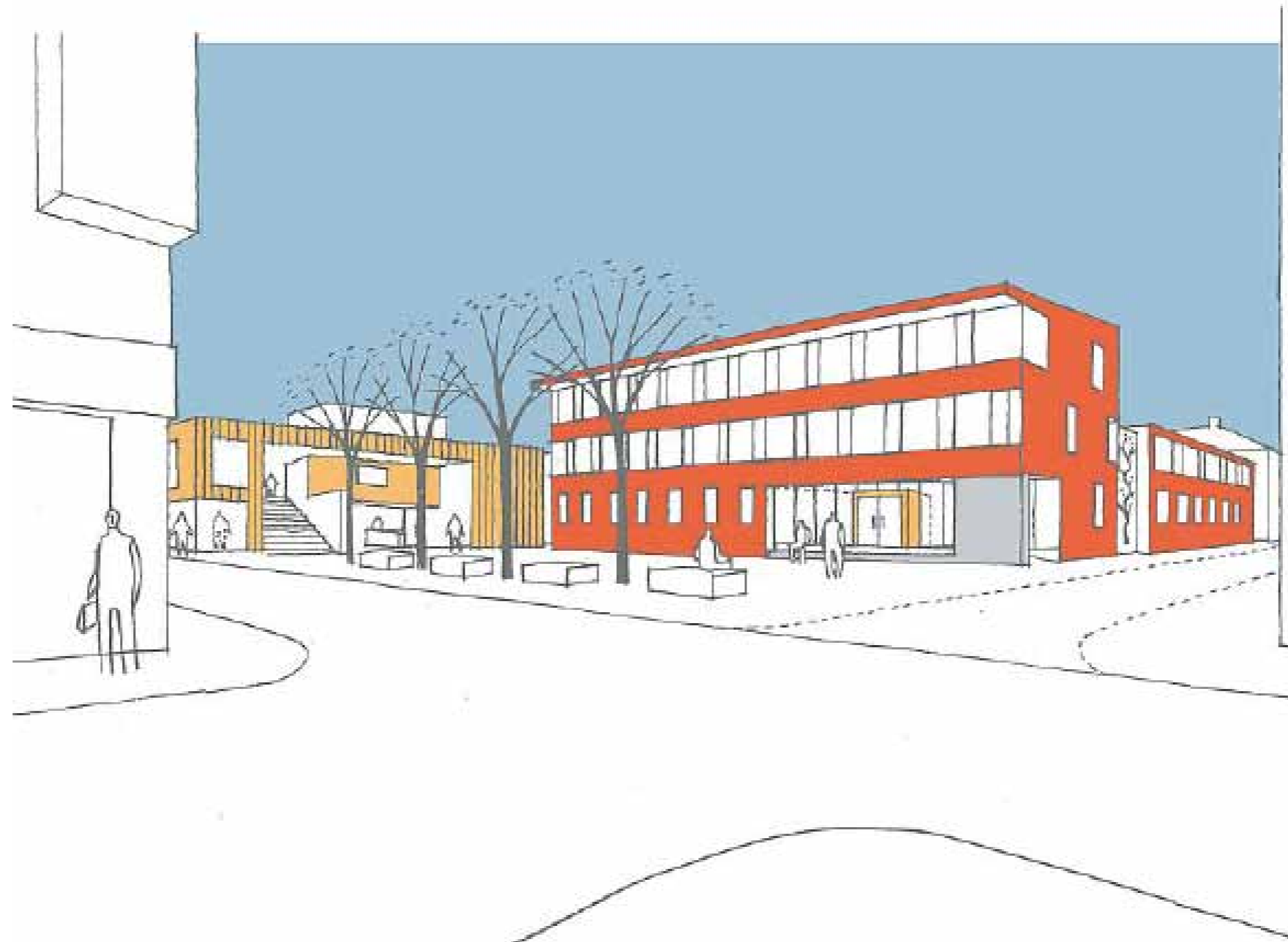
Torgmöte. Bilden är informationsrik men samtidigt avskalad. Informationsrik behöver inte betyda att bilden är plottrig och fylld med detaljer.