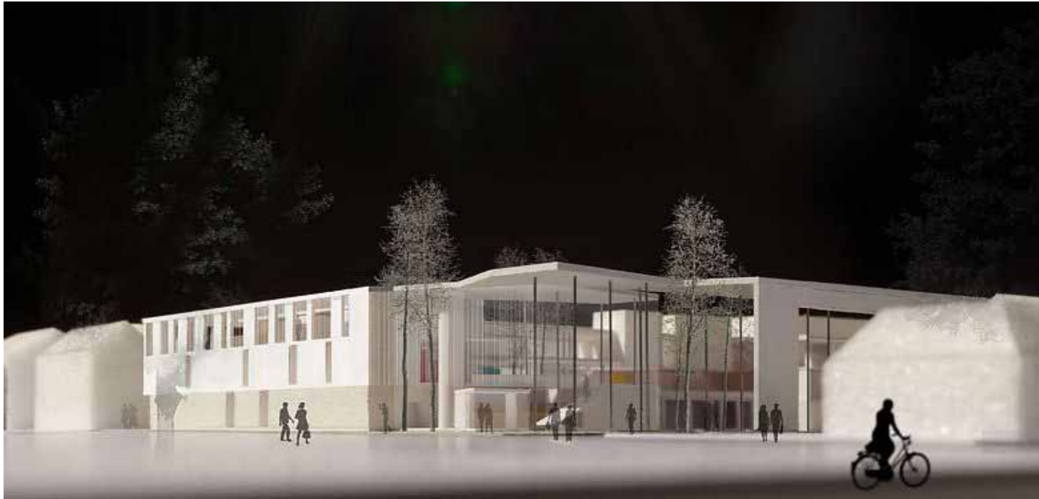
Himlen runt hörnet. Bilden bygger på en modell och är kontrastrik.