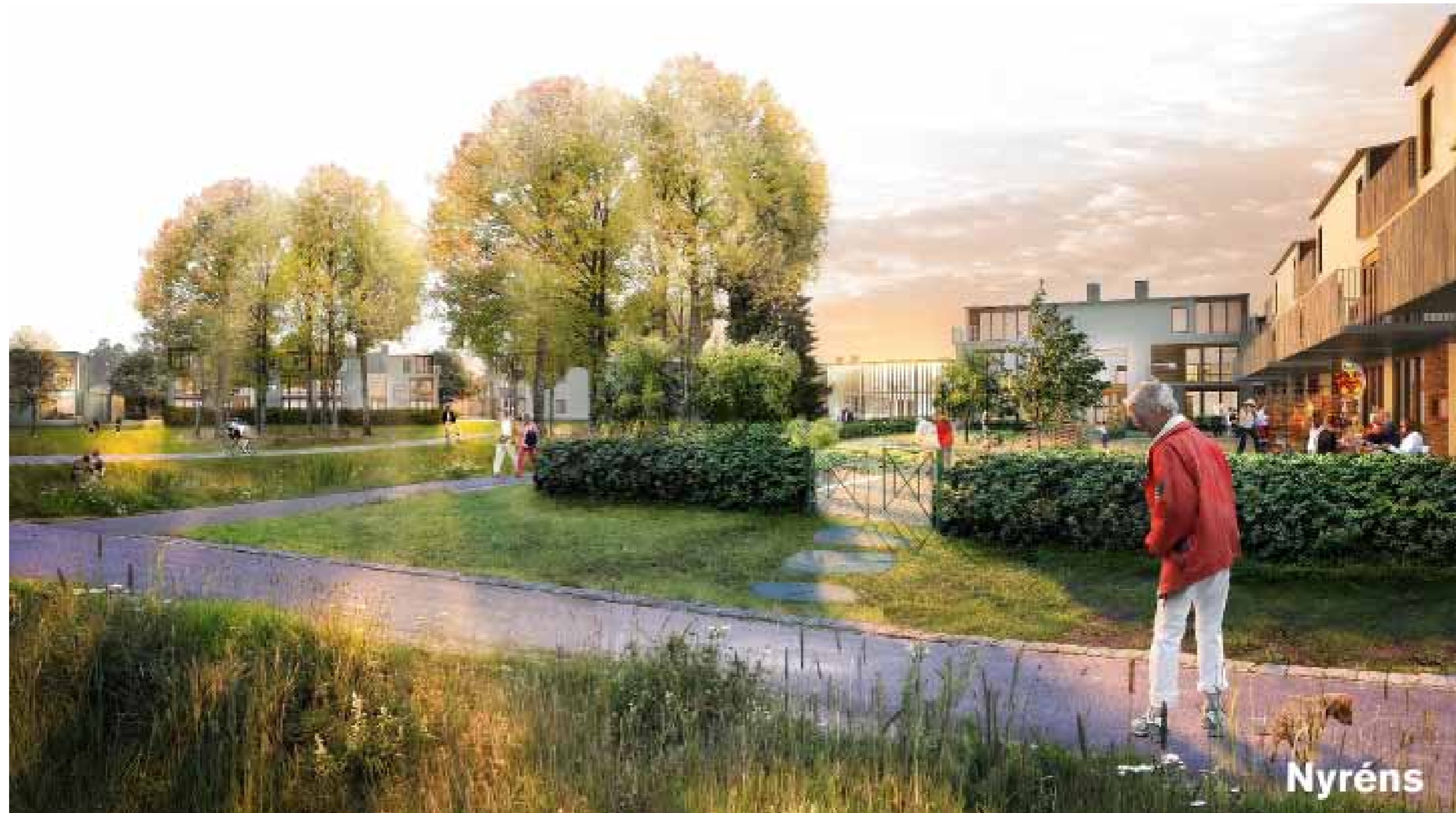
Livet från den ljusa sidan A. Bilden är detaljrik och visar rörelsemönster och användargrupper tydligt. Bild: Med vänligt tillstånd av Nyréns Arkitektkontor AB.