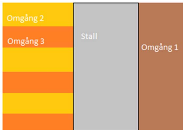
Figur 1. Schematisk bild över betesdrift. Egen bearbetning.

Med bakgrund av problemet med smittryck på betena anläggs ett bete till stallet som är 6 \text{ m}^2 per kycklingplats istället för kravet på 4 \text{ m}^2 . På det sättet kan fälldrifv bedrivas med längre mellanrum, och kycklingarna kommer tillbaka till samma bete var tredje omgång, eller med andra ord var nionde månad. Kycklingarna får i realiteten tillgång till 2 \text{ m}^2 bete var per omgång. På ena sidan anläggs en hage på 3,2 hektar, och på den andra sidan en hage på 6,4 hektar som delas upp i fällor.