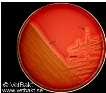
Figur 1, S. pseudintermedius dubbelhemolys.

Staphylococcus pseudintermedius är en Grampositiv kock som på blodagar ger en dubbelhemolys, se Figur 1. Koloniernas utseende visas i Figur 2. Bakterien är koagulas-, DNAs-, katalas- och ureaspositiv, den fermenterar också vissa kolhydrater (Devriese et al., 2005), men den är negativ för ”clumping-factor”.