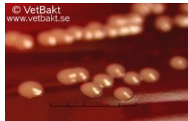
Figur 2, kolonier från S. pseudintermedius .

Pyodermi delas upp i tre klasser beroende på hur djup infektionen är. Dessa är ytpyodermi, ytlig pyodermi och djup pyodermi (Greene C.E., 2011). Om infektionerna inte behandlas kan de utvecklas och bli djupare och därmed allvarligare. Symptom, orsaker och hur allvarliga infektionerna är kan skilja sig mellan de olika klasserna och därför tas dessa upp var för sig.