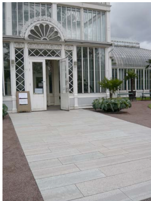
Den nyanlagda gången som leder upp till orangeriets huvudentré. Gångens beläggning är delvis autentisk men till största delen ett tillägg och därför inte helt en restaurerad beläggning.

Vad gör man när det i en kommun uppkommer en diskussion om hur vi ska handla angående en historisk plats som Henckelska gårdens terrass ut mot Södra Storgatan där stenläggningen delvis vittrat sönder och behöver restaureras? Det enklaste hade kanske varit att byta all befintlig sten till ny. Då krävs minimalt med underhåll för