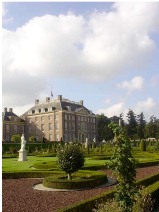
Broderiparterrema framför slottet Het Loo är restaurerade efter plan ritad av Christiaan Pieter van Staden under tidigt 1700-tal.

Processen startade under 1970-talet med många diskussioner och en intensiv dokumentationsprocess. 1980 hade man bestämt sig för hur restaureringen skulle genomföras. Målsättningen att efterlikna den 300 år gamla planen så långt som möjligt höll nästan hela vägen. Men för att kunna genomföra restaureringen var man tvungen att ta bort en befintlig landskapspark som innehöll många ovanliga och intressanta träd. Det blev högljudda protester och det hela slutade med att en del av dessa fick stå kvar som avlagringar från en svunnen tid mitt i parterrererna. 49