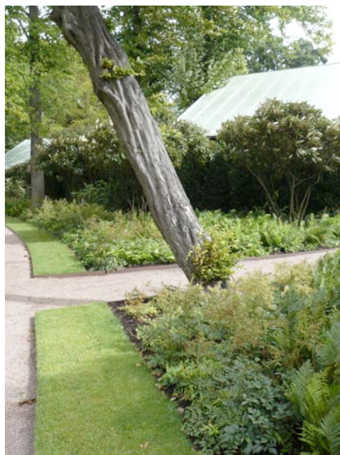
Ett av de moderna woodlanden på Trädgårdsföreningen i Göteborg, placerade utmed en nyrestaurerad gång.

Så då kan man fråga sig varför skulle det egentligen vara rätt någonstans? Kanske skulle det vara det om man har hållningen att det skulle bli museala platser överallt och