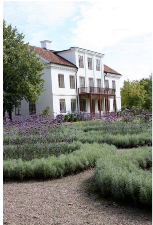
Lavendelringarna framför herrgården på Fredriksdals Friluftsmuseum kan sägas tillhöra metoden fri förnyelse.