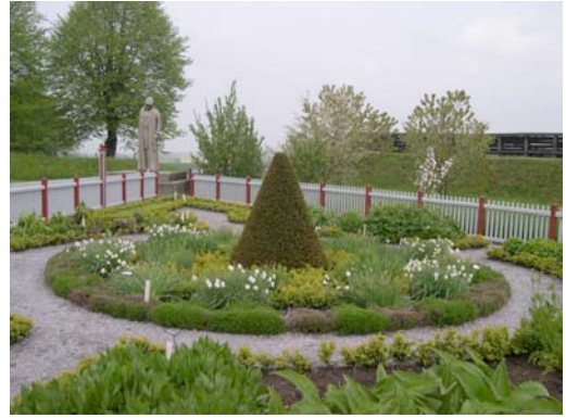
Uraniborgs rekonstruerade trädgård. Bilden visar en av kvartilerna med sina planteringar som inramas av buxbom samt jordvallen med bastionen i bakgrunden.

De viktigaste källorna förutom träsnitten som visar ungefär hur det kan ha sett ut på platsen har varit av olika typ. De har bestått av Brahes egna anteckningar och tryckta skrifter, där han exempelvis beskrivit händelser i trädgården samt gett namn på läkemedel han använt. Han var känd för sina mediciner, bland annat finns historier om Tycho Brahes pestelexir för Kejsar Rudolf den II till vilken han reste efter fördrivningen från Ven 1597. Vidare användes reliktväxter från Ven, dvs sådana växter man kan hitta vilda på platsen runt trädgården och som överlevt från 1500-talet. Tillsammans med växtlistor och trädgårdsbeskrivningar från tiden samt tryckt samtida litteratur som exempelvis läkeböcker kan en uppfattning bildas om tänkbart växtmaterial. 41