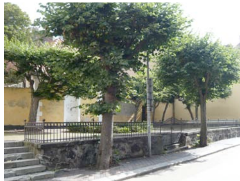
Henckelska terrassen i Helsingborg med mur och trappor i behov av restaurering.

Situationen är komplex, det förstår man genast, men hur löser man ett sådant läge? Jag har inget svar, men jag kan inte släppa tanken på att det vore fantastiskt att i vårt land få se fler gamla ömt vårdade platser i vårt modernt urbana livsrum i städerna såväl som på landsbygden. Hur får man vinstintresset att vändas mot förståelse för vikten av kulturhistoria mitt bland oss i vardagen?