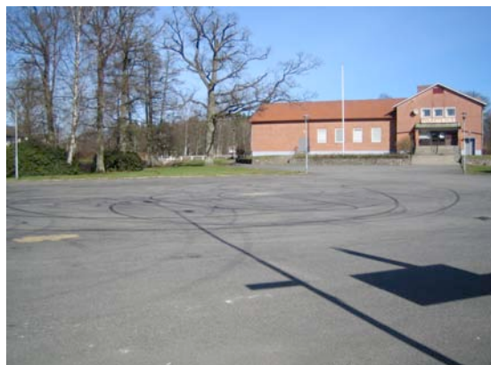
Entrén till Folkets park i Sibbhult är idag en stor asfaltplan vilken används till parkering då och då samt som lekplats för ortens bilburna ungdomar.