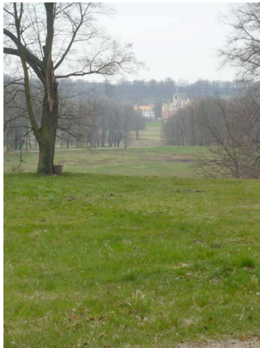
Bild tagen från den polska sidan av Muskauer Park med utsikt mot slottet i tre våningar siktlinjer. Den restaurerade fuktängen syns nedanför backen.

På slottet Het Loo i Holländska Apeldoorn har man genomfört en restaurering med en ovanligt hög ambitionsnivå. Målet var att återställa både byggnader och