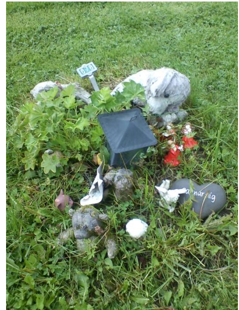
Figur 7 Ogräsbevuxen gravplats med dekorationer på Stora Tuna kyrkogård i Borlänge

När det gäller grästrimning så får personalen gå så nära de kan, helt enkelt hålla sig en bit ifrån så får anhöriga sköta resten. Detta för att det ska vara säkert för kyrkogårdspersonalen. När man lämnar resten brukar anhöriga höra av sig och då ges en förklaring. Mattias Elofsson anser att det är en jättebra arbetsgång. Hör inte gravrättsinnehavaren av sig eller inte sköter sin rabattkant då de inte trimmar den, kan gravplatsen gå över till att bli en ovårdad grav (Figur 7). Då tar de kontakt med gravrättsinnehavaren genom att skicka ett fotografi av gravplatsen. Då kanske den anhörige gör något åt gravplatsen.