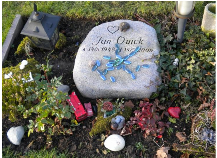
Figur 6 Gravplats med dit lagda små glasföremål Fredentorps begravningsplats i Lund

På frågan om de har fått klagomål på dessa överdekorerade gravar svarar Lennart Angselius med ett exempel: