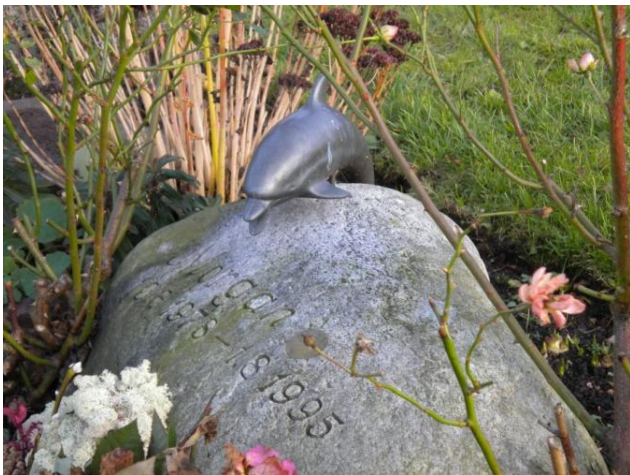
Figur 1 Delfin istället för duva, på Fredenstorps begravningsplats i Lund