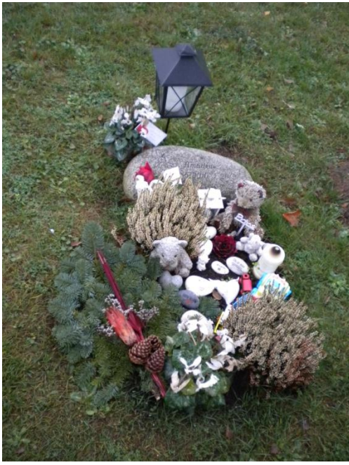
Figur 8 Barngrav med dekorationer på Norra kyrkogården i Trelleborg