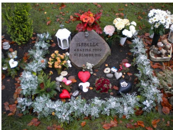
Figur 3 Barngrav på Norra kyrkogården i Trelleborg