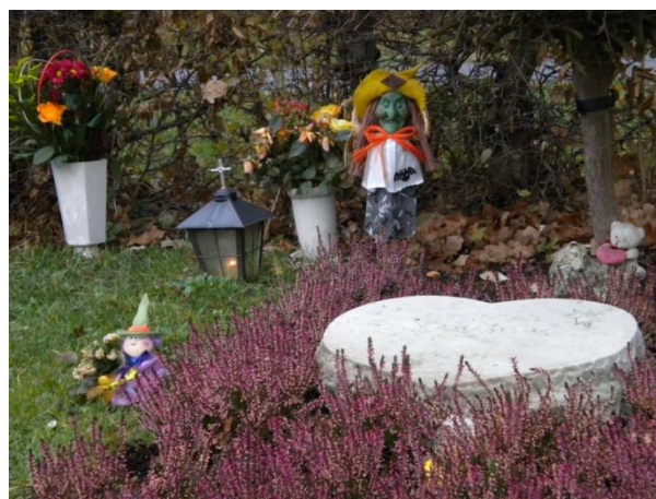
Figur 4 Dekorationer på Norra kyrkogården i Trelleborg