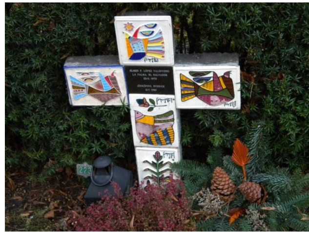
Figur 2 Intressant personligt präglad gravanordning på Östra kyrkogården i Jönköping

Enligt begravningslagen (2011) kapitel 7, 25 § får gravplatsen förses med valfri gravanordning om den inte strider mot vad som gäller för den begravningsplats där gravplatsen är belägen. Gravrättsinnehavaren har också rätten, enligt 21 §, att bestämma vilka som ska gravsättas på gravplatsen om inte något annat föreskrivs. Enligt 27 § ska gravanordningen prövas och se om den kan tillåtas, men enligt 26 § är det gravrättsinnehavaren som bestämmer utseendet på gravanordningen samt gravanordningens karaktär. Detsamma gäller för gravplatsens utsmyckning och ordnande i övrigt. Upplåtaren har dock rätt till att besluta om begränsningar för att gravanordningen ska tillgodose nödvändig och god gravkultur. Enligt 27 § i begravningslagen ska upplåtaren undersöka om gravanordningen kan tillåtas att sättas upp. Och enligt 28 §, när gravanordningen väl är uppsatt får den inte föras bort utan tillåtelse från upplåtaren. När det gäller ändringar på gravplatsen får upplåtaren enligt 30 § utföra ändringar på gravplatsen endast med gravrättsinnehavarens tillåtelse. Undantag gäller vid nödvändiga ändringar för att tillgodose krav på miljöskydd, hälsoskydd och arbetarskydd. (Notisum, 2011)