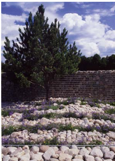
Den strama Heden.