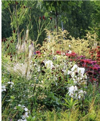
Brynet myllrar av liv.

medförde att jag, genom att titta på bilderna, fick känslan av att jag befann mig inomhus. Det rena och strikta stoppar den naturliga rörelsen i dessa fyra trädgårdar.