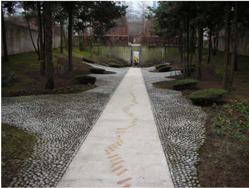
I den mittersta trädgården börjar det hårdgjorda inkräkta på det naturliga.

De ekologiska värdena i Cleménts trädgårdar som jag funnit är beroende av att teorin om den föränderliga trädgården följs i praktiken, vilket jag inte haft möjlighet att kontrollera.