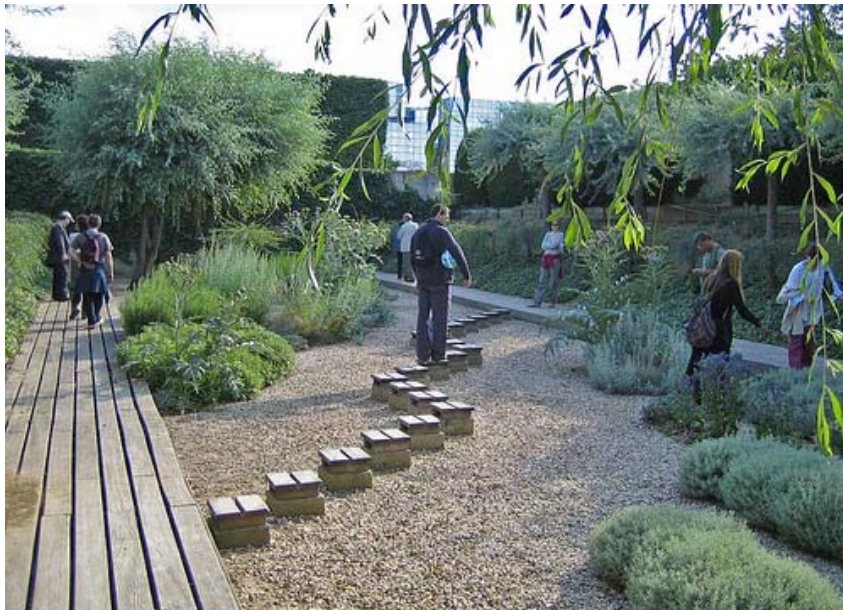
Den sjätte trädgården består av grus och trädäck i raka linjer utifrån vilka växtligheten får anpassa sig.

Kopplingen till planeter, sinnen, vattenkaraktärer, dagar, färger och metaller var dock väldigt otydlig. Kontrasterna i parken framkallade ändå en upplevelse, trots att jag inte förstod symboliken fullt ut.