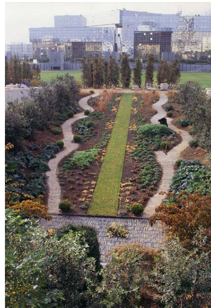
Den tredje trädgården från floden.

Den tredje trädgården från floden är jämfört med den föränderliga trädgården mer arkitektoniskt och de ekologiska värdena minskar men inom vissa gränser är naturen friväxande. I den mittersta trädgården tar det hårdgjorda alltmer över den friväxande naturen och tränger undan de ekologiska värdena. Växtmaterialet i den sjätte trädgården är ytterligare begränsat av trädäck och grus vilka placerats i raka och strikta former.