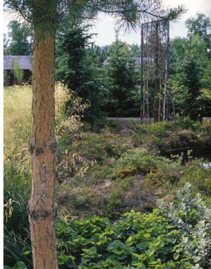
Den känsliga Myren.

Naturligt är artsammansättningen som störst i skogsbrynen och i detta trädgårdsrum, "Brynet", konkurrerar träd, solitärbuskar, perenner och gräs om utrymmet. I ett överdåd trängs vilda arter med hortikulturella för att påvisa naturens mångfald.