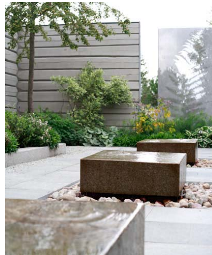
Med himlen som tak, den mest arkitektoniska trädgården.

Den visuella kontakten med det omgivande landskapet är också ett viktigt estetiskt värde för Skogen trädgårdar. Den stiliserade naturen i trädgårdarna skapar en kontrast till det storskaliga odlingslandskapet omkring. Samtidigt representerar den olika miljöer i det omgivande landskapet i en förkonstlad form, som om han plockat ut huvudkaraktärerna och framhävt dessa mot en ren bakgrund av moderna, hårda material. Detta formspråk, att blanda moderna, rena, enkla material med en växtlighet som tas från den vilda naturen, som tyglas och förstärks, tycks vara Nordfjells specialitet.