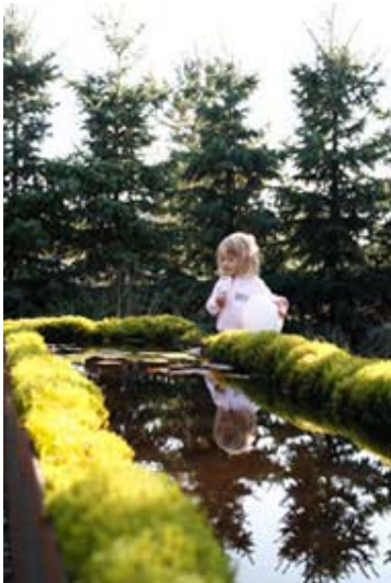
Den lugna och mystiska Tjärnen.

Grå timmerväggar med öppningar mot landskapet har placerats i det trädgårdsrum som inspirerats av hortikulturen, Med himlen som tak. Detta rum är hårt tyglat av människohand samtidigt som det öppnar upp mot och tar in det omgivande odlingslandskapet, precis som i Villa Gamberaia. En digital bild av en ormbunke utskuren i stål och stenar av granit ger ett förenklat och stiliserat intryck av det naturliga.