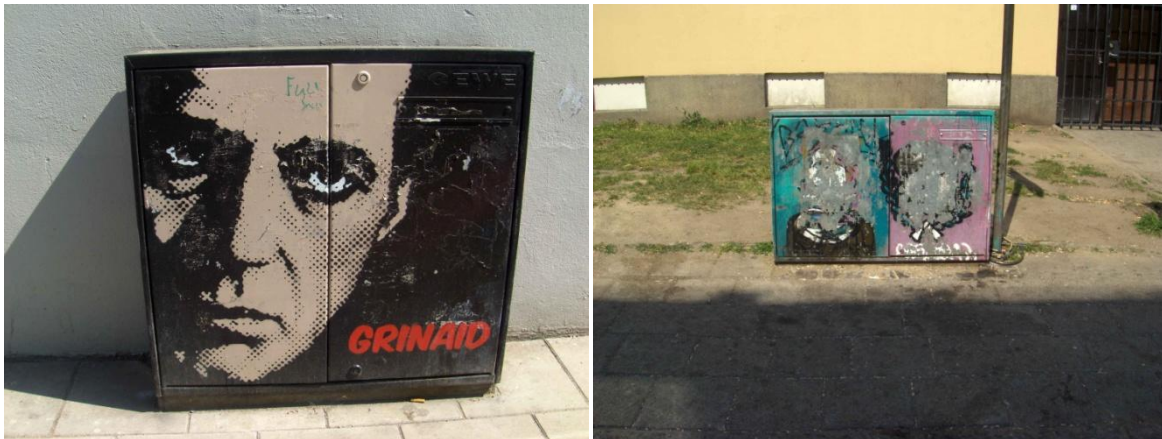
Humphrey Bogart, av GRINAID, ifrån 2009, elskåp på Sevedsplan (vänster). Exempel på Rasmusgatan målat 2009, som inte hållit lika bra (höger). Foto: Karin Ingemansson, 2011.

Rosenqvist framhöll att det är viktigt med ett långsiktigt tänkande när man förändrar omgivningen men att processen ibland tar alldeles för lång tid. Små insatser kan dessutom göra stor skillnad; att se en solros växa upp på ett par månader gör att de boende direkt ser att det händer något.