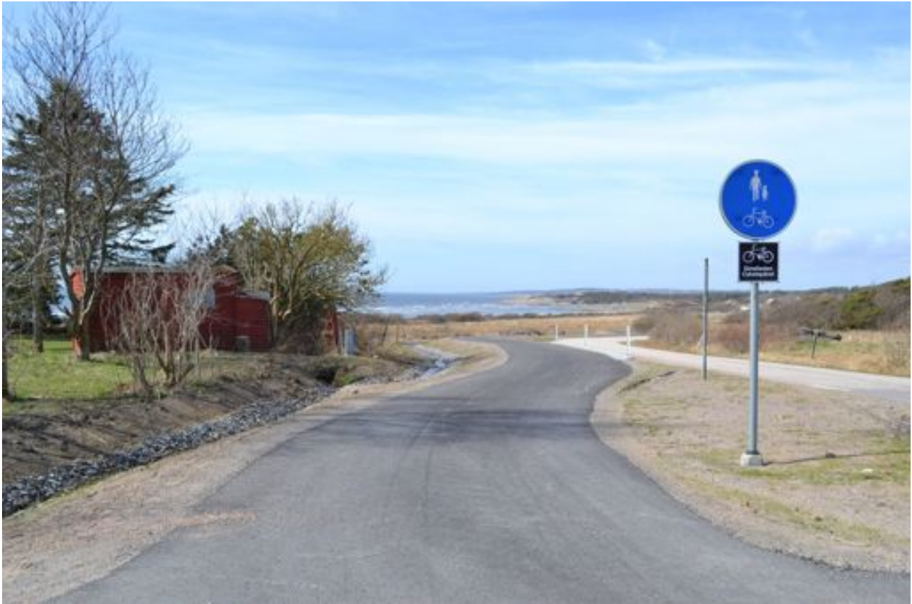
Figur 1. Kattegattsledens dragning genom Ugglarp är till viss del färdig.

Utvecklingen av Kattegattleden överensstämmer med delar av ELC, exempelvis i konventionens första artikel under definitioner. Där står det bland annat att definitionen av landskapsplanering är kraftfulla framtidsinriktade åtgärder för att förbättra landskap. Kattegattleden är en kraftfull insats för att tillgängliggöra och länka samman landskapet på västkusten.