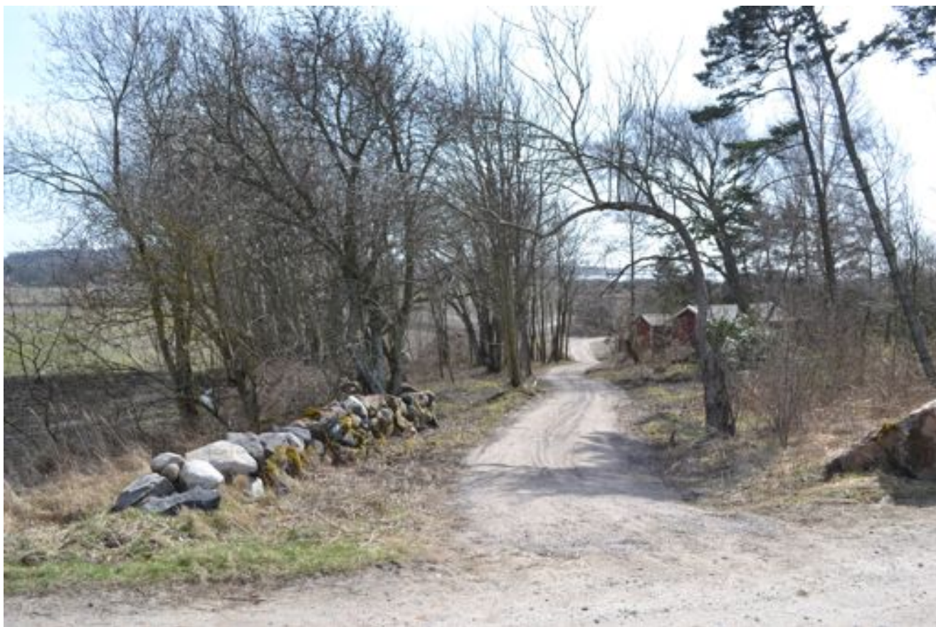
Figur 2. Leden har till viss del börjat att anläggas

“Ambitionen med vandringsleden är att fler ska få chansen att uppleva den vackra kuststräckan mellan Ugglarp och Ugglarps kvarn. Kuststräckan är populär och besöks flitigt av vandrare året runt, men det saknas i dagens läge en vandringsled som binder ihop kustens många olika karaktärer. En vandringsled med bra markmaterial, spänger där vatten behöver korsas och informationsskyltar som delger avstånd, vägval och fakta om flora och fauna är efterfrågad. I framtiden har vi som vision att leden kan utvecklas och binda ihop Ugglarp med både Stensjö och Steninge där ytterligare miljö- och kulturvärden återfinns. (Roupe, Selander 2010)