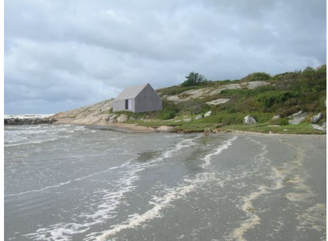
Figur 3. Gestaltningförslag för Trossnäsbastun Figur 4. Gestaltningförslag för Trossnäsbastun

Bastuprojektet är ett socialt utvecklingsförslag som syftar till att skapa en mötesplats vid havet året runt. ELC innehåller inga avsnitt som beskriver vilka sorts projekt som skall uppmonteras. ELC behandlar inte projekt utifrån dess intentioner på personnivå, som i detta fallet skapa en social mötesplats, utan fokuserar på de övergripande intentionerna med projektet, och processerna som legat till grund för projektet. Därför blir argumentationen på detaljnivå, samma som den på lokal nivå, nämligen att den lokala kännedomen om området, och allmänhetens önskemål om landskapets utveckling skall väga tungt vid besluttande. Om bastun är något som allmänheten vill ha, samtidigt som förslaget förhåller sig till föreskrifter och restriktioner, utformas efter fackkompetens och det utvärderas så att inga biologiska faktorer störs så stödjer ELC förslaget. Om lagarna som styr kan harmonisera kring ett förslag så skall stadsbyggnadskontoret, eller motsvarande myndighet som är ansvariga för planer på området, anse att förslaget från en lokal förankrad förening skall väga tungt och argumenten för projektet blir på så vis starkare.