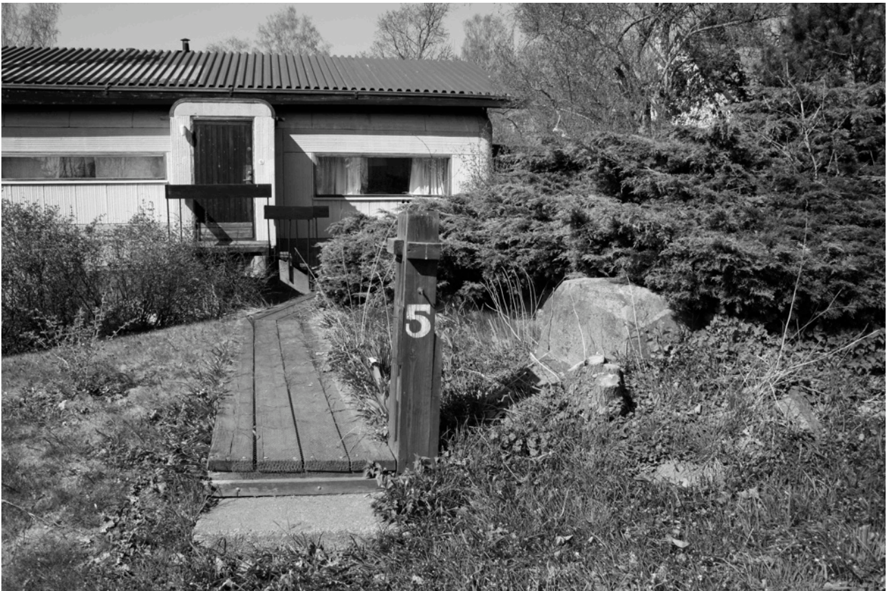
Figur 5. Villa Erskine från 1963 på Drottningholm utanför Stockholm.