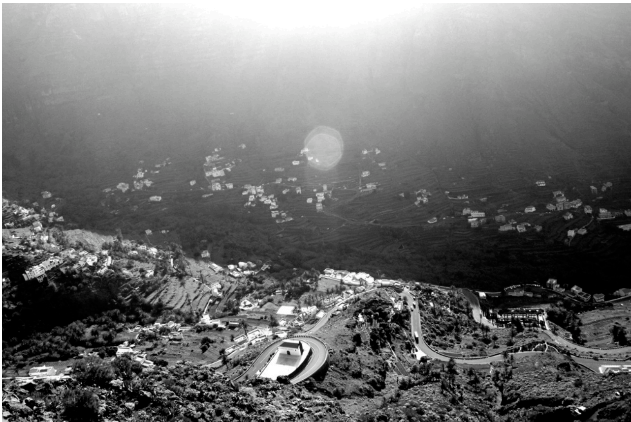
Figur 2. Natur och kultur.

I teoribakgrunden till uppsatsen hänvisas här synen vi människor har på naturen till synen på vår roll i naturen. Vi kan välja att se oss som härskare, som undersåtar eller som jämlikar till naturen. För att koppla den natursynen till frågeställningen undersöks i det här kapitlet olika världsbilder och bilder av natur som har uppkommit under historien och i viss mån hur de kan uttryckas i byggnation eller andra mänskliga verk.