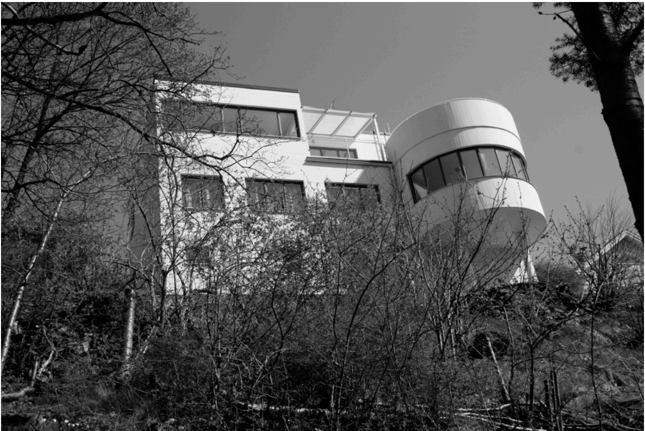
Figur 3. Villa Markelius från 1930 i Nockeby, Stockholm.