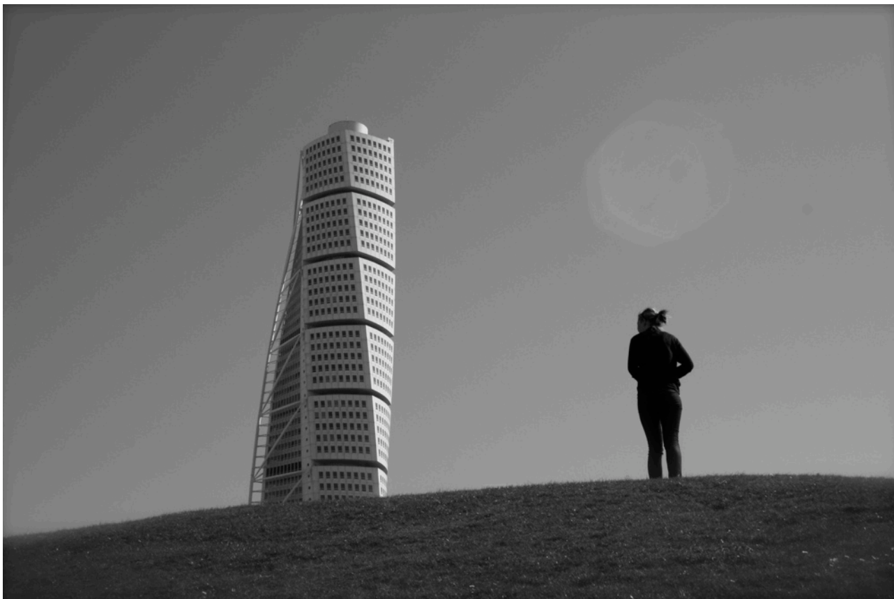
Figur 1. Byggnaden, landskapet och människan.

För att kunna förstå byggnadens relation till landskapet måste jag gå in djupare på byggnadens varande och filosofiska form. Kapitlet fungerar som en bakgrund till byggnaders koppling till landskapet och behandlar även hur människans förhållande till naturen ger upphov till goda, enligt författarna, och mindre goda exempel på byggnaders möten med landskapet. Det kan utläsas i kapitlet att byggnaders relation till landskapet kan spegla människans natursyn genom både fysiska och mentala/ spirituella förhållningssätt.