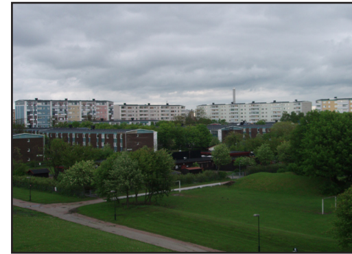
Fig 3. Foto över miljonprogramsområdet Holma i Malmö. (110517)

"Ofta har förorten i debatten använts som symbol eller kanske till och med som kuliss för generella moderna samhällsproblem." (Riksantikvarieämbetet, 2004, p. 30).