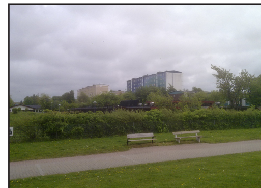
Fig 5. Foto över miljonprogramsområdet Holma i Malmö. (110516)