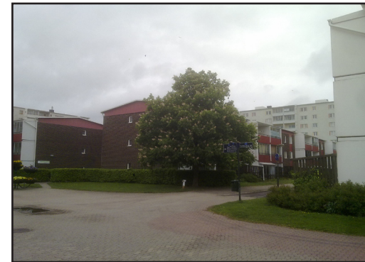
Fig 4. Foto över miljonprogramsområdet Holma i Malmö. (110516)