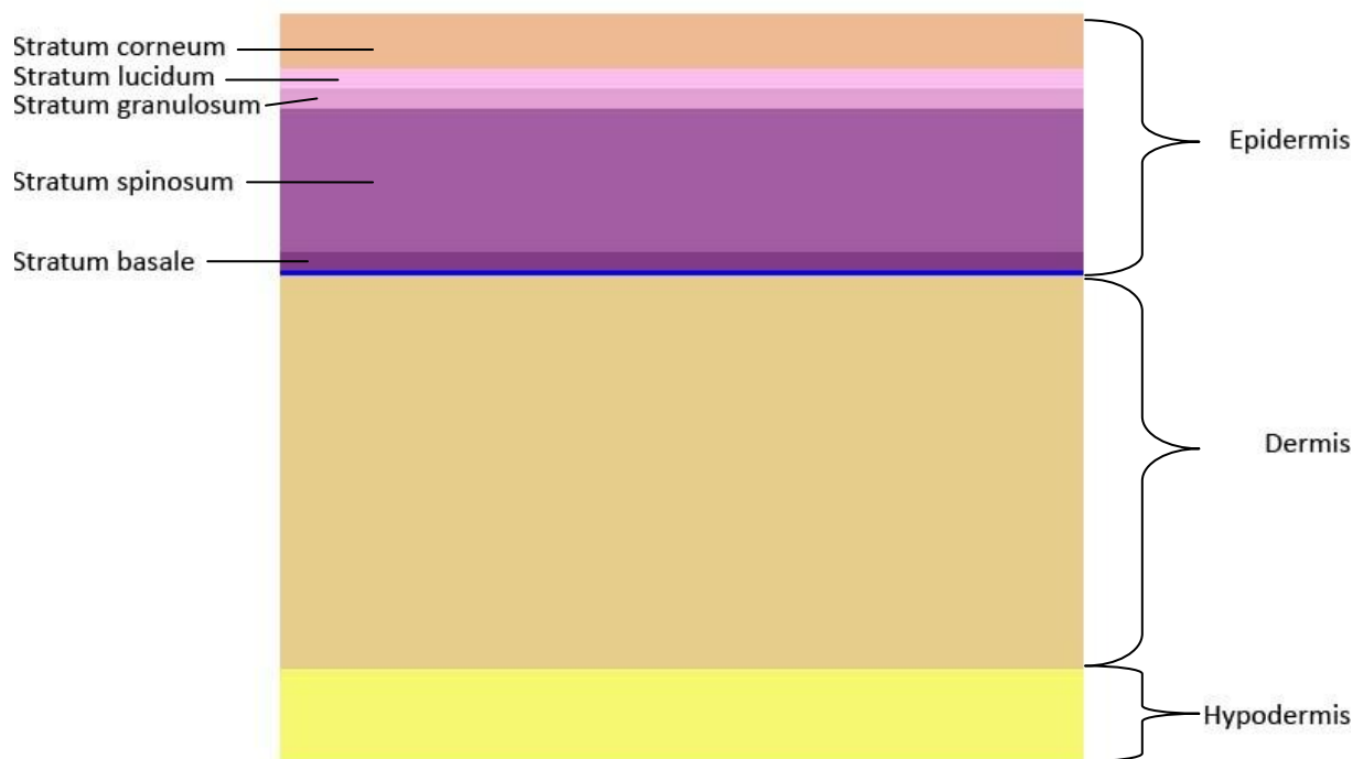
Figur 2. Hudens lager (efter Junqueira & Carneiro, 2005). Epidermis och dermis hör till det som kallas cutis. Stratum corneum består av keratiniserade celler. I stratum basale (även kallat basalcellslagret) finns bland annat keratinocyter och melanocyter. Under basalcellslagret finns basallaminan (här markerad som ett blått streck). Dermis består av bindväv, nerver, kärl med mera. Under cutis (kutan vävnad) ligger subcutis (subkutan vävnad), hit hör hypodermis som är gränsen mellan hud och underliggande vävnad.

Melanocytiska tumörer kan vara antingen benigna eller maligna. Uppkomsten sker när melanocyter omvandlas till neoplastiska celler (Withrow & Vail, 2007). Det finns varianter på melanocytiska tumörer, typen beror på lokaliseringen av neoplasin. Det rör sig dels om olika spridning i hudlagren, men även på olika anatomiska lokaliseringar. De kan alltså vara intraepidermala eller dermala (Figur 2), eller en blandning av dessa. De kan också vara lokaliserade till bland annat behårad hud (bål och ben), mucosa och tår (Gross et al., 1992).