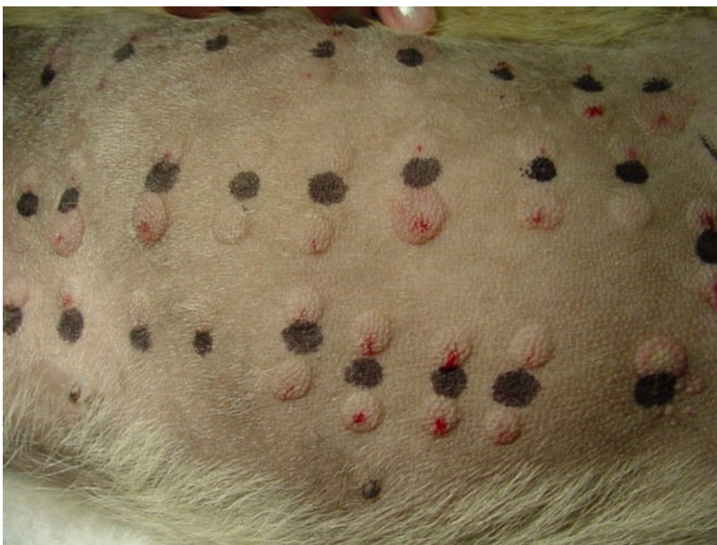
Figur 4. Intradermalt allergitest hund.

Det finns två olika sorters allergitest; serologi där man analyserar blodprov med avseende på allergenspecifika IgE-antikroppar; och intradermaltest (se figur 4) där man injicerar allergenextrakt på olika punkter i huden och jämför reaktionen mot en positiv och negativ kontroll. Dessa tester är viktiga för att ta reda på vilka allergen som hunden reagerar mot och därmed kunna behandla specifikt (Olivry et al., 2010). Hela 86% av atopiska hundar testar positivt (Favrot et al., 2010). Den grundläggande diagnosen kan dock inte ställas via allergitester på grund av låg specificitet, det vill säga att även normala hundar kan testa positivt. Diagnos ställs istället genom noggrann undersökning och utförlig anamnes, då sjukdomen ofta uppvisar typiska symtom och progressivitet, samt genom att utesluta möjliga differentialdiagnoser (Olivry et al., 2010). Dessutom kan man, som tidigare nämnts, inte detektera IgE-antikroppar hos alla hundar med atopisk dermatit (Halliwell, 2006).