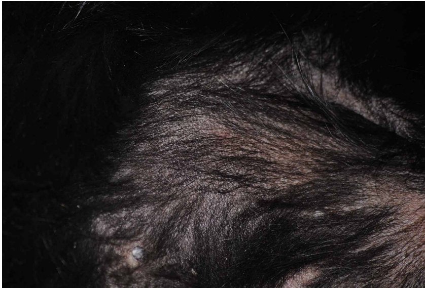
Figur 3. Ventralt på buken mot ljumskarna ses självinducerad alopeci, erythem och hyperpigmentering.

I detta läge uppstår de första symtomen på atopisk dermatit. Oftast uppstår klådan före några andra förändringar i huden kan ses (Favrot et al., 2010). Vad som orsakar klådan är dock fortfarande inte känt trots forskning, här skiljer sig hunden åt från både människa och mus där histamin med ursprung från mastceller visats vara orsaken till klådan. De första förändringarna som kan ses är små områden med papler och erythem, vilket dock snabbt övergår till självinducerade lesioner med alopeci, likenifikation och hyperpigmentering, se figur 3 nedan (Olivry et al., 2010).