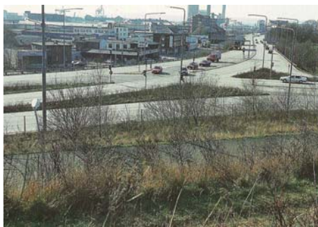
Figur 4. Trafikplats innan ombyggnad till cirkulationsplats. Ur Hermansson 1999 s. 127.

En cirkulationsplats kan användas som en stadsport. Den innehåller funktioner som gör trafikanter uppmärksammade och snabbt börjar agera som gatutrafikanter. I många fall är cirkulationsplatsen en tydligare markering på mötet med staden än ljusreglerad korsning. Trafikanter dämpar alltid hastigheten vid ankomst till en cirkulationsplats. Men vid en ljusreglerad korsning kan trafikanter vid grönt ljus snabbt passera utan hastighetsdämpning. Jämför figur 4 och 5. En cirkulationsplats har även goda möjligheter att utformas till estetiskt tilltalande miljöer (Schibbye 1994 s. 10).