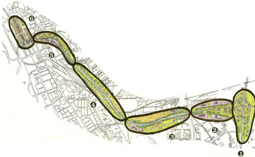
Figur 3. Helsingborgs södra stadsentré byggs upp av sex karaktärszoner. Ur Schibbye 1994 s. 6.