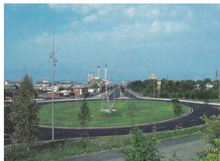
Figur 5. Trafikplats efter ombyggnad till cirkulationsplats. Ur Hermansson 1999 s. 127.

Skulpturer eller byggnadsverk i stadsportens skala kan uppföras för att väcka besökarens intresse (Laurén 1992 s. 20). Att låta konstnärer medverka vid utformning av stadsporten kan bidra till en lyckad helhetslösning. Det är viktigt att låta konstnären kliva in i projektet i ett tidigt skede för att få ett lyckat resultat. Konstverk löper annars en risk att