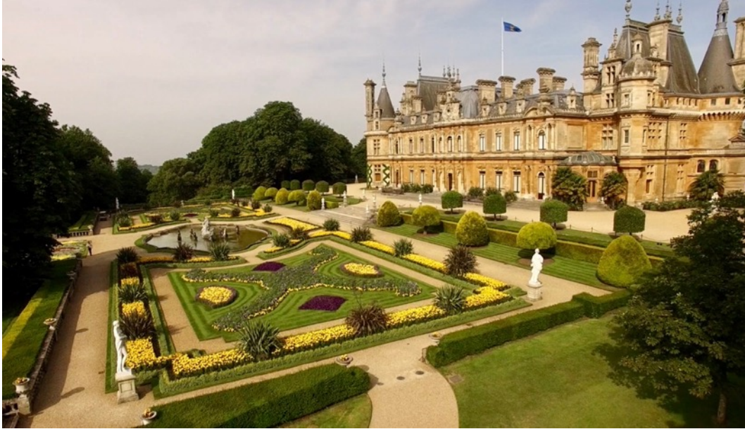
Figur 10. Vy över Waddesdon Manor och parterren på baksidan av herrgården, i en lätt sluttning. Bilden visar hur terrasserna är uppbyggda i flera nivåer med trappor emellan, vilket skapar sekvenser av rum (Rothchild foundation, 2026).

Parterrerna i de två olika trädgårdarna har olika uppbyggnad och betydelse. I en jämförelse skiljer sig parterrerna i skala och komplexitet. Figur 11 visar den mindre och enklare parterren på Hidcote med endast en blommärg inramad av en låg häck och utan gräsmatta. Båda är dock geometriskt formade och symmetriska, vilket ger en formell karaktär (Robinson, 2011).