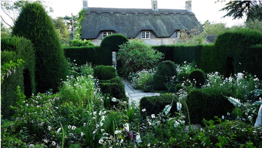
Figur 8. Den vita trädgården med klippta topiarier i form av fåglar framhävs av vita spretiga perenner (National Trust, u.å.).

Tanken är att trädgården inte ska kunna överblickas från en enskild punkt. Detta anses Johnston ha läst om i The art and craft of garden making av Thomas Mawson. Mawson (1900) beskriver att arrangemanget bör vara en serie av rum hellre än ett panorama som kan överblickas från en plats. Det saknas en helhet. Enligt Hidcote: a garden for all seasons (2011) ska en besökare istället ledas in i ett utrymme, bli lockad av en vy, sedan ledd i en annan riktning. Detta skapar drama i trädgården. Terrängen används för att bidra till detta genom trappor, broar och höjdskillnader. I slutet av centralaxeln vid Havens gate kan man, som ett mål, se solnedgången vid vissa årstider (Hidcote: a garden for all seasons , 2011).