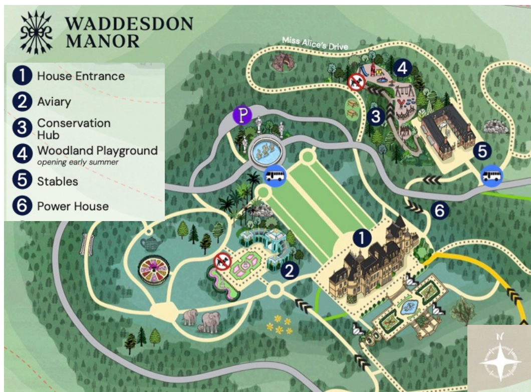
Figur 4. Plan över Waddesdon Manor och trädgård där parterren syns sydost om herrgården (1) (Rothchild foundation, 2026).

Huvudbyggnaden på Waddesdon är en slottsliknande herrgård med storslagna vyer. I nordväst från gårdsplanen, omgärdad av prydnadsskogar, går en axel som utgör den formella infarten. Axeln består av en gång genom en rektangulär gräsmatta kantad av klippta träd och avslutas bortom gräsmattan vid en rund damm, se Figur 4 (Rothchild foundation, 2026). Robinson (2011) anser att den tydliga axeln ger en stark riktning medan blickfånget i dammen är ett tydligt mål (Robinson, 2011).