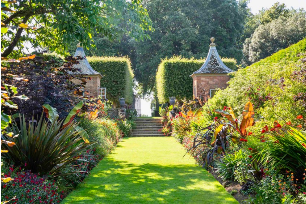
Figur 6. Foto på de röda rabatterna med varierade perennplanteringar inramade av höga häckar som skapar ett avlångt rum. Lusthus och klippta avenbokar i bakgrunden (National Trust, u.å.).

Johnston var en växtjägare och samlade in många exotiska växter. Dessa visade han gärna upp i trädgården som hade en blandning av importerade och inhemska växter. Arts and Crafts-trädgårdar hade oftast mindre fokus på botanisk prestige (Hitchmough, 1997).