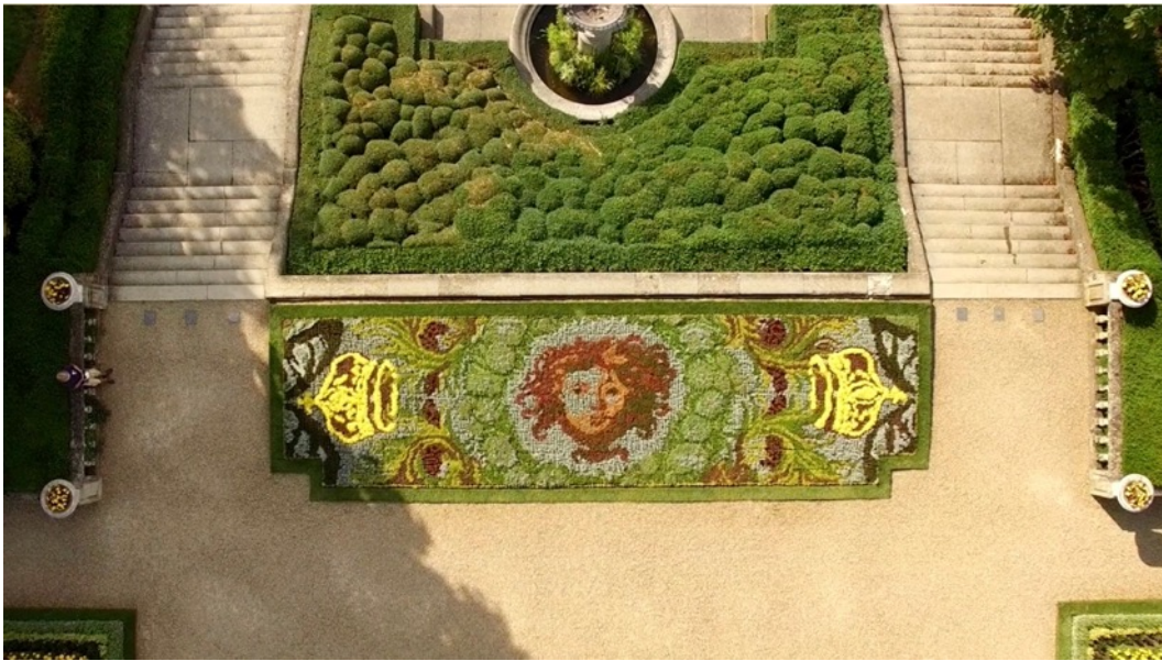
Figur 13. Blombädd på Waddesdon i ett tydligt symmetriskt mönster. I slänten nedanför syns molnformade buxbomskuddar (Rothchild foundation, 2026).

Öppna platser kan enligt Robinson (2011) leda till att orienteringen förloras. På Waddesdon motverkas detta genom att använda växtlighet som arkitektoniska element, där alléer skapar riktning, häckar avgränsar rum och blombäddar styr blicken (Robinson, 2011).