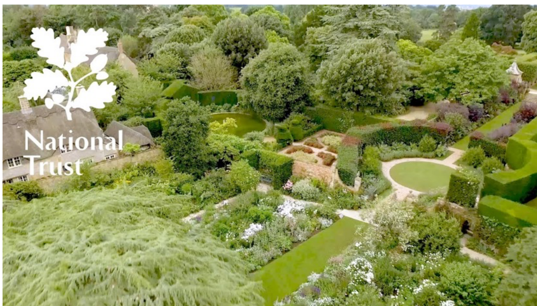
Figur 7. Översikt av Hidcote där centralaxeln kan ses löpa genom cirkeln och de röda rabatterna (t.h. i bild). Parterren som leder vidare till poolen syns till vänster om cirkeln, allt omgärdat av höga häckar som ger trädgården en hög grad av slutenhet (National Trust, u.å.)

Gräsmattan är central i trädgården och länkar vidare till andra rum, format som ett kluster, enligt Robinson (2011). Viss symmetri bidrar till ordning i klustret (Robinson, 2011). På den västra sidan av gräsmattan finns ett inneslutet utrymme som nås via en trappa (National Trust, u.å.). Detta mindre rum skapar en extra nivå, ett rum i rummet. Eftersom rummet är upphöjt kallas det för podiet och var en plats att dricka te efter boulespel. Enligt Robinson (2011) har det mindre rummet en högre social status eftersom färre personer kan vistas där samtidigt (Robinson, 2011).