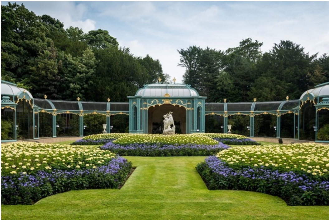
Figur 1. Geometriska tapetgrupper i gult och blått framför voljären på Waddesdon (Rothchild foundation, 2026).

Efter de fria, rustika engelska landskapsparkerna på 1700-talet blev det under den viktoriańska eran åter populärt med mer tydligt designade trädgårdar där tapetgrupper fick ta plats, se Figur 1. Stora mängder färgrika och ibland exotiska växter planterades i enkla mönster. 1875 presenterades en tapetgrupp av blommor i fjärilsform vid Kristallpalatset i London. Denna gav inspiration till mer avancerade mönster där bara fantasin satte gränserna (Dunér, 2004). Ömtåliga växter kunde frodas genom att odlas i växthusen (Hitchmough, 1997).