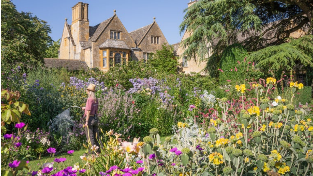
Figur 2. Hidcote Manor i samklang med trädgården av vilda perenner. (National Trust, u.å.)

från mästare till lärling (Hitchmough, 1997). Enligt Hitchmough (1997) var målet för många Arts and Crafts-trädgårdsmästare att människan och naturen skulle leva tillsammans i harmoni, vilket syns i Figur 2 från Hidcote. Förutsättningarna på platsen skulle tas i beaktning, planteringar anpassades efter klimat och jordmån. Landskapets karaktär och form bevarades så långt som möjligt (Hitchmough, 1997).