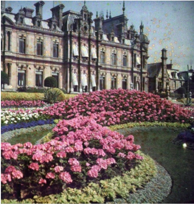
Figur 9. Praktfull blomning i parterrerna på Waddesdon (Rothchild foundation, 2026).

Parterren framför herrgården är ett tydligt fysiskt avgränsat rum med nivåskillnader och symmetri, enligt Rothchild foundation (2026). Trädgården är uppbyggd i terrasser med trappor och balustrader, eller låga staket, vilket skapar sekvenser av rum, detta framgår i Figur 10 (Robinson, 2011). Till skillnad från Hidcote så skapas rumslighet främst genom stora trädbestånd, buskar och planteringar snarare än höga häckar (Rothchild foundation, 2026).