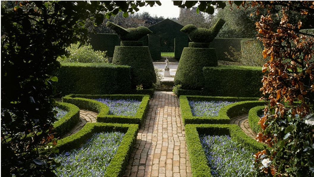
Figur 11. Genom portalen som gränsar till cirkeln på Hidcote syns den enkla parterren med blommor i en färg. De smala övergångarna mellan rummen skapar däremot stor uppmärksamhet och dramatik, enligt Robinson (2011). (National Trust, u.å.)