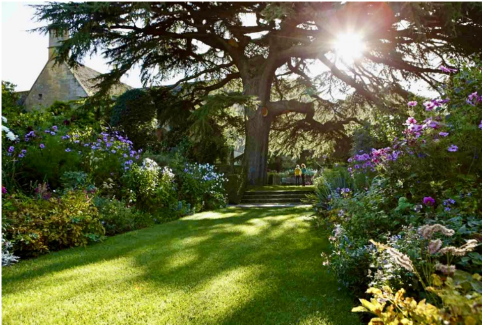
Figur 12. Vy från cirkeln på Hidcote, genom den gamla trädgården med dahlior, rosor och stjärnflocka samt cederträdet som ett blickfång ovanför trapporna. Trädet är medvetet placerat på sidan av gången (National Trust, u.å.).

På Waddesdon innehåller tapetgrupperna ofta tulpaner på våren medan sommarens blommor är begonior, pelargoner och lobelia enligt Rothchild foundation (2026). Vårblommor i planteringarna är krokus och narciss. Blommorna byts ut flera gånger under året för att anpassa efter säsongen och för att alltid vara dekorativa (Rothchild foundation, 2026). Planteringarna skiljer sig därmed från Hidcote, där tapetgrupper inte används på samma sätt. Hidcote har främst perennkompositioner med en stor variation i form, färg och växtsätt, vilket ger ett mer livfullt och informellt uttryck i jämförelse (National Trust, u.å.).