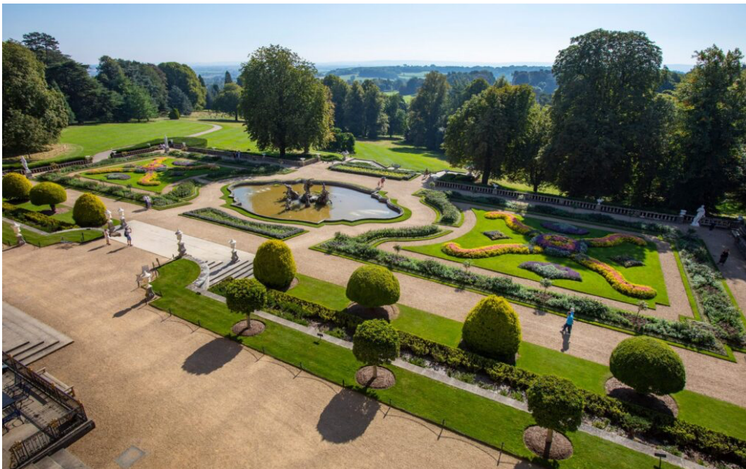
Figur 3. Vy från herrgården över terrasserna och parterrererna på Waddesdon garden (Rothchild foundation, 2026).

De formella terrasserna och parterrererna i Figur 3 speglar den franska stilen på herrgården, enligt Rothchild foundation (2026). Tusentals blommor planteras två gånger per år för att skapa färggranna mönster. Franska och italienska skulpturer och fontäner är andra exempel på det viktorianska idealet. Klippor och en vattenträdgård med sjöar, vattenfall, vattenkonst samt vindlande stigar fanns också att beskåda (Rothchild foundation, 2026).