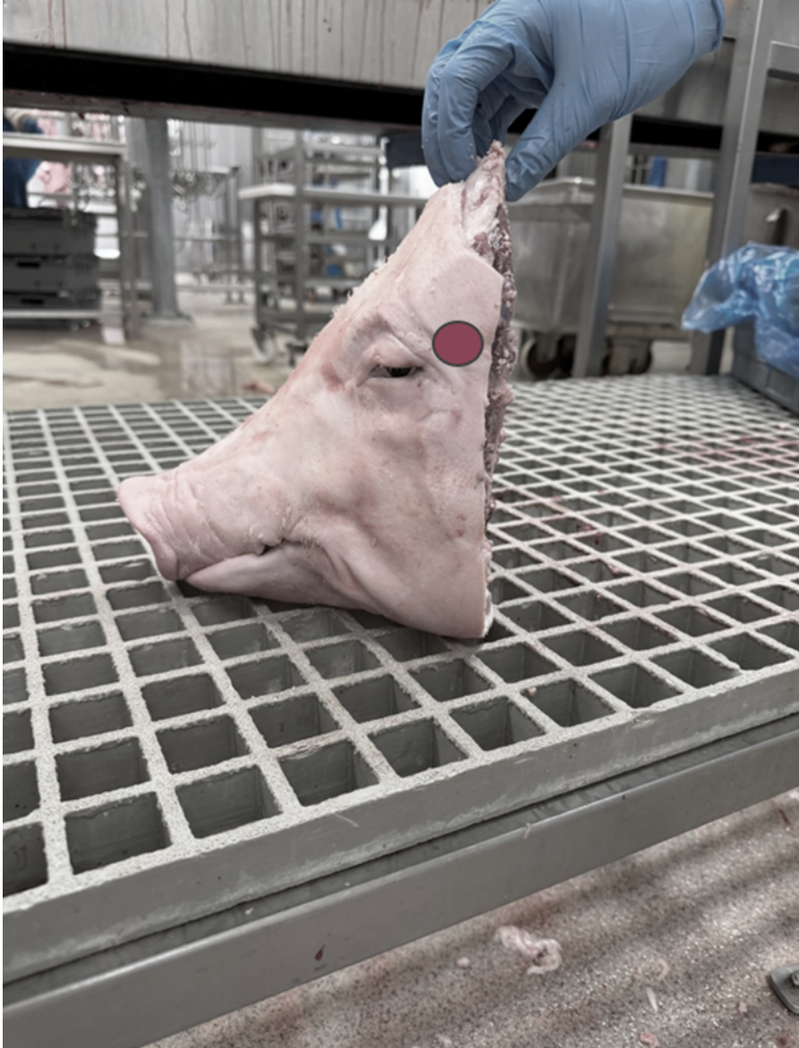
Bild 3. Median klyvning av huvud från slaktgris av normal levandevikt under svenska produktionsförhållanden efter slakt. Bilden visar rekommenderad elektrodplacering vid elbedövning över huvudet, mellan öga och öronbas.