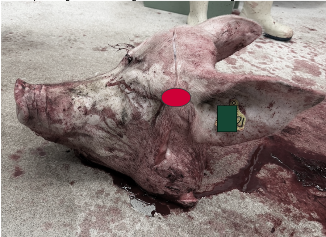
Bild 1. Median klyvning av huvud från Yorkshire sugga (Toppigs Norsvins Z-linje) med 163,9 kg slaktvikt (motsvarar ca 205-220 kg levandevikt baserat på ett 75–80% slaktutbyte) under svenska produktionsförhållanden efter slakt. Bilden visar rekommenderad elektroplacering vid elbedövning över huvudet, mellan öga och öronbas.