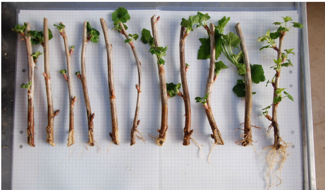
Bild 10: Sårningsbehandlade sticklingar av Ribes nigrum BALSÅRD PETTER ('BRI 9508-3A') från upprepning 1. Sticklingarna är ordnade från höger till vänster efter minst till mest rötter.

På nästan alla sticklingar hann blad slå ut under försöket och vid visuell bedömning motsvarar rotförekomsten i många fall ungefär bladförekomsten, det vill säga de sticklingar som har en kraftig rotning tenderar att ha mer utslagna blad och tvärtom. Rötterna var vita till färgen och fasta i strukturen i samtliga behandlingar, men vissa hade hunnit torka och mörkna en aning vid fototillfället (bild 6-10). Rötternas fördelning kring sticklingen varierar, ibland allsidigt runt hela sticklingen, ibland enbart på två motsatta sidor eller bara en sida.