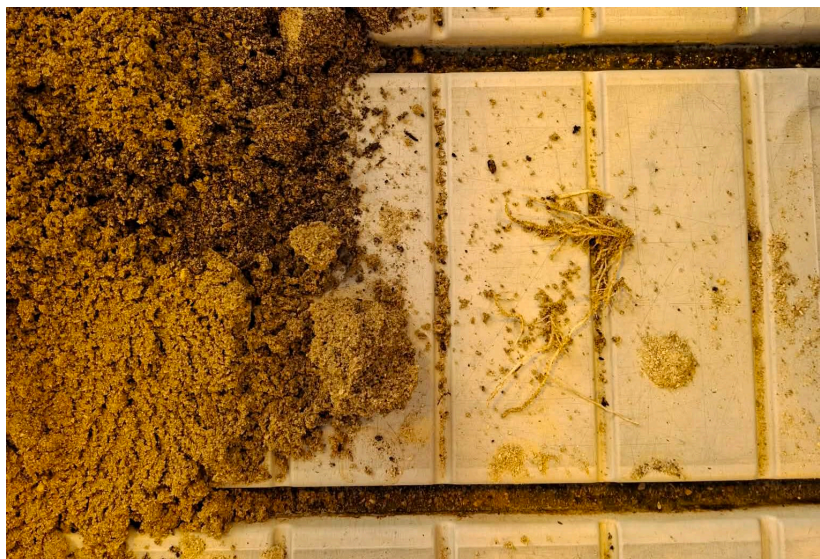
Bild 21: Rötter som lossnat vid upptagning och insamling av resultat.

Antalet rötter kan också ha räknats fel vid mätningen. När osäkerhet uppstod räknades de på nytt, men vid stora antal var det ibland svårt att orientera sig runt sticklingen och hålla koll på vilka rötter som hade räknats.