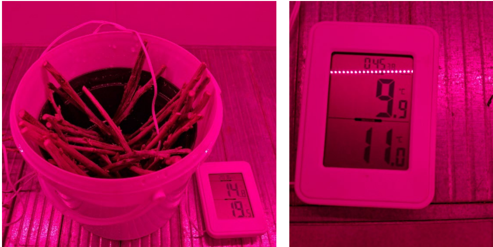
Bild 2: Kallvattenbehandling i vernalisationsrum, tv när de precis ställts in, th efter ett dygn.