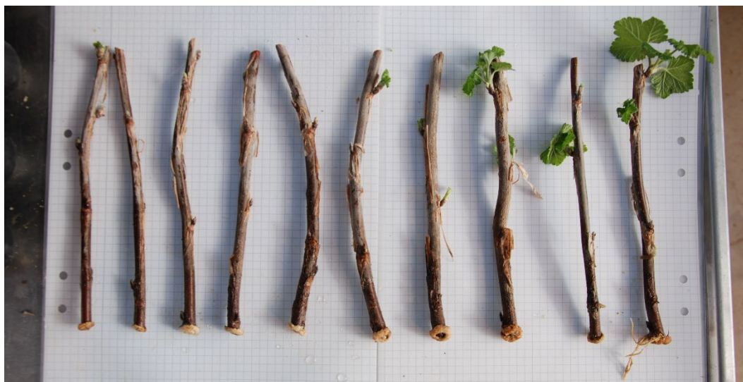
Bild 9: Kontrollbehandlade sticklingar av Ribes (Röda vinbär-Gruppen) 'Gullan' från upprepning 1. Sticklingarna är ordnade från höger till vänster efter minst till mest rötter.