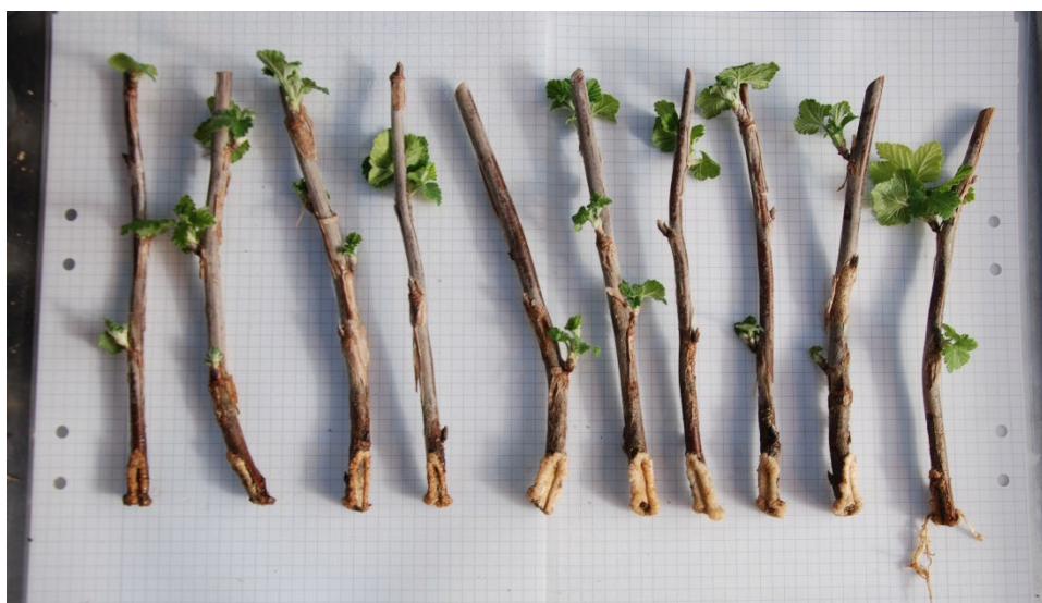
Bild 15: Sårningsbehandlade sticklingar av Ribes (Röda vinbär-Gruppen) 'Gullan' från upprepning 1. Sticklingarna är ordnade från höger till vänster efter minst till mest rötter.

På de flesta av sticklingarna hann blad slå ut under försöket och bladförekomsten var minst i K- och B-behandlingarna. Rötterna var vita till färgen, men vissa hade hunnit torka och mörkna en aning vid fototillfället (bild 11-15). Mängden rötter och mängden blad på samma stickling motsvarar inte varandra i omfattning, de flesta sticklingar hann få blad, men hade ej börjat utveckla rötter.