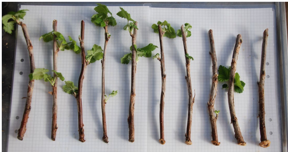
Bild 13: Varmvattenbehandlade sticklingar av Ribes (Röda vinbär-Gruppen) 'Gullan' från upprepning 1. Sticklingarna är ordnade från höger till vänster efter minst till mest rötter.