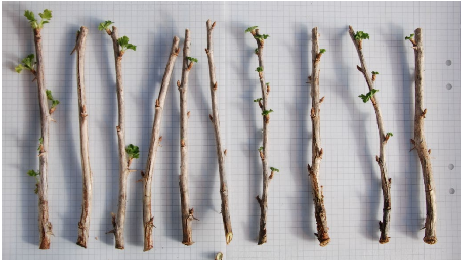
Bild 16: Kontrollbehandlade sticklingar av Ribes (Grossularia-Gruppen) 'Dagmar'. från upprepning 1. Sticklingarna är ordnade från höger till vänster efter minst till mest rötter.