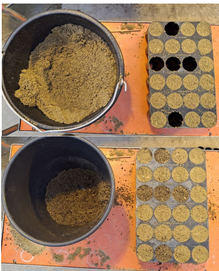
Bild 4: Förbereddelse av brätten till biohumusbehandling.

De celler i brättet som skulle utgöras av behandling B fylldes med en blandning av sand och biohumus i förhållande 1:1. Brätterna fylldes enligt kartorna i Excel som visar vilka sticklingar som skulle hamna var. Först fylldes hela brättet med sand, därefter tömdes de hål som skulle få B-behandling. I en separat hink blandades sand-biohumussubstratet genom att tillföra lika delar av varje komponent och fördela det jämnt. Sticklingarna klipptes och placerades på de celler som var B-behandlade.