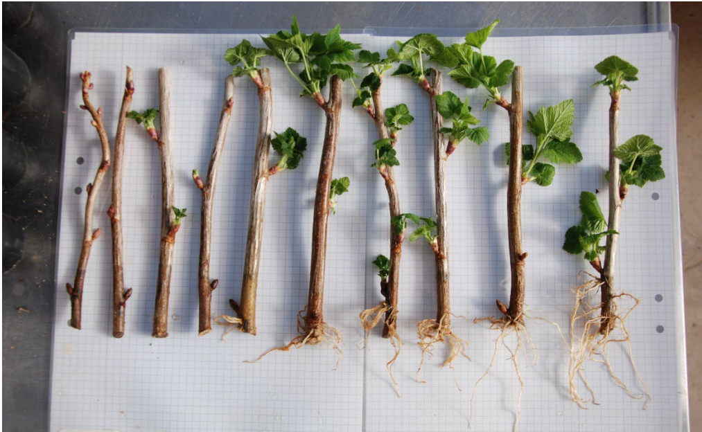
Bild 6: Kontrollbehandlade sticklingar av Ribes nigrum BALSÅRD PETER ('BRI 9508-3A') från upprepning 1. Sticklingarna är ordnade från höger till vänster efter minst till mest rötter.