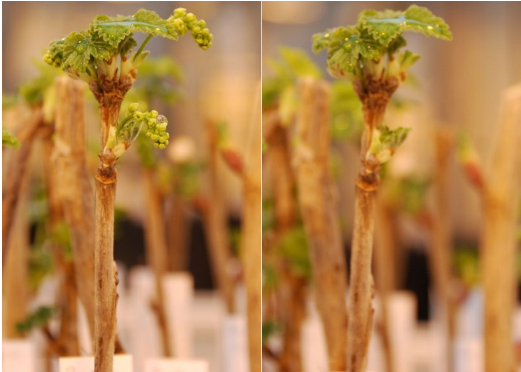
Bild 1: Borttagna blommor på Ribes (Röda vinbär-Gruppen) 'Gullan'.