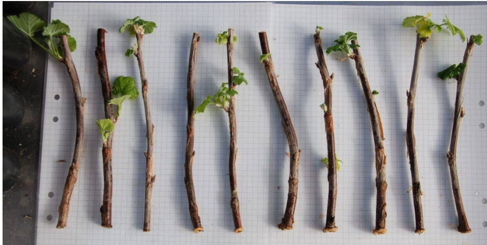
Bild 12: Kallvattenbehandlade sticklingar av Ribes (Röda vinbär-Gruppen) 'Gullan' från upprepning 1. Sticklingarna är ordnade från höger till vänster efter minst till mest rötter.