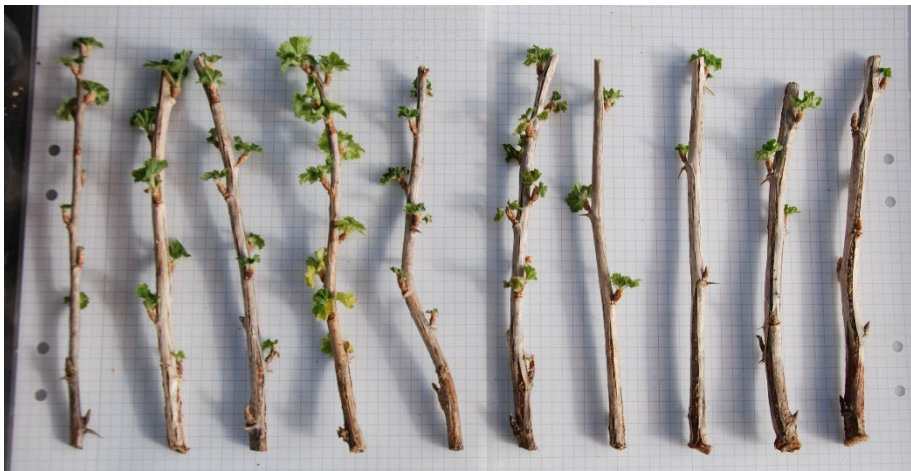
Bild 17: Kallvattenbehandlade sticklingar av Ribes (Grossularia-Gruppen) 'Dagmar'. från upprepning 1. Sticklingarna är ordnade från höger till vänster efter minst till mest rötter.