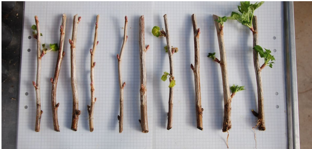
Bild 9: Biohumusbehandlade sticklingar av Ribes nigrum BALSÅRD PETTER ('BRI 9508-3A') från upprepning 1. Sticklingarna är ordnade från höger till vänster efter minst till mest rötter.