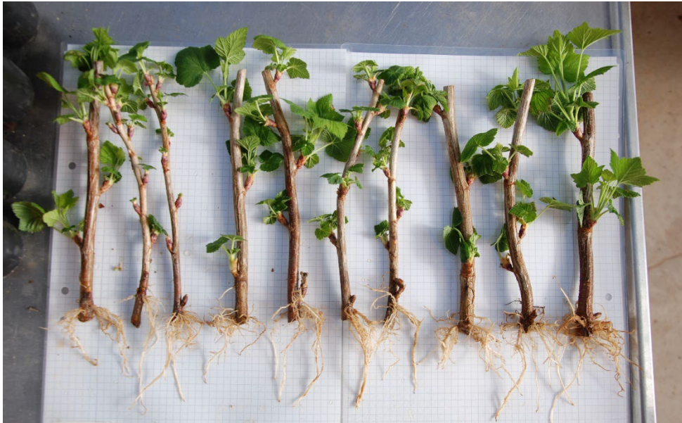
Bild 7: Kallvattenbehandlade sticklingar av Ribes nigrum BALSÅRD PETTER ('BRI 9508-3A') från upprepning 1. Sticklingarna är ordnade från höger till vänster efter minst till mest rötter.