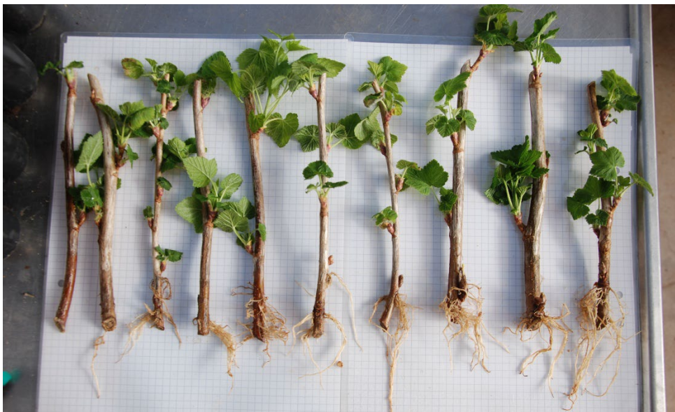
Bild 8: Varmvattenbehandlade sticklingar av Ribes nigrum BALSÅRD PETTER ('BRI 9508-3A') från upprepning 1. Sticklingarna är ordnade från höger till vänster efter minst till mest rötter.