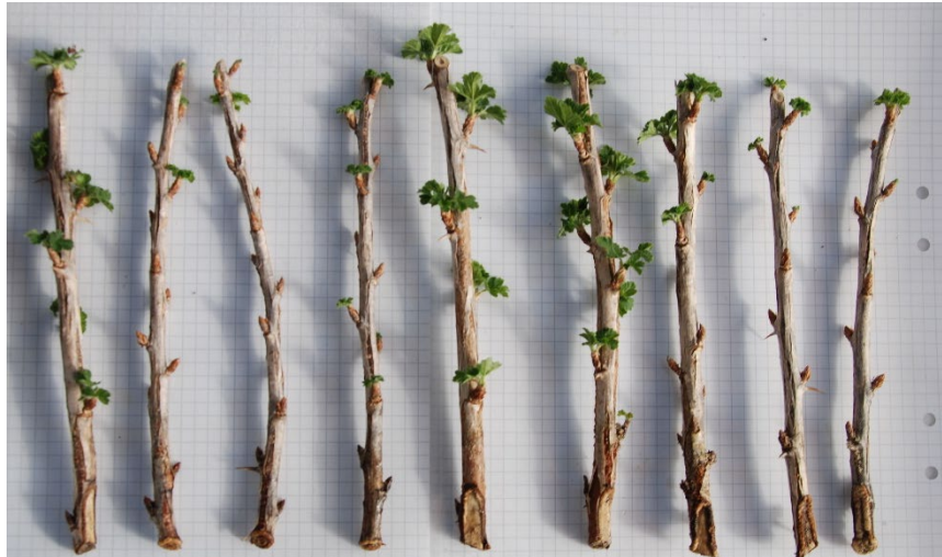
Bild 20: Sårningsbehandlade sticklingar av Ribes (Grossularia-Gruppen) 'Dagmar'. från upprepning 1. Sticklingarna är ordnade från höger till vänster efter minst till mest rötter.

På de flesta av sticklingarna hann blad slå ut under försöket, men förekomsten var låg i K- och B-behandlingarna. De två krusbärssticklingar som hade börjat utveckla en rot var i liknande skick som övriga sticklingar och rötterna var vita i färgen.