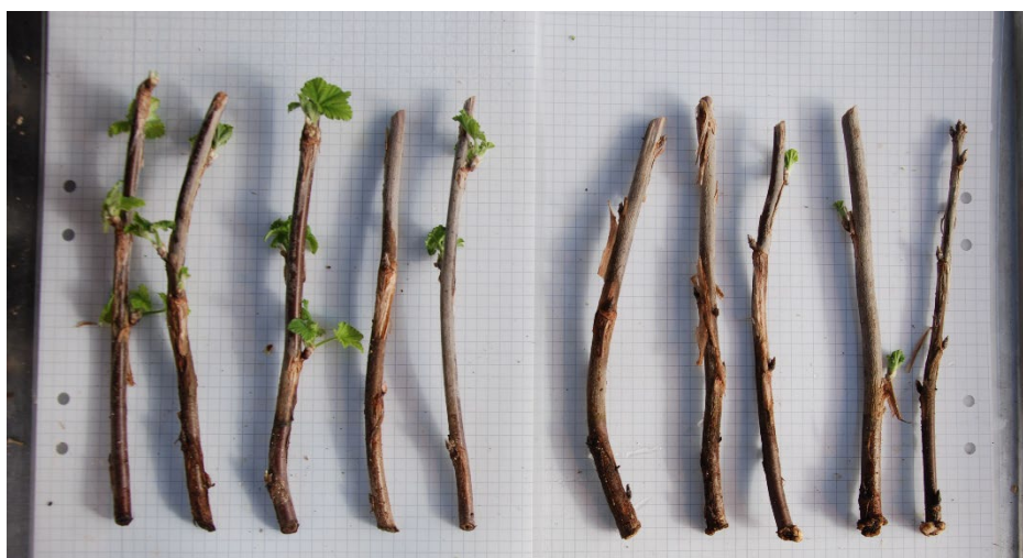
Bild 14: Biohumusbehandlade sticklingar av Ribes (Röda vinbär-Gruppen) 'Gullan' från upprepning 1. Sticklingarna är ordnade från höger till vänster efter minst till mest rötter.