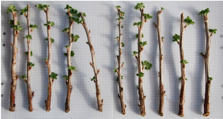
Bild 18: Varmvattenbehandlade sticklingar av Ribes (Grossularia-Gruppen) 'Dagmar'. från upprepning 1. Sticklingarna är ordnade från höger till vänster efter minst till mest rötter.