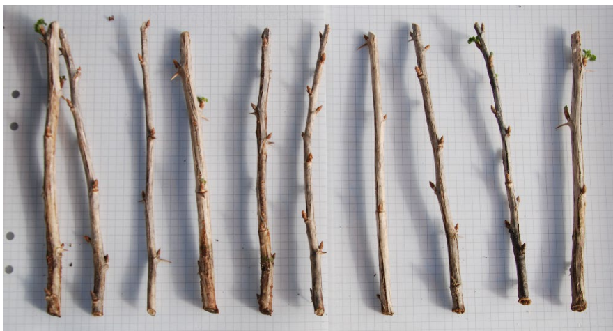
Bild 19: Biohumusbehandlade sticklingar av Ribes (Grossularia-Gruppen) 'Dagmar'. från upprepning 1. Sticklingarna är ordnade från höger till vänster efter minst till mest rötter.