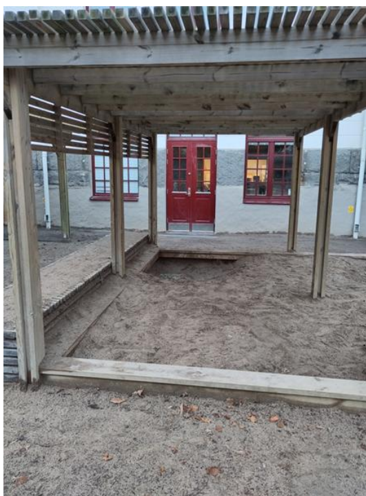
Figur2: Intervjuperson beskriver hur en olyckshändelse leder till kaos när trängsel uppstår i sandlådan.

Personalen beskriver hur en mycket vanlig orsak till konflikter är att ett utrymme blir för litet i relation till antalet elever som då inte kan utföra de aktiviteter de önskar. Det kan även vara att utrymmet endast tillåter en begränsad uppsättning av fasta lekinstallationer eller att många elever vill använda samma del av skolgården samtidigt. Detta medför att trängsel kan uppstå på skolgården eller delar av skolgården. En personal beskriver hur en elev kan råka trampa i en annan elevs bygge i en sandlåda (Fig. 2), hur de blir osams och ett kaos utbryter där de trampar ner ytterligare andra elevers byggen. En personal jämför de olika skolgårdar denne har jobbat på och hur de skiljer sig när det gäller storlek på skolgården och konfliktnivå på denna: