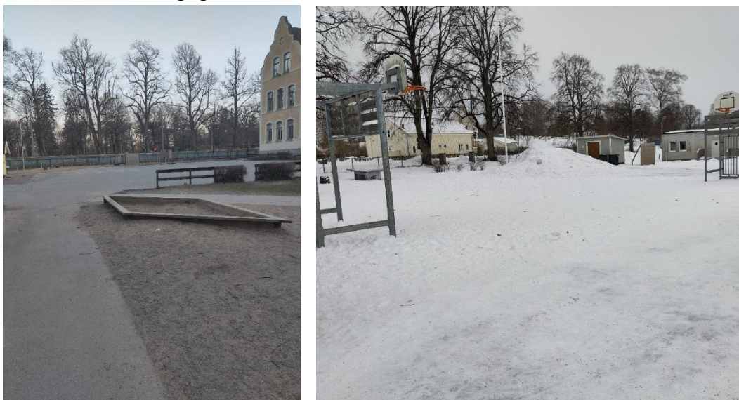
Figur3: Olika basketplaner som används av få elever utgör en öppen yta. Platserna används som genomfartsled till andra platser vilket medför att det ofta är elever och personal på platsen men få konflikter uppstår och de som uppstår uppmärksammas fort av personalen.

Ofta har skolgårdar områden med öppna ytor där personal finns tillgänglig för eleverna och där sällan konflikter uppstår. På vissa är det stora asfaltsytor, ibland med mer variation på underlaget som grus eller gräs, men gemensamt är att det finns ytor för olika lekar och lekutrustning. I dessa områden har eleverna möjlighet att sprida ut sig för olika aktiviteter och även friare umgänge och lek. Personalen har ofta en stark närvaro och upplever sig ha en god överblick, vilket bedöms bidra till den låga konfliktnivå. En personal beskriver en asfaltyta där de vuxna ”patrullerar” och hur få konflikterna det är på platsen. De beskriver hur möjligheten att överblicken gör det lättare att uppmärksamma om något inträffar och att de då kan ingripa.