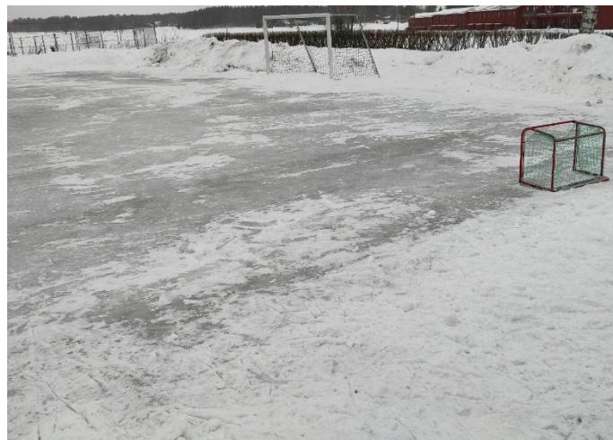
Figur 1: fotbollsplan omgjord till skridskois. Fotbollsplaner är en vanlig plats för konflikter som uppstår i stundens hetta när tävlingskänslan blir stor.

Även snö innebär att aktivitetsutbudet på skolorna förändras. Vissa aktiviteter minskar och nya tillkommer. När snön täcker marken täcks även målade markeringar vilket medför att vissa lekar blir svåra att genomföra. En personal beskriver hur fotbollsspelande helt ändrar karaktär och blir mer lekfullt när det finns snöhögar på planen, eller flyttar från planen till