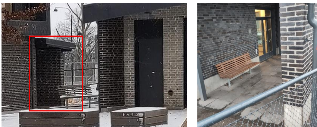
Figur 4: Undanskymd plats där det uppstår många konflikter. Placerad bakom ett sophus/förråd vid entré till slöjdhuset. skymd sikt från flera håll.

”Platsen där man kan gå undan. Det är väl mer att det skulle kunna bli att barn leker där och att det blir en konflikt och att man kanske börjar slåss. Eller att det blir en konflikt att man är elaka mot varandra eller gör någonting där och att det är ingen vuxen som ser det”(Daniel).