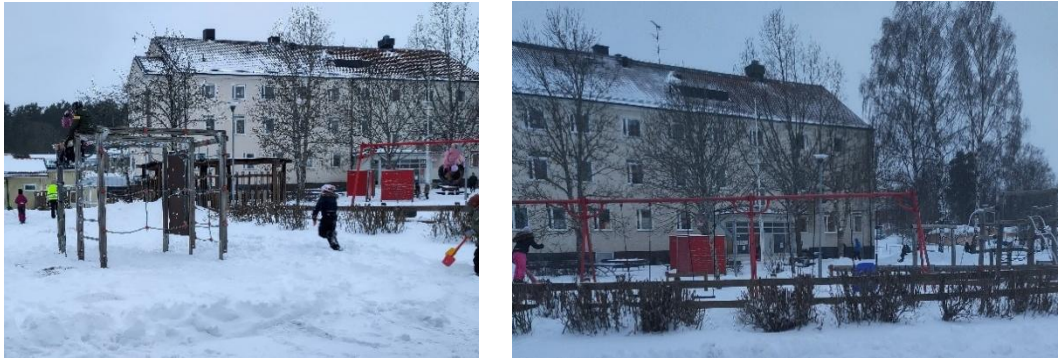
Figur 5: Stor mängd fasta lekinstallationer medför att konkurrensen minskar vilket fungerar som skyddsfaktor mot konflikter.

skulle kunna nyttjas bättre. Det kan till exempel vara utrymmen som saknar aktiviteter som eleverna vill göra. En personal beskriver att på en skolgård med begränsat utrymme har det placerats ut en stor mängd fasta lekinstallationer. Då skolans personal inte har involverats i planeringen har det medfört att rörelsemöjligheten begränsats för eleverna och att önskade aktiviteter inte går att utföra då det fysiska utrymmet saknas.