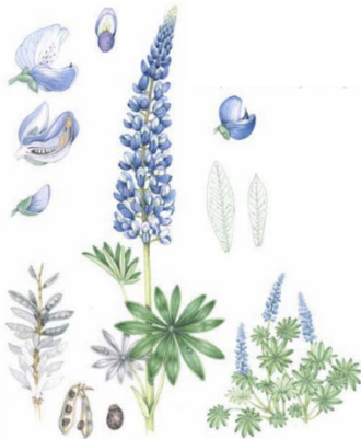
Figur 3. Illustration av blomsterlupin av Lizzie Harper (FOR u.åa). Bilden är beskuren från originalet.

Blomsterlupin är 50–120 centimeter hög med lansettlika småblad och blommor som sitter samlade i en lång klase med varierande längd (figur 3). Blomfärgerna är oftast blå eller rosa, medan vita och violetta former förekommer mer sällan (Naturvårdsverket u.å.). Blomning sker mellan juni och augusti. Arten återfinns främst längs infrastruktur, såsom vägkanter och järnvägar, samt på öppna ruderatmarker (Mossberg & Stenberg 2018). Bekämpning av blomsterlupin sker genom att hela plantan grävs upp, inklusive pålrot och birötter. Växtdelarna läggs i en återförslutbar påse och lämnas som brännbart avfall på återvinningscentral. Vid större bestånd kan blomställningarna klippas bort innan frökapslar bildas, oftast i juni–juli, och även detta avfall ska hanteras på samma sätt (Naturskyddsföreningen 2024).