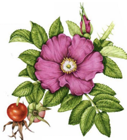
Figur 8. Illustration av vresros av Lizzie Harper (FOR u.åd). Bilden är beskuren från originalet.

SLU Artdatabanken (2025a) beskriver vresrosen som ”bedöms ha en mycket hög invasionspotential”. Arten finns i dagsläget i hela Sverige, främst i kustområden där den skapar stora täta bestånd och konkurrerar ut inhemsk flora (SLU 2025a). Vresrosen klassificeras som en av de mest invasiva arterna i Europa (Woch m.fl 2023). Arten finns främst längs kusterna vid Östersjön, Nordsjön, Atlanten samt norra Europa och Nordamerika (Bruun 2006). Den rena arten av vresros saluförs fortfarande, i största mån är det dock mer eller mindre sterila namnsorter som florerar på marknaden (SLU 2025a).