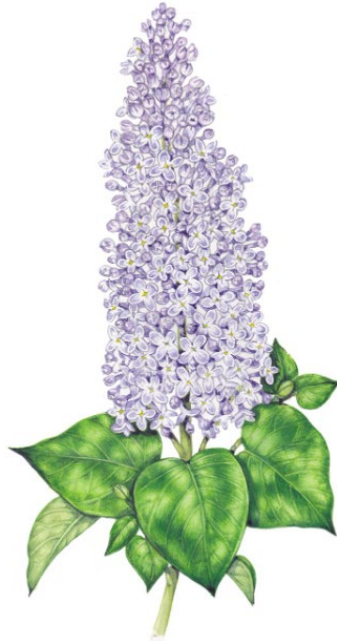
Figur 6. Illustration av syren av Lizzie Harper (Harper u.åb).

låg placerade (Arnold Arboretum 1928). Trots ett varningens finger kring artens invasionspotential under längre tid, publiceras nutida reportage om syrenen (Holmes 2026).