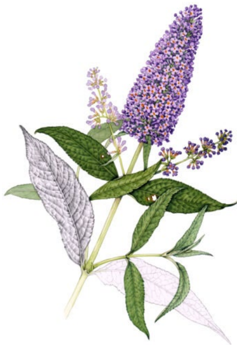
Figur 7. Illustration av syrenbuddleja av Lizzie Harper (FOR u.åc). Bilden är beskuren från originalet.

SLU Artdatabanken (2025a) beskriver syrenbuddlejans utveckling inom de närmsta tio åren som en risk för ”hög invasionspotential” samt ”tolererar många typer av miljöförhållanden, har effektiv fröproduktion, växer snabbt och har en kort period från frögroning till fröproduktion”. I nordvästra och nordöstra USA, Kanada, Nya Zeeland och i centrala Europa finns ett dokumenterat problem kring syrenbuddlejan (Ebeling & Tallent-Halsell 2025).