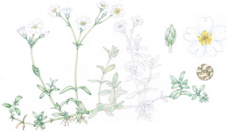
Figur 5. Illustration av silverarv av Lizzie Harper (FOR u.åb). Bilden är beskuren från originalet.

korsbefruktning mellan olika kloner för frösättning, den resulterande avkomman kan därefter producera rikligt med frön (Andersson & Gunnarsson 2024). SLU Artdatabanken (2025a) beskriver silverarven som ”bedöms ha en hög invasionspotential även om den till stor del är beroende av människan” samt ”bildar täta mattor med hjälp av klonal spridning”.