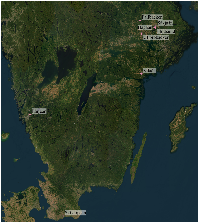
Figur 1. Karta över provtagningsplatserna. Kartdata: ©OpenStreetMap

Studien är baserad på data som samlats in av institutionen för vatten och miljö vid SLU inom ramen för olika projekt. Data inkluderar från fyra månader till dryga åtta år långa tidsserier av mätningar från åtta svenska vattendrag, se Figur 1 och Tabell 1. Fem av de åtta provtagningsplatserna är lokaliserade i Uppland med Hågaån, Sävjaån och Flottsund (Fyrisåns utlopp) i närheten av Uppsala, samt med Ullbrobäcken utanför Enköping och Fallbäcken i Heby kommun. Utöver dessa platser är Kilaån i Nyköping, Lärjeån utanför Göteborg och Skivarpsån i Skurups kommun med i undersökningen. Flera av provtagningsplatser har varit del av projekt som undersökt påverkan på vattendrag i jordbrukslandskap och andelen jordbruksmark i respektive vattendrags avrinningsområde finns angivet i Tabell 1. Lutningen är beräknad utifrån punkter 50 m uppströms och nedströms från sonden.