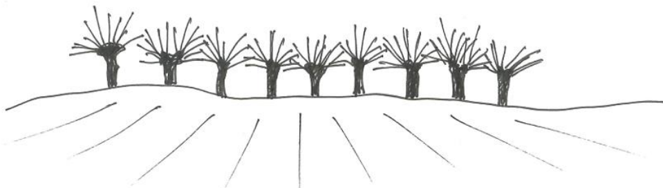
Figur 2. Pilevallar utgör ett skånskt kulturarv i odlingslandskapet.

Forman och Baudry (1984) skriver att ved är en av de viktigaste produkterna från häckar i odlingslandskapet och de framhäver att denna källa till energi är särskilt viktig under kristider. Blanco et al. (2020) visar att 17 av 19 intervjuade lantbrukare i Frankrike nämner ved som en ett positivt bidrag från träd i odlingslandskap, däremot menar de att trädens betydelse som vedresurs minskat under senare år till följd av förändrade uppvärmningstekniker. I samma studie framgår även att träd och buskar i odlingslandskap i allt mindre utsträckning används till hantverk och föda jämfört med tidigare (Blanco et al. 2021). Vidare menar författarna att vegetationen bidrar till habitat för jaktbart vilt samt att de intervjuade lantbrukarna gärna sparar fruktträd, antingen för egen skörd eller för att främja fåglar och pollinatörer (ibid.).