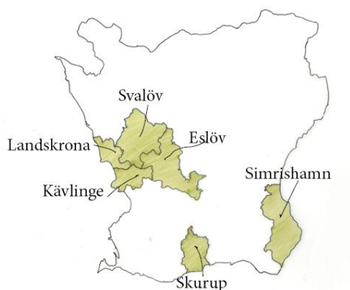
Figur 1. Karta över kommuner där intervjuerna är aktiva.

Intervjupersonerna har valts ut för att de är verksamma inom det geografiskt avgränsade området för frågeställningen. Intervjuerna har ägt rum hos intervjupersonerna i två av fallen för att ge författarna en översiktlig förståelse för det omgivande landskapet intervjupersonen jobbar i. En av intervjuerna utfördes via Teams då platsintervju ej var möjlig. Intervjupersonerna har verksamhet i Skurup, Simrishamn, Kävlinge, Landskrona, Eslöv och Svalövs kommun (Figur 1). Anledningen till att antalet kommuner är fler än antalet intervjupersoner beror på att en av lantbrukarna har mark i fyra olika kommuner. Intervjuerna sammanställs i en kvalitativ analys där synpunkter från de olika intervjupersonerna sammanfattas och jämförs (Lantz 1993).