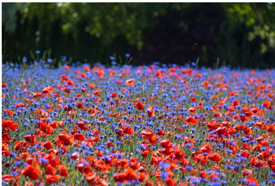
Figur 2. Ettårig blomsterplantering innehållande kornvallmo ( Papaver rhoeas ) och blåklint ( Centaurea cyanus ) (Nilsson 2016) CC BY-SA 2.0.

Till skillnad från slätterängen innehåller den ettåriga blomsterplanteringen i stället annueller, ettåriga åkerogräs (se figur 2). Detta växtval är lämpligt för ytor som är näringsrika, öppna, plana samt lätta att bearbeta (Runesson 2020). De annuella blomstertyorna kan bestå av både inhemska och exotiska växter, bland vilka kornvallmo ( Papaver rhoeas ), blåklint ( Centaurea cyanus ), klätt ( Agrostemma githago ), åkerkulla ( Anthemis arvensis ), gullkrage ( Chrysanthemum segetum ), sömntuta ( Eschscholzia californica ), lin ( Linum usitatissimum ), tigeröga ( Coreopsis tinctoria ) och ringblomma ( Calendula officinalis ) är vanligast (Ignatieva 2017).