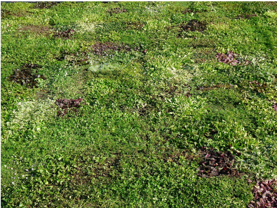
Figur 5. Nyklippt örtmatta