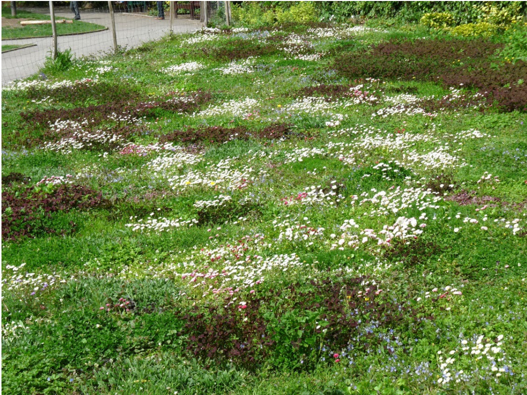
Figur 4. Örtmatta i Avondale Park London