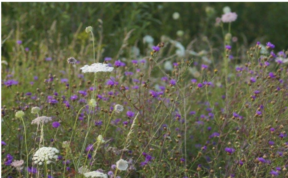
Figur 1. Slätteräng (Stöckel u.å.) CC0.

En slätteräng är en artrik vegetationstyp som tillhandahåller flera viktiga ekosystemtjänster, däribland främjande av biologisk mångfald och pollinatörer, samt stärkande av kulturhistoriska värden (Boverket 2021). Slätterängar är särskilt lämpade för näringsfattiga, väl-dränerade jordar i soliga lägen (Arvidsson et al. 2017). Ängens skötsel begränsas till slåtter en gång per år, vilket medför ett lägre underhållsbehov än gräsmattor (Persson & Smith 2014). Enligt Ignatieva (2017) är prästkrage ( Leucanthemum vulgare ), gulmåra ( Galium verum ), blåklint ( Centaurea scabiosa ), svartklint ( Centaurea nigra ), äkta johannesört ( Hypericum perforatum ), åkervädd ( Knautia arvensis ), röllika ( Achillea millefolium ), gökblomster ( Lychnis flos-cuculi ), brudbröd ( Filipendula vulgaris ) och gullviva ( Primula veris ) bland de vanligaste arterna i svenska ängar (se figur 1).