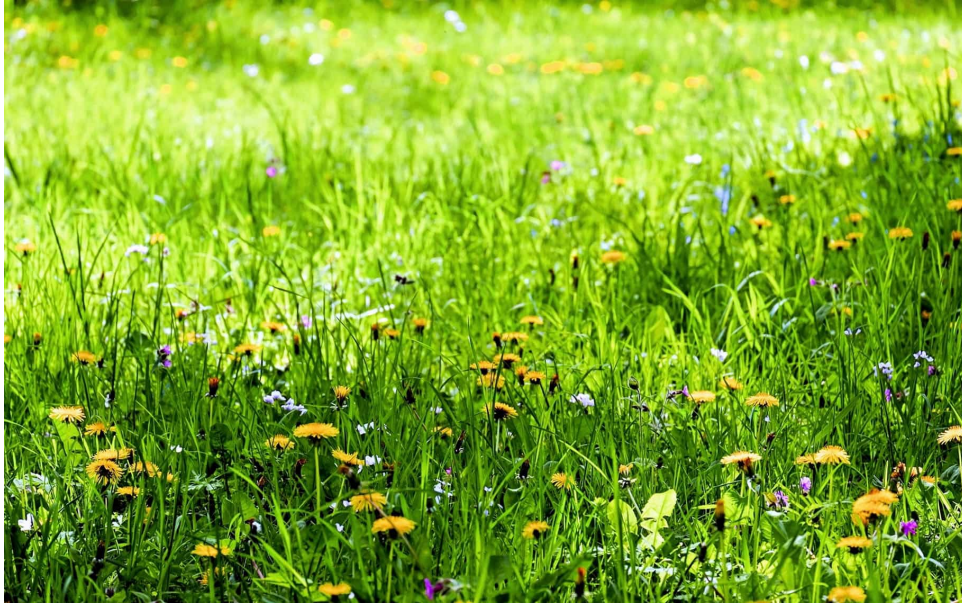
Figur 3. Förvildad gräsmatta: gräs med inblandning av exempelvis maskros ( Taraxacum officinale ) och vitklöver ( Trifolium repens ) (Couleur 2017) CC0.