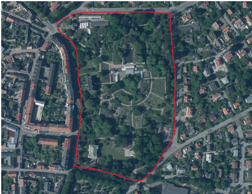
Figur 3. Botaniska trädgården, röd linje avser områdesgräns under studien. Satellitbild (Lantmäteriet, 2026c).

Botaniska trädgården ligger i centrala Lund, strax öster om stadskärnan. Botaniska trädgården grundades år 1690 och drivs av Lunds universitet (Lunds universitet, 2025). Området är runt 8 hektar och gränsar mot villaområden i norr och öster. I söder ligger en kyrkogård och i väst lägenhetshus på 5 våningar. Botaniska trädgården har tre byggnader dedikerade till studie, undervisning och forskning, 1 växthus, 1 café och förrådsbyggnader i de nordvästra delarna. Det finns också en liten damm.