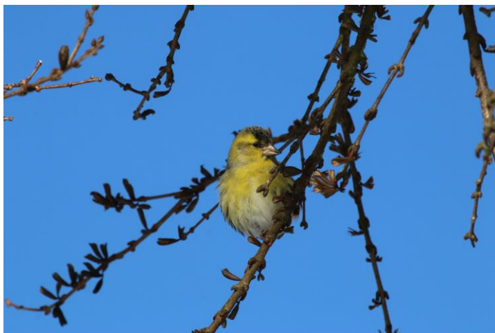
Figur 15. Grönsiska äter av frön på en katsura.

Arter som är starkt knutna till förekomsten av träd med frön och nötter, var på platsen steglits (se figur 14), domherre, grönsiska (se figur 15) och stenkäck. Stenkäck var den art med flest antal individer inom denna grupp och dessa sågs ofta sitta högt upp i stora träd. De observerades också