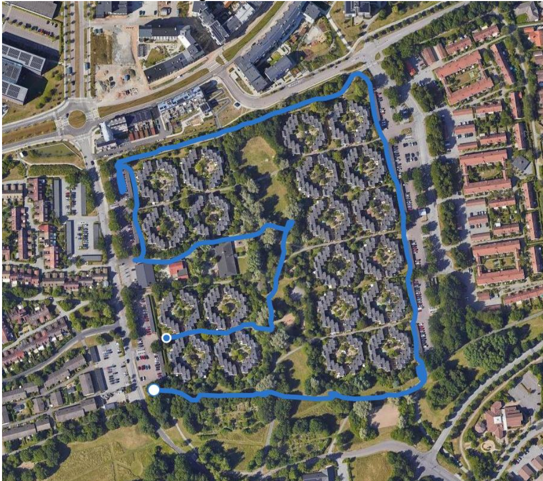
Figur 5. Standarddrutt för Djingis Khan. Satellitbild (Lantmäteriet, 2026e).

De datum (med temperatur, väder och tid) som Botaniska trädgården besöktes var: