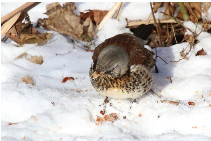
Figur 12. Björktrast äter äpplen som fallit ner på marken.

Av fågelarter som är beroende av förekomst av frukt och bär återfanns med en art, björktrast. Djingis Khan var det enda område i studien med björktrast (se figur 12) och dessa påträffades alltid i direkt anslutning till fruktträd (äppelträd) med