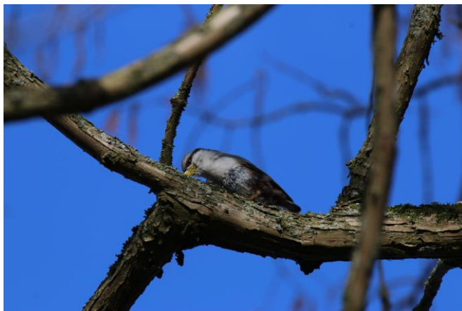
Figur 21. Nötväcka födosöker på och under barken i ett lövträd.

och ask (både inhemska och exotiska arter). Stenknäck sågs vid samtliga observationstillfällen och var en av de vanligare arterna i stadsparken och de visade en stark preferens för höga lövträd som bok och ek, men sågs även ofta i idegran.