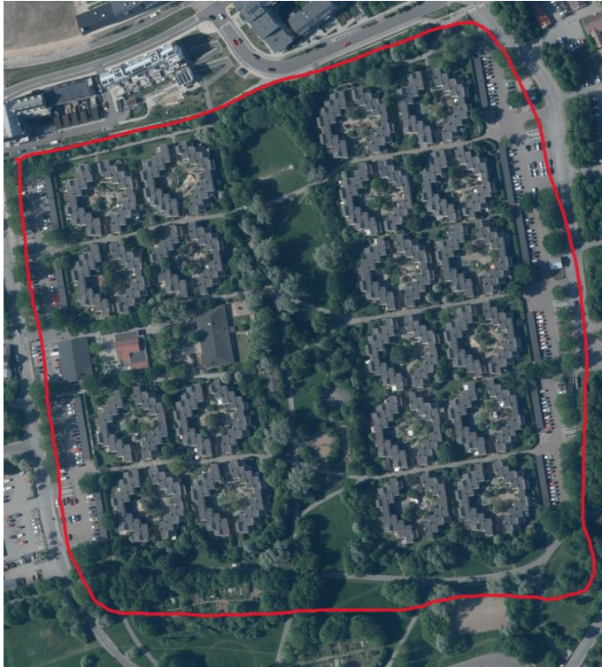
Figur 2. Djingis Khan, röd linje avser områdesgräns under studien. Satellitbild (Lantmäteriet, 2026b).

Djingis Khan är ett bostadsområde på ca 10,5 hektar på Östra Torn, Lund. Djingis Khan byggdes 1971–1972 och var innan dess åkermark (Wedin, 1995). Djingis Khan gränsar mot andra bostadsområden i väster, öster och norr. I söder ligger det kolonilotter, hästgårdar och grönytor med varierande gräsmattor och träd med sly. Djingis Khan är uppdelad i 8 bostadskomplex som omgärdar sin egen innergård och med trädgårdar emellan byggnaderna som i sin tur inramas av buskar och häckar. I mitten av området ligger Bananparken där det finns en lekplats, öppna gräsytor och grupperingar av träd och buskar. Det finns även ett dagis och en livsmedelsbutik i de västra delarna av området och stora parkeringar med planterade rader av ekar i både öster och väster. I norr och söder finns det låga vallar med buskar och träd. Vegetationen på platsen är anpassad för att skydda mot insyn, vind och ge olika upplevelsevärden.