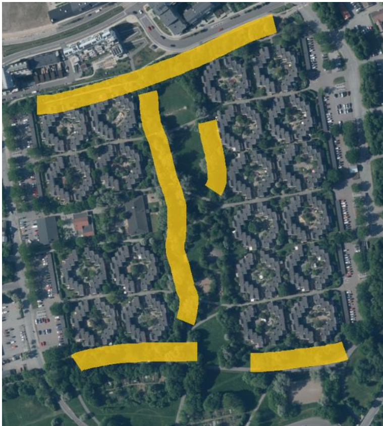
Figur 8. Platser med högst artdiversitet och antal fåglar markerade med gula fält. Djingis Khan. Satellitbild (Lantmäteriet, 2026h).

De okulära resultaten från Djingis Khan visar på ett stort antal småfåglar över en stor del av området. Artrikedomen var stor där antalet fågelarter var i genomsnitt 16,4 per dag. Under de 5 observationsfällena så återfanns alltid ett stort antal individer av småfåglar, både på marken, i buskskikt och trädskiktet.