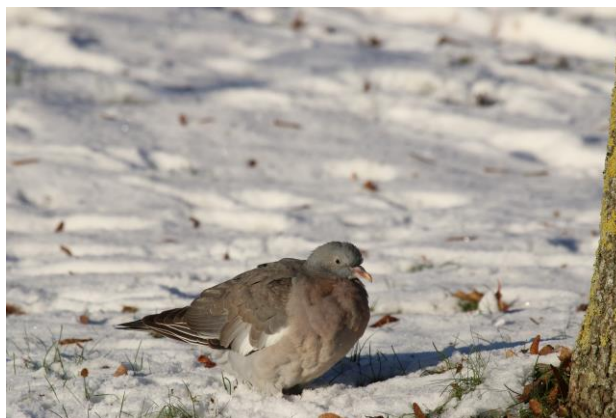
Figur 22. Ringduva födosöker på marken.

Arter som födosöker på eller nära marken var i Stadsparken gärdsmyg, koltrast, råka, kaja, kråka och ringduva (se figur 22). Gärdsmygen sågs i parkens sydöstra del och främst bland buskage eller håligheter i sprucken bark på gamla träd av lind. Koltrast sågs mest födosöka i parkens centrala delar, under idegran och i täta buskage där det hade ansamlat mycket löv.