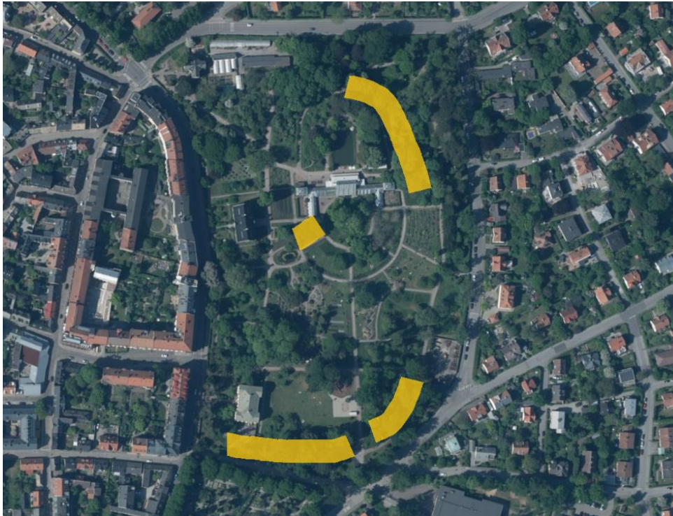
Figur 13. Platser med högst artdiversitet och antal fåglar markerade med gula fält. Botaniska trädgården. Satellitbild, (Lantmäteriet, 2026i).

Resultaten från observationerna antyder på en lägre mängd individer av fåglar i Botaniska trädgården jämfört med de båda andra platserna. Botaniska upplevdes som tyst vad gäller fågelläten och antalet småfåglar som sågs var få, speciellt fåglar som födosöker på marken var väldigt få. Området överlag har begränsat med lövfällande buskskikt och få tät buskage. Dock finns det ett rikt trädskikt med både barr- och lövträd. De platser som hade högst artdiversitet och antal individer (se figur 13) var de delar med flest skikt i vegetationen, löv och annat växtmaterial kvar på marken, gamla träd och träd som gav frön. Antalet fågelarter var i genomsnitt vid varje observationstillfälle 14,4.