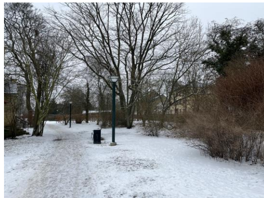
Figur 19. Vegetationsstruktur som lockade ett stort antal småfåglar.

I de delar av parken där de flesta fåglarna sågs var det gott om fågelsång och rörelse, främst i buskskiktet, men även på marken där löv och annat växtmaterial fått ligga kvar, samt uppe i trädkronorna. Ytor med mycket buskar och speciellt täta buskage hade oftast fler individer av småfåglar, oavsett om det var inhemska eller exotiska buskarter. Dock föredrog fler fågelarter lövfällande buskar före städsegröna. Det fanns gott om arter (stenknäck, större hackspett, trädkrypare och nötväcka) som gav rörelse och liv i trädskiktet. Antalet fågelarter var i genomsnitt per observationstillfälle 17,4.