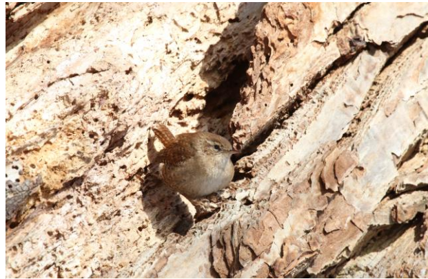
Figur 16. Gärdsmyg födosöker i barken på en kaukasisk vingnöt.

Kattuggla observerades 4 av dagarna och varje gång använde den svarttall ( Pinus nigra ) medan den vilade (se figur 17).