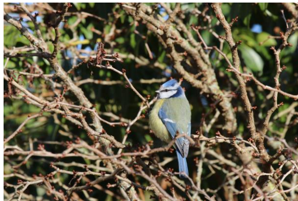
Figur 20. Blåmes födosöker bland knoppar i en lövfällande buske.

Talgoxe sågs i hela parken. Flest individer förekom i den nordöstra delen runt observatoriet. Där noterades dem mest i buskskiktet på både inhemska buskar som hassel som exotiska buskar. En andel talgoxar sågs också bland idegranarna i de västra delarna av parken där de födosökte på den snöfria marken under dem, då resten av området var täckt med snö. Buskarna som löpte längs med ett dike väster om stadsvallen var också populärt och bildade ett sammanhängande stråk.