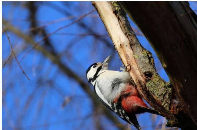
Figur 11. Större hackspett på vitpil.

Fågelarter som födosöker ryggradslösa djur i och på träd på Djingis Khan var större hackspett (se figur 11) och trädkrypare. Under inventeringarna observerades en hona av större hackspett vid två av observationstillfällena. För båda var vitpil det mest frekvent besökta trädet, speciellt de träd med döda grenar uppskattades av större hackspetten. Båda arterna observerades dessutom på betydligt mindre träd och i buskar. Ingen preferens för inhemskt eller exotiskt kunde konstateras.