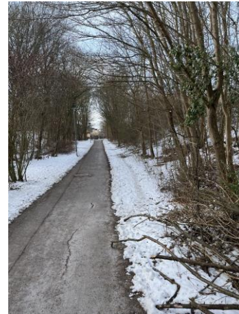
Figur 9. Den miljö där flest observationer av småfåglar gjordes under studien.

Grönfink är också en fröspecialist, men sågs ej födosöka på vegetationen på området.