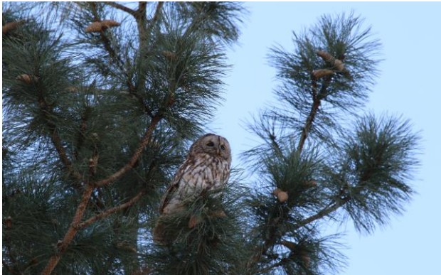
Figur 17. Kattuggla använder tall för vila och att spana ifrån.

födosökte på marken, vid basen av träd eller på öppna gräsytor. De använde mest höga träd för att vila eller spana ifrån.