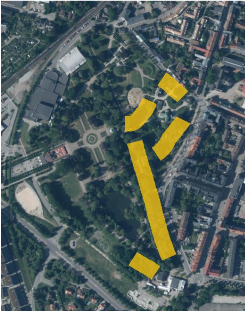
Figur 18. Platser med högst artdiversitet och antal fåglar markerade med gula fält. Stadsparken. Satellitbild (Lantmäteriet, 2026j).

Resultaten från Stadsparken visar att det finns en stor artrikedom och en variation av olika grupper av fåglar. Intrycket var att Stadsparken är ett område med stora kontraster gällande hur rikt fågellivet är mellan de olika delarna av parken. De östra delarna av Stadsparken (se figur 18) hade den största mängden arter och antal fåglar, främst småfåglar, medan de västra delarna var betydligt tystare och där gjordes färre observationer. Förändringen kunde också ske snabbt då habitaterna hade skarpa gränser i vissa delar av parken. Det finns områden med