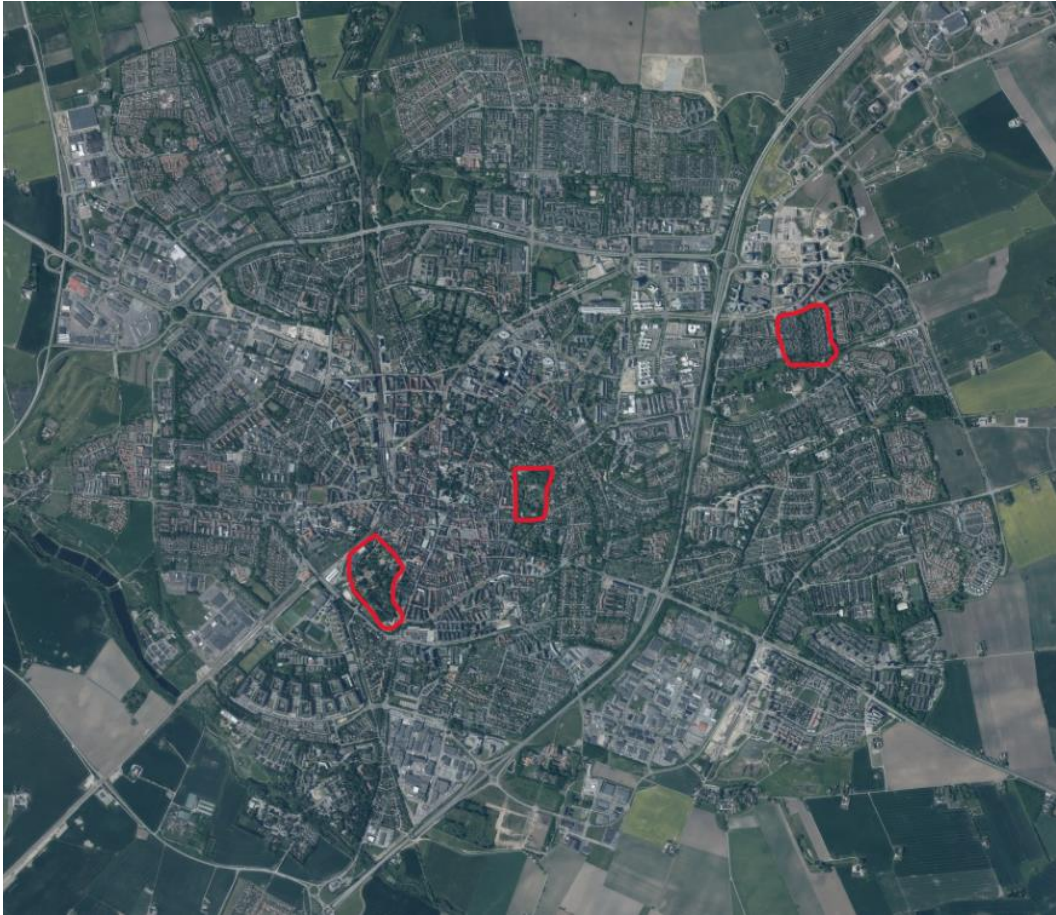
Figur 1. Karta över Lund med områdena utmarkerade. Från höger till vänster: Djingis Khan, Botaniska trädgården och Stadsparken. Satellitbild (Lantmäteriet, 2026a).

Områdena som valts är Djingis Khan, Botaniska trädgården och Stadsparken, samtliga i Lund stad. De har valts utifrån det faktum att det finns inrapporterade häckningar av talgoxe och blåmes på artportalen.se. Dessa är också grönområden vars vegetation har distinkta kvalitéer och funktioner från varandra. Områdena är också satta i olika typer av en urban kontext, samtliga med mänsklig närvaro på platsen under stora delar av dygnet. Enligt medborgardata inrapporterad på eBird av Cornell University är Botaniska trädgården det område med flest inrapporterade arter sammanlagt med 106 arter, medan Stadsparken har 73 arter inrapporterade. Djingis Khan saknar data på eBird.