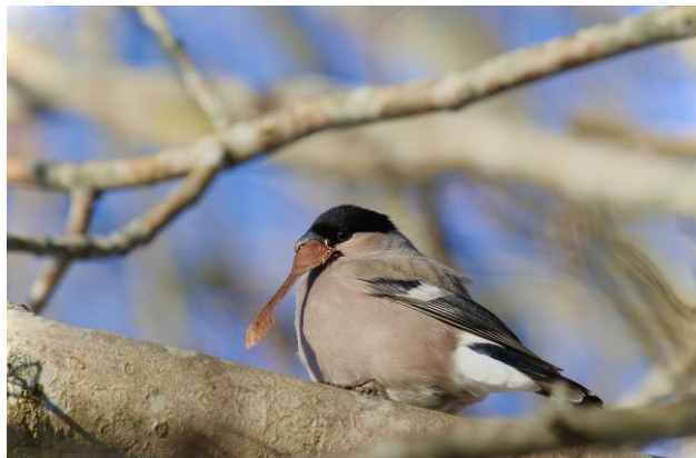
Figur 10. Domherre äter näsa från en lönn.