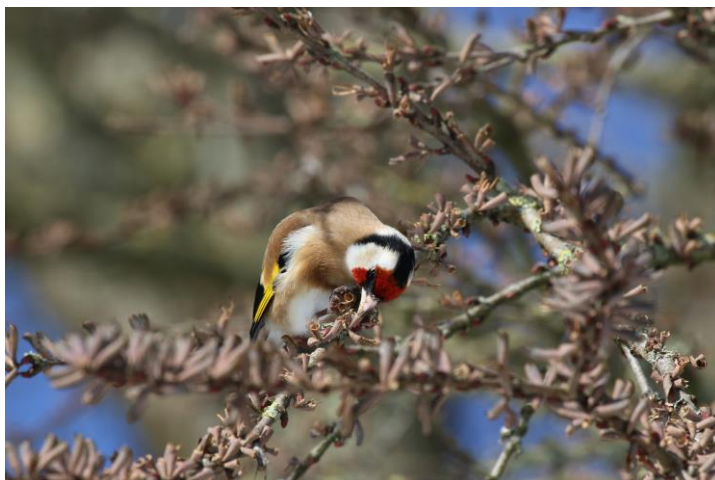
Figur 14. Steglits äter av frön på katsura.

Talgoxen visade liknande preferenser som blåmes och förekom främst i den södra delen, centrala, östra, och även vid partier av idegran utspridda i parken.