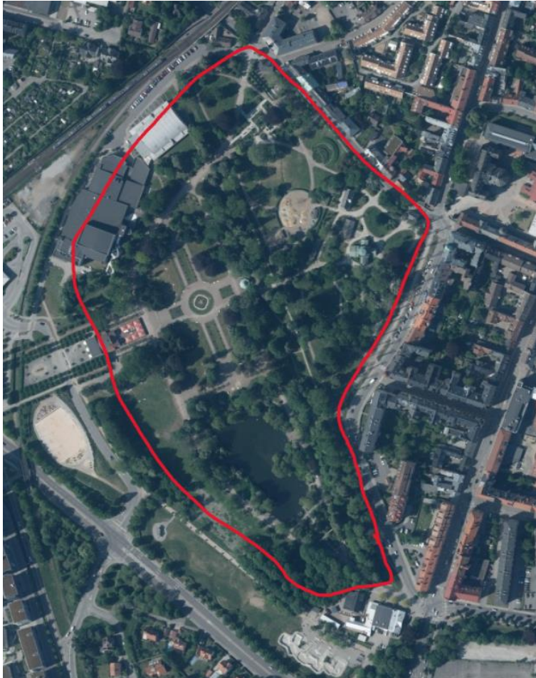
Figur 4. Stadsparken, röd linje avser områdesgräns under studien. Satellitbild, (Lantmäteriet, 2026d).

Stadsparken är en allmän park med en yta på 19 hektar belägen strax söder om centralstationen. I norr och öster gränsar stadsparken mot lägenhetshus och i söder mot en större gata. Väster om stadsparken går järnvägen. I stadsparken finns 1 badhus, 1 café, 1 scen, 1 fågeldamm, 1 nöjeslokal, 1 lekplats, 3 byggnader för utbildning och forskning, offentliga toaletter och förrådsbyggnader (Swedish gardens, u.å.). Genom parken går också den gamla stadsvallen. Vegetationen på platsen är varierad med öppna gräsytor, områden med sly, alléer, blomsterrabatter och solitära träd. Utmärkande är dock andelen gamla stora träd som har varit med att bidra till att stadsparken är ett Natura 2000-område då hålträdsklokrypare finns på platsen (ibid).