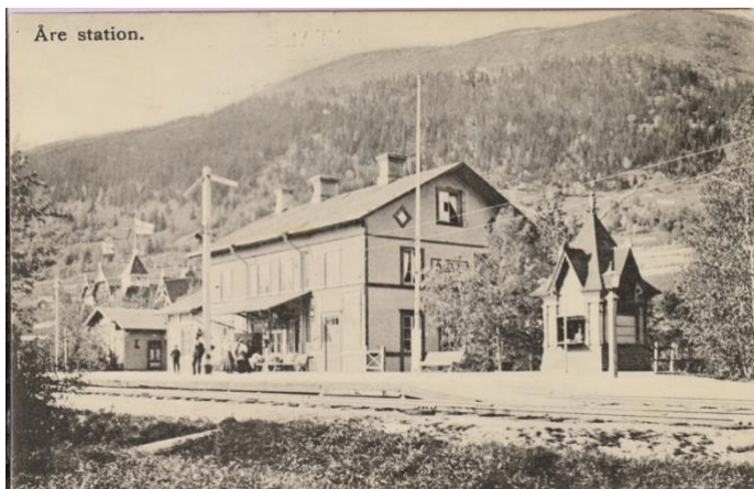
Figur 8. Åre stationshus med Åreskutan i bakgrunden. (Föreningen gamla Östersund) Vykort från första halvan av 1900-talet. CC BY-NC 4.0