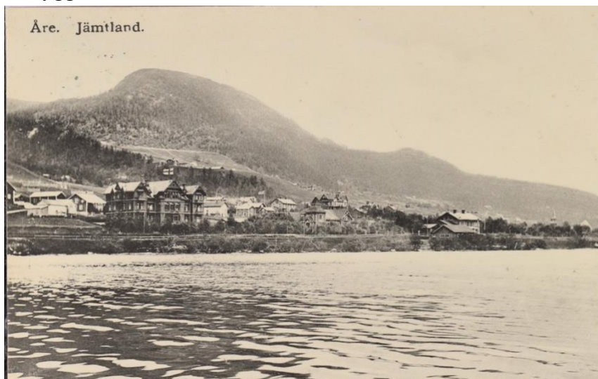
Figur 6. Vy från Åresjön österut (Föreningen gamla Östersund) Vykort från första halvan av 1900-talet. CC BY-NC 4.0

närmst sjön i figur 6 och även i figur 7 där byggnaden idag är renoverad och omgjord till lägenheter. Bebyggelsen berättar om ortens pågående skifte från jordbruksort till turistort (Loock, 2009) och förstärks ännu mer idag då hotell Holiday Club uppförts närmst sjön och skymmer bland annat det gamla stationshuset som syns till höger i figur 6. Utan tecken på jordbruket eller synliga liftsystem/skidbackar förloras ett tydligt sammanhang i landskapsbilden som är som tydligast i figur 1. Dagens större och högre bebyggelse blockerar bakomliggande landskap och kan upplevas som en störning för landskapsbilden. Bebyggelsestrukturen distanserar betraktaren från de rumsbildande landformerna.