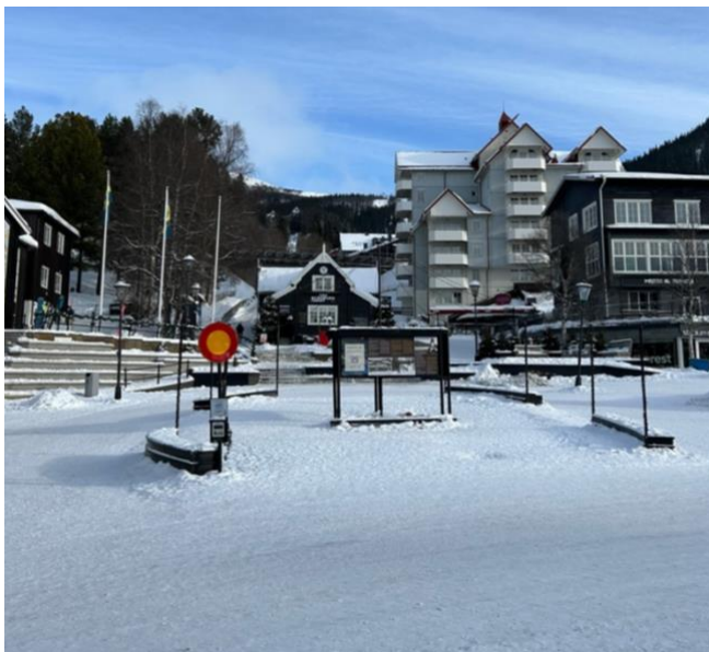
Figur 15. Åre torg och bergbanan. Ville Risborn (2026)