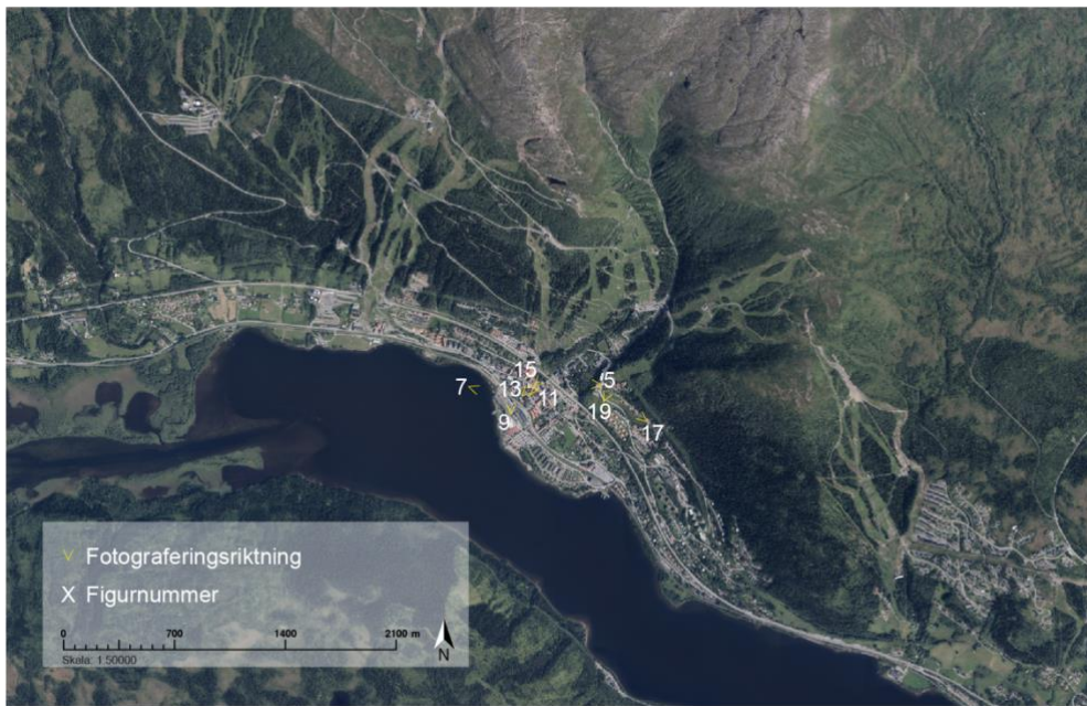
Figur 3. Karta med markerade fotograferingsplatser. Ville Risborn (2026).