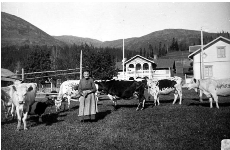
Figur 18. Gårdsmiljö med boskap. (Nils Thomasson) Tidigt 1900-tal. CC BY-NC-ND 4.0

Fortsatt ser vi i figur 18 och 19 ett exempel på en gårdsbyggnad som finns kvar i utkanten av Tottens by vars sammanhang är förändrat. Den ensamma gården med nära kontakt till närliggande landskap är idag inklämd mellan nya fritidshus, skidbacken och större parkeringar. Här har landskapsbilden förändrats drastiskt och igenkännbarheten är låg trots att gårdsbyggnaden i sig är sig lik. Olika tidslager bestående av äldre strukturer, den avverkade skogen för skidbackar och fritidshusen med tillhörande parkeringsplatser gör sitt avtryck på landskapsbilden. Den upplevs komplex men komplexiteten i detta fall upplevs som rörig och det är svårt att få ett grepp om landskapsbilden.