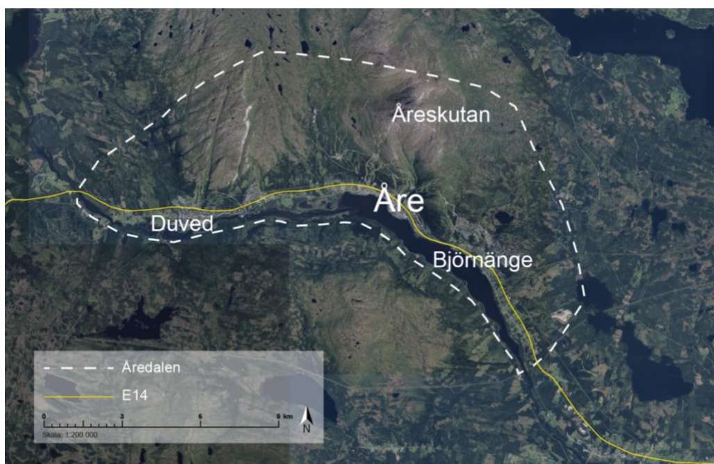
Figur 1. Karta över Åredalen. Ville Risborn (2026).

Antalet gästnätter per år i Åre kommun har de senaste 5 åren legat kring 500 000 gästnätter (Tillväxtverket, 2026). Besökarna är utspridda över hela året men med toppar när det är högsäsong för både vinter- och sommarturism. När det är som flest besökare är i juli, men det är under den totala vintersäsongen, som sträcker sig från december till april, som majoriteten av besöken sker. Utav dessa gästnätter så erbjuder Åre kommun (2022) cirka 42 000 gästbäddar.