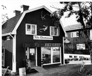
Figur 10. Nils Thomassons affärshus. (Hallings foto, 1972) CC BY-NC 4.0

Ytterligare tecken på Åredalens historiska utveckling visas i figur 10 och 11. Den gamla skidbutiken visar på Åres status som vintersportort och blir ytterligare ett lager i helhetsintrycket av landskapsbilden som förändras från jordbrukslandskap till turistdrivet fjällandskap. Idag är skidbutiken övertagen av Peak Performance som kommer från Åre och även de har främst ett fokus på vintersport. Däremot erbjuder butiken idag utrustning för friluftaktiviteter under alla årstider och speglar hur friluftslivet och naturturismen pågår i Åredalen året runt.