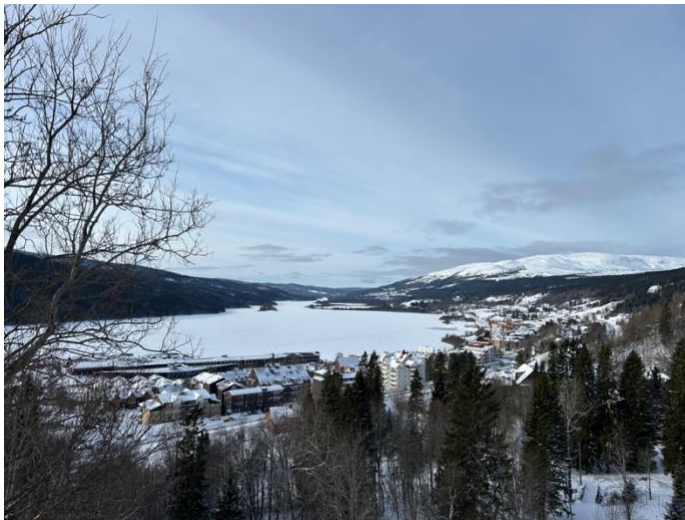
Figur 5. Utsikt över Åredalen från Tottens by.

Jordbruket som präglar landskapet i figur 4 återfinns ej i figur 5 och landskapsbilden idag har en väldigt liten historisk prägel då jordbruksmarken idag utgörs av tillkommen bebyggelse eller andra vegetationstyper som björk och granskog. Skiftet i landskapsbilden visar också på ett skifte i vad Bucht (2004) benämner som deltagande. Deltagaren som tidigare dominerat landskapsbilden genom jordbruket har nu skiftats till betraktaren. Förvaltningen har skiftat fokus då den tidigare förvaltningen fokuserade på jordbruket och ens egna ägor, medan förvaltningen idag finns till för att tillfredsställa de behov som turister ställer på Åredalen.