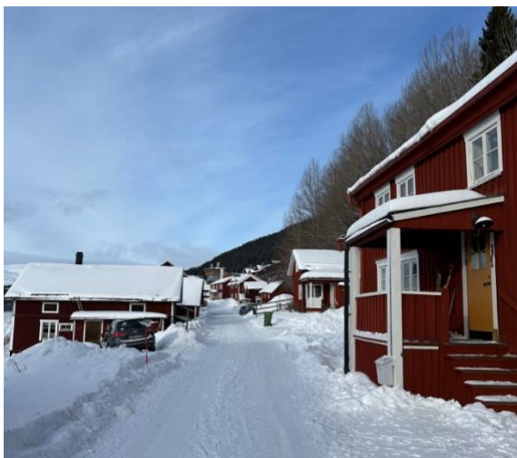
Figur 17. Tottens by. Ville Risborn (2026)

Turistsatsningarna går dock att se från Tottens by då Totthotellet syns i bakgrunden i figur 17. Hotellet utgör ett störande landskapselement i landskapsbilden som annars upplevs annorlunda och distanserad från resterande miljöer i Åredalen där turistfokuset är mer påtagligt.