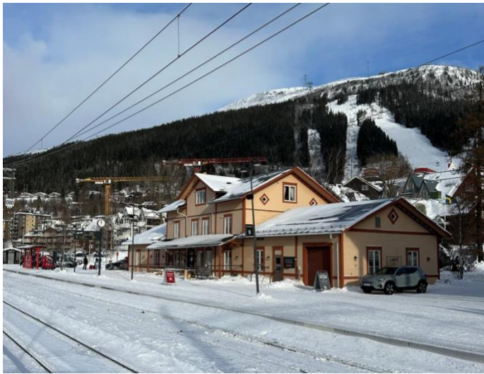
Figur 9. Åre stationshus med Åreskutan i bakgrunden. Ville Risborn (2026)