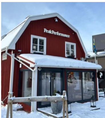
Figur 11. Peak Performance Åre torg. Ville Risborn (2026).