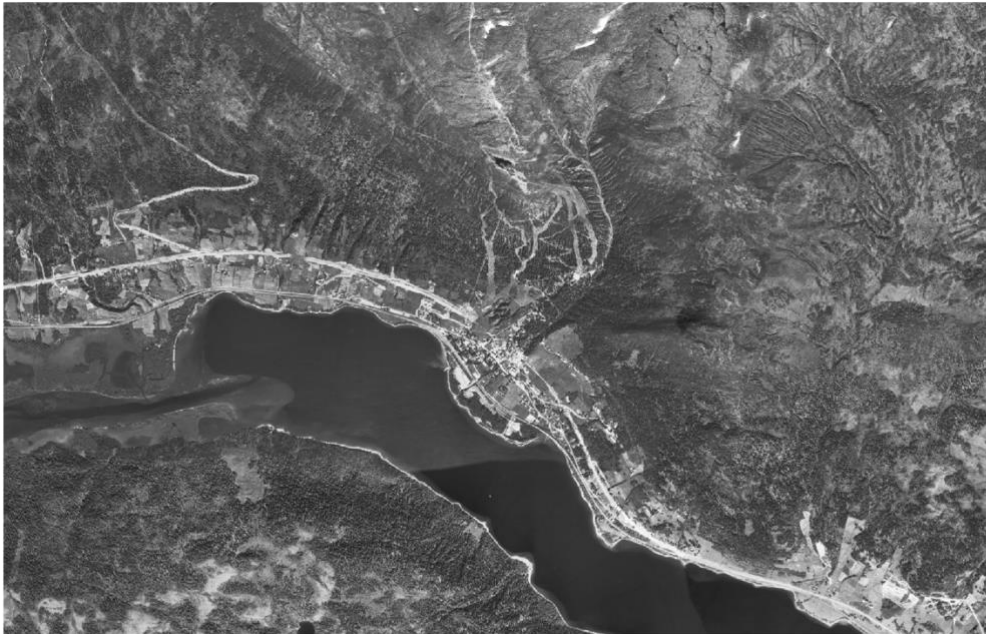
Figur 2. Datakälla: Ortofoto © Lantmäteriet (1960)

Nedan syns ortofoton från Åredalen som visar landskapsbildens förändringar från ovan sedan 1960. Figur 2 visar Åredalen ovanifrån 1960 medan figur 3 visar Åredalen idag med platserna för återfotografering markerade med tillhörande figurnummer. Syftet med bilderna är att tydliggöra och visa de förändringar som visas i landskapsanalysen utifrån det äldre bildmaterialet och återfotografering. Den större fragmenteringen av landskapet och skidsystemets påverkan på landskapsbilden är tydligare från ovan och visar på utsträckningen skidsystemet har i landskapet. Ortofotona visar också hur centrala Åre och övrig bebyggelse har vuxit och blivit en mer slående del i landskapet.