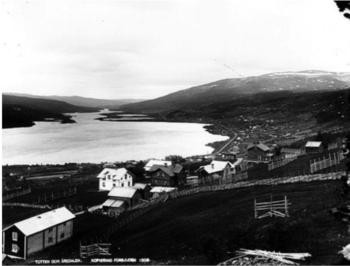
Figur 4. Utsikt över Åredalen från Tottens by (Nils Thomasson, 1909) CC BY-NC-ND 4.0 .