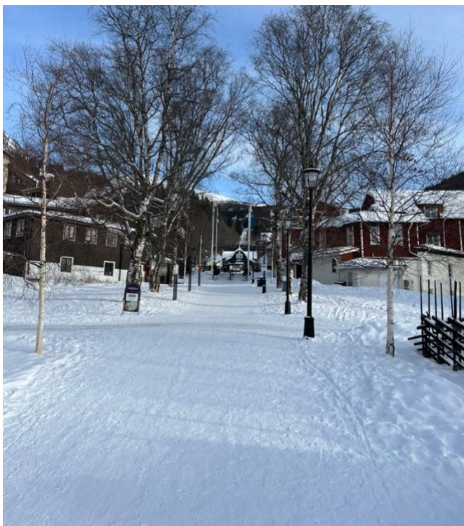
Figur 13. Vy från parken i Åre mot Åre torg. Ville Risborn (2026).

Fortsatt kan vi hur Åre torg har förändrats i figur 14 och 15. Precis som vyn från parken så har landskapet med tiden blockerats och utgör inte idag det starkaste uttrycket i landskapsbilden. Ny bebyggelse som både är högre och placerad högre upp i topografin bakom bergbanan bidrar till förändringen av landskapsbilden. Platsen har däremot idag ett mer mångsidigt syfte som mötesplats och är en naturlig del av livet i Åre med både sportbutiker, restauranger och boenden som omringar torget. Till skillnad från i figur 14 där torgets primära funktion är parkering för dess besökare. Landskapsbilden upplevs mer uppdelad idag mellan inifrån kontra utifrån Åre. Det är två olika upplevelser som erbjuds beroende på om man befinner sig bland bebyggelsen eller som betraktare utifrån. Tidigare har den glesa bebyggelsen och överblicken över resterande landskap skapat ett tydligare enhetligt sammanhang där man idag snarare hoppar mellan två världar, stadslivet kontra friluftslivet.