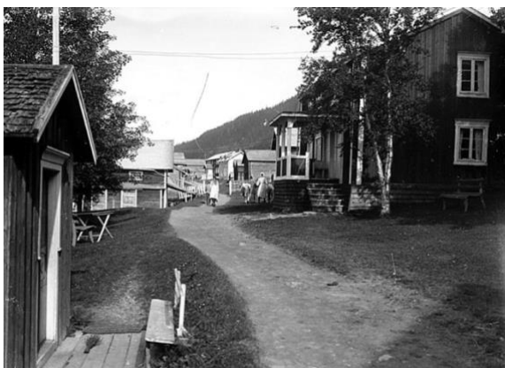
Figur 16. Anders Erikssons gård, Tottens by. (Nils Thomasson) Tidigt 1900-tal. CC BY-NC-ND 4.0

Vid Tottens by i Åredalen är den historiska prägeln som starkast. Här syns bevarade gårdar och gatustrukturer som går att känna igen från figur 16 till figur 17. Trots renoveringar är dessa miljöer sig lika och den plats i Åredalen som upplevs som allra mest småskalig och minst påverkad av exploateringen och tillväxten som syns nedanför i centrala Åre. Platsen är något tagen ur sitt sammanhang idag när gårdsbyggnaderna enbart fyller funktion som boende och jordbruket ej är aktivt. Samtidigt så bidrar de välbevarade strukturerna till igenkännbarheten till det äldre landskapet i Åredalen.