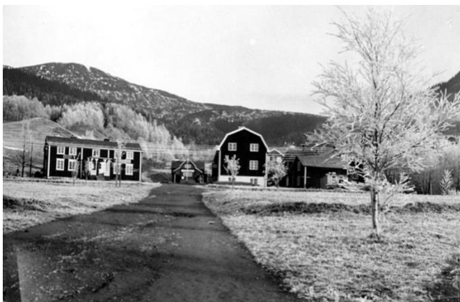
Figur 12. Vy från parken i Åre mot Åre torg. (Nils Thomasson) Tidigt 1900-tal. CC BY-NC-ND 4.0

Utvecklingen i centrala Åre har haft en påverkan på landskapsbilden och reflekterar ortens besökare och dess behov. Figur 12 och 13 visar vyn från parken i Åre upp mot Åre torg med Åreskutan i bakgrunden. Den tidigare glesa bebyggelsen med Åreskutan som dominerande landskapselement har förändrats till en plats som gör att fjället upplevs sekundärt. Idag har platsen utvecklats till en mindre parkmiljö med planterade träd och nya gångstigar. Parken formar en formell passage mellan stationsområdet och torget. Bergbanan och baksidan av Nils Thomassons affärshus/Peak Performance syns i båda figurerna och gör att landskapsbilden känns igenkännbar trots övriga förändringar. Den tillkomna vegetationen i parken idag skymmer Åreskutan och förskjuter fokuset från det stora öppna landskapet till den mer stadsliknande strukturen. Den visuella skalan skiljer sig åt mellan figur 12 och 13 och landskapsbilden är mer präglad av livet i Åre än omkringliggande landskap idag.