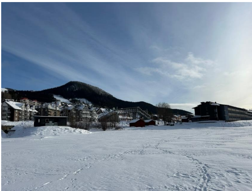
Figur 7. Vy från Åresjön österut. Ville Risborn (2026)