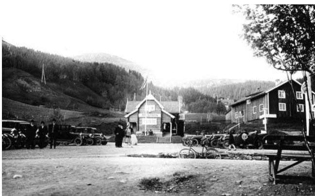
Figur 14. Åre torg och bergbanan. (Nils Thomasson ca 1925) CC BY-NC-ND 4.0

Fortsatt kan vi hur Åre torg har förändrats i figur 14 och 15. Precis som vyn från parken så har landskapet med tiden blockerats och utgör inte idag det starkaste uttrycket i landskapsbilden. Ny bebyggelse som både är högre och placerad högre upp i topografin bakom bergbanan bidrar till förändringen av landskapsbilden. Platsen har däremot idag ett mer mångsidigt syfte som mötesplats och är en naturlig del av livet i Åre med både sportbutiker, restauranger och boenden som omringar torget. Till skillnad från i figur 14 där torgets primära funktion är parkering för dess besökare. Landskapsbilden upplevs mer uppdelad idag mellan inifrån kontra utifrån Åre. Det är två olika upplevelser som erbjuds beroende på om man befinner sig bland bebyggelsen eller som betraktare utifrån. Tidigare har den glesa bebyggelsen och överblicken över resterande landskap skapat ett tydligare enhetligt sammanhang där man idag snarare hoppar mellan två världar, stadslivet kontra friluftslivet.