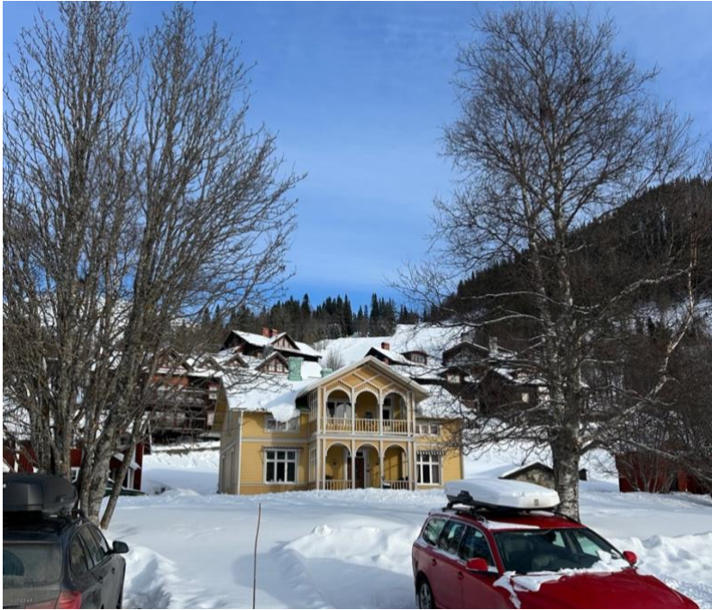
Figur 19. Bevarat gårdshus och vy mot totthummeln. Ville Risborn (2026)